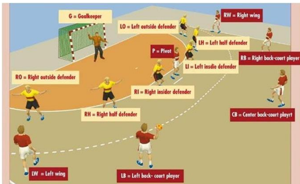
Slika 1. Pozicije u rukometu

Karakterističan morfološki profil primjeren vrhunskim rukometašima je: atletska građa tijela, naglašena uzdužna dimenzija skeleta, proporcionalni omjer koštanog sustava i mišićne mase te smanjeno masno tkivo (Srhoj i sur., 2002). Takav morfološki profil podržava rukometaše da učinkovito izvode tehničko-taktičke strukture igre u stvarnim natjecateljskim uvjetima. Isto tako, postavlja racionalne energetske zahtjeve za kretanje tjelesne mase pojedinog igrača.