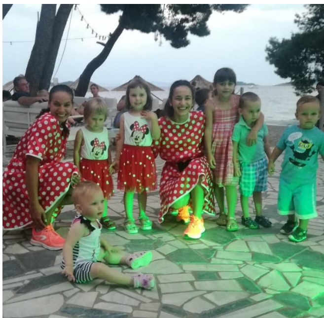
Slika 4 Večernji programi za djecu- Mini disco

Večernji animacijski programi spajaju sve goste objekta pozivaju ih na zajedničko druženje i uživanje. Jedan od takvih primjera je dječja plesna priredba „Mini disco“ gdje djeca prikazuju naučene koreografije tijekom dana (slika 4.).