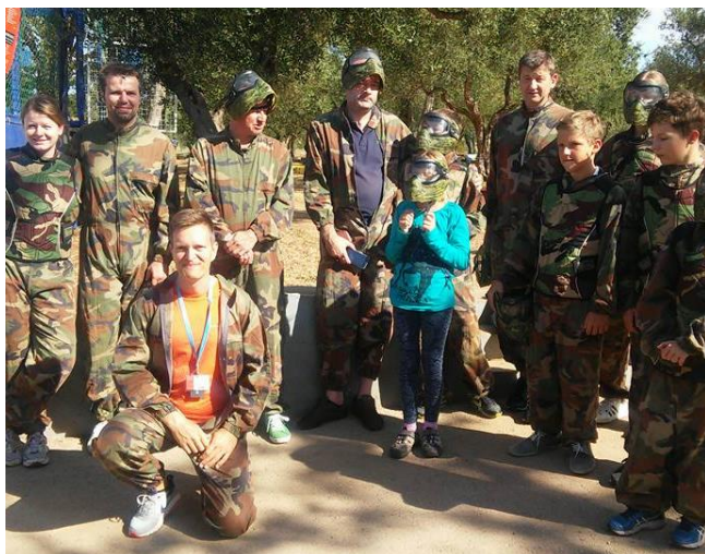
Slika 5 Posebni animacijski programi- paintball

Posebni animacijski programi organiziraju se ukoliko postoji zainteresiranost dovoljnog broja korisnika. Potrebna je nadoplata za najam opreme, kao primjerice u paintballu (slika 5.)