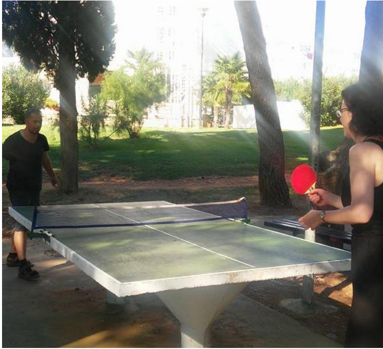
Slika 2 Animacijski programi za odrasle-stolni tenis

Sportsko-animacijski programi podrazumijevaju organizirane sportsko-rekreativne aktivnosti prilagođene većem broju ljudi prezentirane na zabavan način. Jedan od poznatijih trendova u svijetu animacije ovog tipa je aqua aerobic (slika 3.). Više o ovoj vrsti animacijskih programa u daljnjem tekstu.