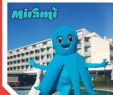
Slika 6 Oglas za posao animatora

Na temelju animacijskih programa koji se provode, agencije iskazuju potrebe za različitim vrstama animatora, te na taj način kreiraju i natječaje za njihovo zapošljavanje. Tako je moguće razlikovati između: