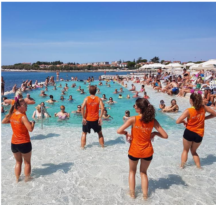
Slika 3 Sportsko-rekreacijski programi za odrasle- aqua aerobic

Sportsko-animacijski programi podrazumijevaju organizirane sportsko-rekreativne aktivnosti prilagođene većem broju ljudi prezentirane na zabavan način. Jedan od poznatijih trendova u svijetu animacije ovog tipa je aqua aerobic (slika 3.). Više o ovoj vrsti animacijskih programa u daljnjem tekstu.