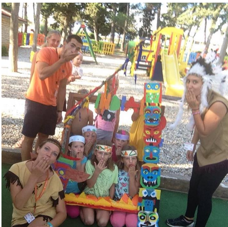
Slika 1 Dnevni programi za djecu- dan Indijanaca

Animacijski programi za djecu organizirani su kao cjelodnevni programi na otvorenom ili zatvorenom, animator svaki dan određuje temu (prema unaprijed smišljenom rasporedu) pa su sve aktivnosti tijekom dana fokusirane na tu temu. Na slici 1. moguće je vidjeti primjer jednog takvog programa, aktivnosti usmjerene na dan Indijanaca i kreativnu izradu kostima.