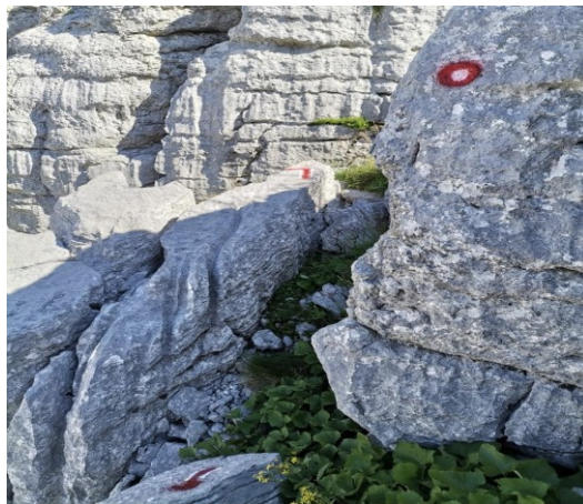
Slika 2. Markacija (Izvor: autorska slika)

Planinarski put je uzak put zemljišta koji je prilagođen planinskom kretanju te koji vodi do određenog planinarskog odredišta (planinarske kuće, jezera, vrha, slapa i sličnog zanimljivog odredišta). Planinarski putovi obilježavaju se planinarskim oznakama (slika 2).