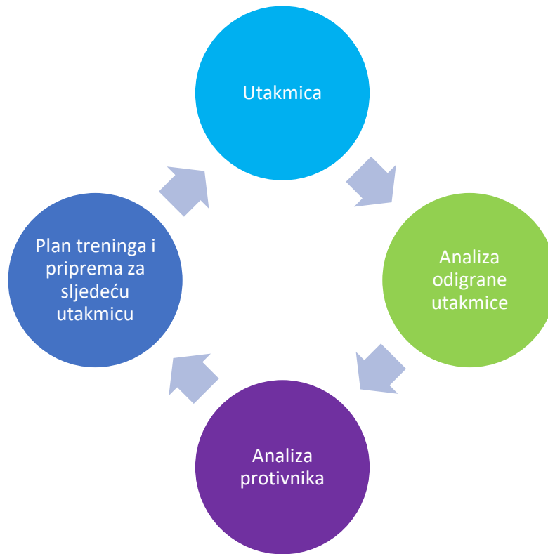
Prikaz 1. Tijek trenažnog procesa u natjecateljskom periodu (modificirano prema Bašić, 2016).

Hughes (2005) smatra da je najveći problem pamćenje svih akcija koje se događaju na terenu, pa izdvaja istraživanje u kojem Franks i Miller (1986) iznose podatak da je ljudsko pamćenje izrazito ograničeno te da se nogometni treneri retrospektivno točno prisjećaju 45% jednog poluvremena, uz napomenu da postoje individualne razlike no uz sve emocije uz teren brzo zaboravljanje normalna je pojava. Stoga je primjena trenutne povratne informacije sve češća u vrhunskom nogometu. Nerijetko se viđaju pomoćnici glavnog trenera sa komunikacijom u uhu čime su povezani sa analitičarom koji snima i prati situaciju iz ptičje perspektive na tribinama pružajući tako dodatnu dimenziju pogleda na utakmicu. Svakako je najbitnija dobra suradnja i znanje koje posjeduje analitičar pa je i lakša primjena tih informacija na terenu. Najveći fokus analitičara nebi trebala biti pozicija lopte jer je visoka vjerojatnost da taj događaj поближе prati glavni trener, već bi se trebao fokusirati na kretanje igrača koji nisu u blizini a potencijalno mogu utjecati na rješenje u datom trenutku. U praktičnom primjeru najčešće se radi o prepoznavanju sustava u kojem suparnička momčad igra, način kojim započinju svoj napad od vratara (otvaranje igre), pozicije