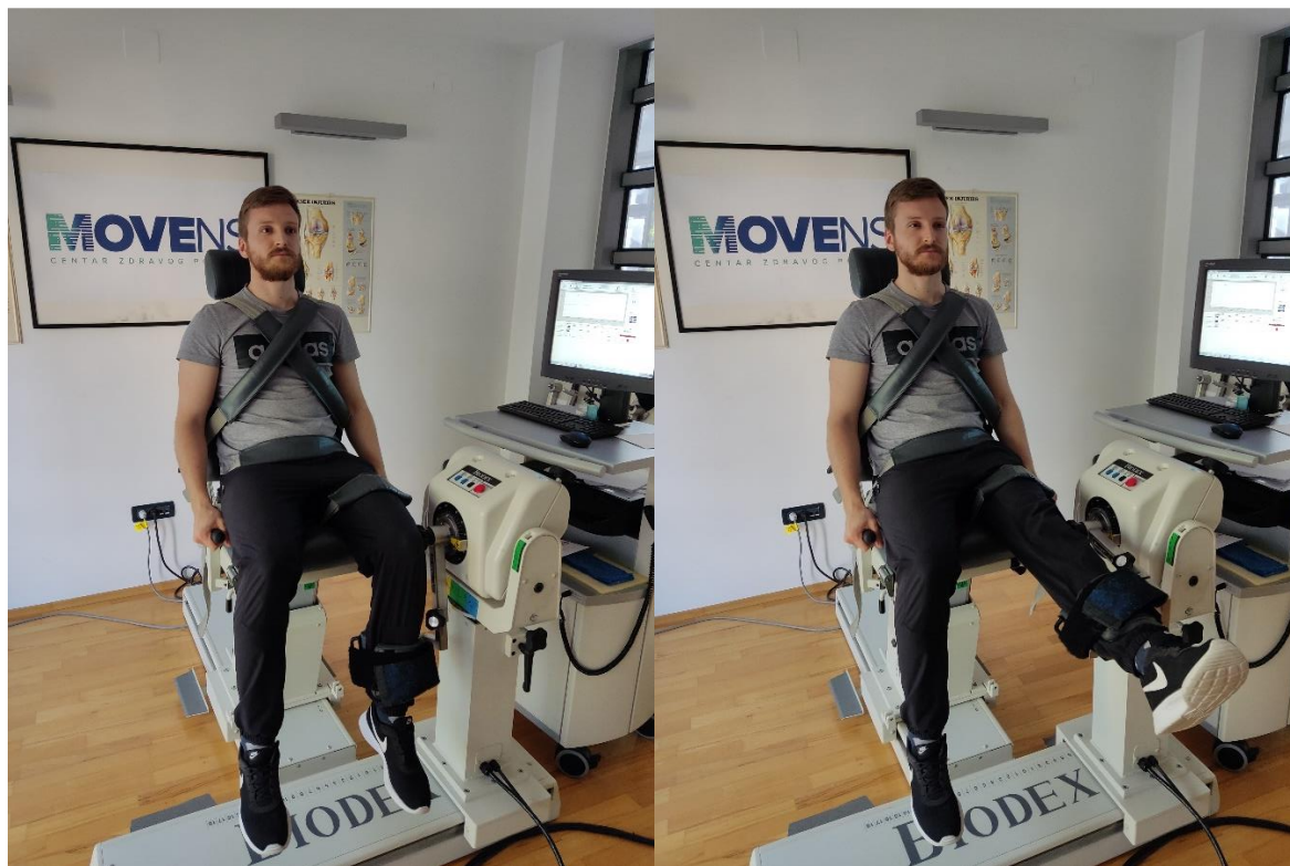
Slike 1 a) i 1 b): Početna i završna pozicija jednog ponavljanja tijekom testiranja jakosti mišića natkoljenice na izokinetičkom dinamometru marke Biodex System 4 Pro.

Odmori između serija na istoj kutnoj brzini bili su 30 sekundi, a odmori između dvije kutne brzine 60 sekundi. Isti protokol provodio se na obje noge. Test se sastojao od 1 serije po 5 ponavljanja na kutnoj brzini od 60 °/s, odmora od 30 sekundi i jedne serije od 15 ponavljanja na kutnoj brzini od 180 °/s. Ispitanika se upućuje da test izvodi maksimalnim intenzitetom. Isti protokol testiranja se provodio na obje noge.