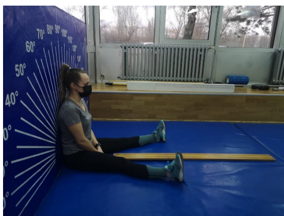
Slika 4. i 5. Pretklon raznožno

Test se izvodi u dvorani. Za izvođenje testa potreban je zid, a ispred zida se povuku linije duge 2 m pod kutom od 45° tako da vrh kuta dodiruje zid. Okomito na zid postavlja se centimetarska traka. Ispitanik sjedne na tlo glavom i leđima uza zid te postavi dlan preko dlana na tlo ispred sebe. Potpuno ispružene noge raznoži pod kutom od 45° te ih prilikom pretklona ne smije savijati u koljenima. Zadatak je da ispitanik izvede što dublji pretklon, ali tako da vrhovi prstiju bez trzaja klize uz traku na podu. Zadatak se izvodi tri puta. Rezultat u testu maksimalna je daljina dohvata od početnog dodira do krajnjeg dodira na centimetarskoj vrpci. Rezultat se očitava u centimetrima, upisuju se sva tri rezultata. (Bojić-Ćaćić, L., 2018)