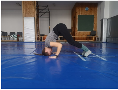
Slika 12., 13. i 14. Polušestarenje