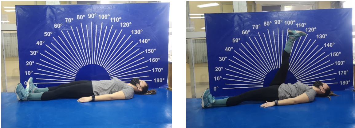
Slika 6. i 7. Prednoženje iz ležanja