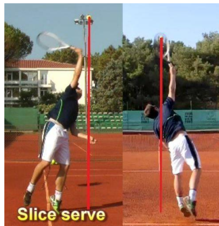
Slika 2. Prikaz slice servisa

Ovaj servis poznat je po velikoj rotaciji koja često zna protivnika izbaciti iz terena te samim time igrač koji servira dobiva prednost. Karakterizira ga specifično bacanje loptice prema desno ali i mala brzina. Za razliku od flat (ravnog) servisa, služi najčešće kao sigurniji drugi servis budući da osim manje brzine ima i veću preciznost.