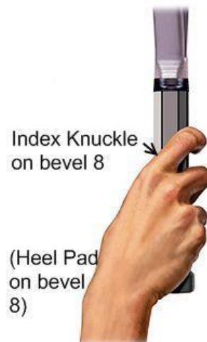
Slika 5. Prikaz istočnog bekind hvata

Ovakav хват najčešće koriste napredniji igrači koji kod svojeg servisa koriste mnogo rotacije te serviraju najčešće top spin servis.