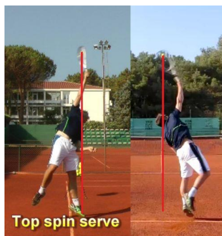
Slika 3. Prikaz top spin servisa

Ovaj servis se kao i slice servis izvodi s mnogo rotacije te se može koristiti kao prvi i drugi servis budući da se njime može postići dovoljna brzina da se stekne prednost nad protivničkim igračem. Bacanje lopte izvodi se blago u lijevo te ovaj servis karakterizira visoki i duboki odskok lopte. Također, ovaj servis je nešto teže usvojiti nego ravni (flat) servis, ali kada se usvoji postane jedno od najvažnijih elemenata za uspjeh na servisu.