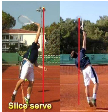
Slika 2. Prikaz slice servisa

Ovaj servis poznat je po velikoj rotaciji koja često zna protivnika izbaciti iz terena te samim time igrač koji servira dobiva prednost. Karakterizira ga specifično bacanje loptice prema desno ali i mala brzina. Za razliku od flat (ravnog) servisa, služi najčešće kao sigurniji drugi servis budući da osim manje brzine ima i veću preciznost.