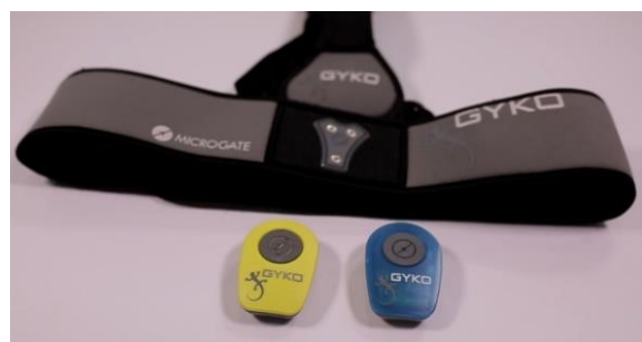
Slika 4. Gyko sustav

Za vrijeme testiranja Gyko senzor je smješten na ispitaniku kod predručenja i odručjenja na lateralnoj strani nadlaktice, a kod prednoženja na lateralnoj strani natkoljenice. Postavljeni senzori ne utječu na izvedbu.