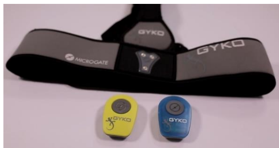
Slika 4. Gyko sustav

Za vrijeme testiranja Gyko senzor je smješten na ispitaniku kod predručenja i odručjenja na lateralnoj strani nadlaktice, a kod prednoženja na lateralnoj strani natkoljenice. Postavljeni senzori ne utječu na izvedbu.