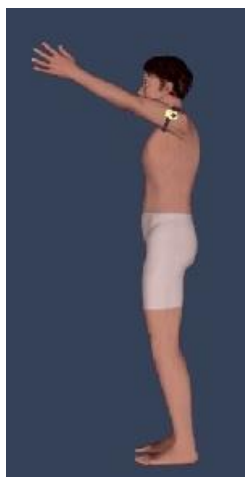
Slika 5. Gyko senzor kod izvedbe predručenja