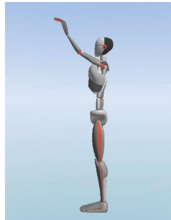
Slika 2. prikaz predručenja