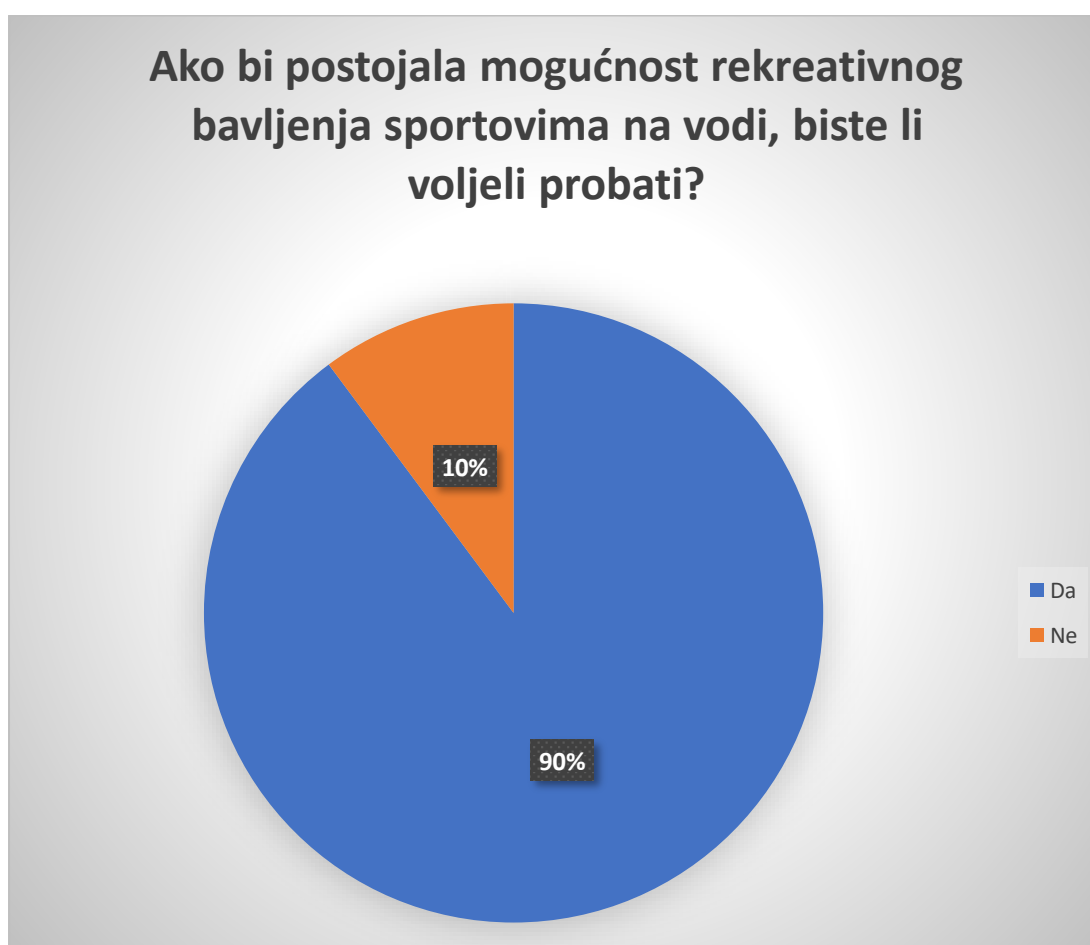
Graf 8. Prikaz rezultata na pitanje „Ako bi postojala mogućnost rekreativnog bavljenja sportovima na vodi, biste li voljeli probati?“