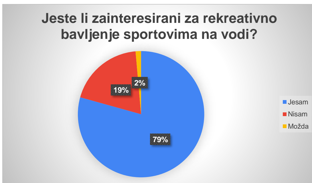
Graf 6. Prikaz rezultata na pitanje „Jeste li zainteresirani za rekreativno bavljenje sportovima na vodi?“

Sljedeće pitanje pokazalo je kojim se sportovima ispitanici žele baviti. Ponuđena im je mogućnost višestrukog odabira. Od ukupnog broja zainteresiranih osoba, 243 (37 %) ispitanika je izabralo veslanje, 193 (30 %) osobe izabrale su kajak, 104 (16 %) ispitanika izabralo je jedrenje i 102 (16 %) ispitanika odabralo je jedrenje na dasci. Kao dodatnu mogućnost, ispitanici su mogli napisati sport na vodi koji se žele baviti. Neki od sportova su „Stand Up Paddling“, Kite-Surfing, Wakeboarding. Nekolicina ispitanika krivo je odgovorilo te pomiješalo sportove na vodi sa sportovima u vodi (Tablica 12., Graf 7.).