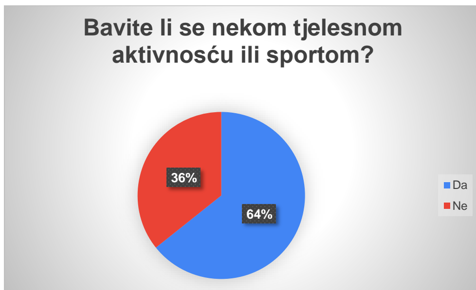
Graf 1. Prikaz rezultata prema tjelesnoj aktivnosti