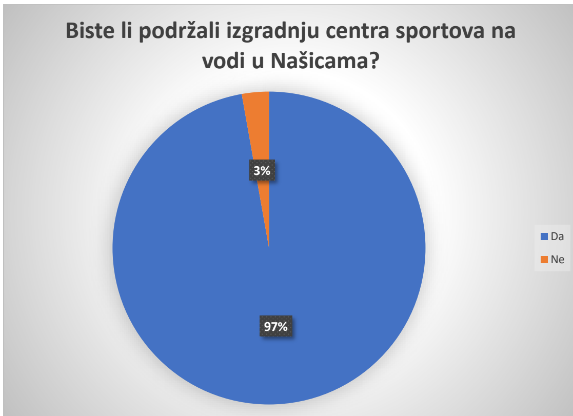
Graf 11. Prikaz rezultata na pitanje „Biste li podržali izgradnju centra sportova na vodi na jezeru Lapovac“?