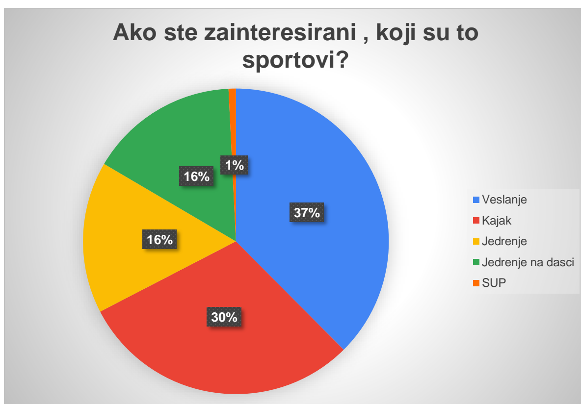
Graf 7. Prikaz rezultata na pitanje „Ako ste zainteresirani, koji su to sportovi?“

Posljednje pitanje daje nam veliki optimizam za izgradnju centra sportova na vodi jer pokazuje veliku zainteresiranost prema sportovima na vodi. Od ukupnog broja ispitanika, 450 (90 %) ispitanika ima želju probati neki od sportova na vodi, a 51 (10 %) ispitanik ne želi probati niti jedan od sportova na vodi. (Tablica 13., Graf 8.)