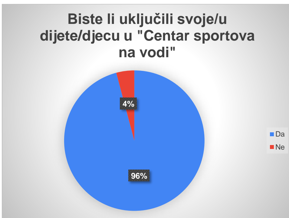
Graf 9. prikaz rezultata na pitanje „Biste li uključili svoje/u dijete/djecu u "Centar sportova na vodi?"“