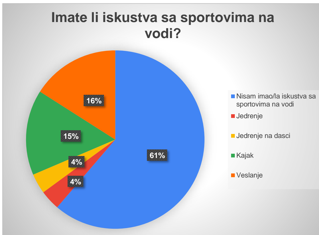
Graf 4. Prikaz rezultata za pitanje „Imate li iskustva sa sportovima na vodi“?

Na temelju idućeg pitanja ćemo saznati kakvo je bilo iskustvo ispitanika koji su imali priliku probati neki od sportova na vodi. Na pitanje „Ako imate, je li to iskustvo bilo pozitivno ili negativno“, 137 (94,5 %) ispitanika je potvrdilo da su imali pozitivno iskustvo sa sportovima na vodi, a 12 (5,5%) ispitanika se izjasnilo da su imali negativno iskustvo. (Tablica 10., Graf 5.)