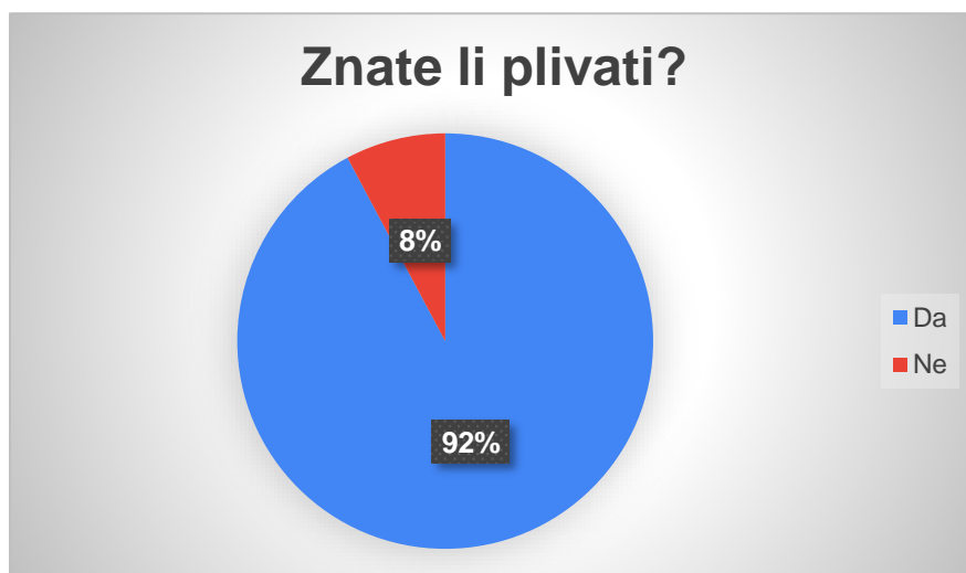
Graf 3. Prikaz rezultata za pitanje „Znate li plivati?“

Sljedeće pitanje glasi „Imate li iskustva sa sportovima na vodi?“. Ovo je jedno od važnijih pitanja u istraživanju jer nam daje uvid u iskustva ispitanika sa različitim sportovima na vodi. Ispitanici su imali mogućnost višestrukog odgovora. Od ukupnog broja populacije, 353 (61 %) ispitanika je odgovorilo da nema iskustva sa sportovima na vodi, 21 (4 %) ispitanik se izjasnio da imaju iskustva sa jedrenjem, 21 (4 %) ispitanik ima iskustva sa jedrenjem na dasci, 89 (15 %) ispitanika imaju iskustva s kajacom i 92 (16 %) ispitanika imaju iskustva s veslanjem (Tablica 9., Graf 4.).