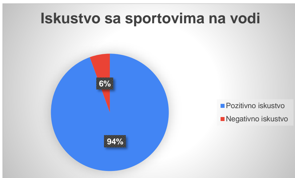
Graf 5. Prikaz rezultata na pitanje „Ako imate, je li to iskustvo pozitivno ili negativno?“

Posljednje pitanje „Ako želite obrazložite svoj odgovor“ nastavak je na prethodno pitanje gdje su se ispitanici mogli izjasniti o svome iskustvu. Činjenica da se 94 % ispitanika izjasnilo da su imali pozitivno iskustvo sa sportovima na vodi ulijeva veliki optimizam za otvaranje centra sportova na vodi.