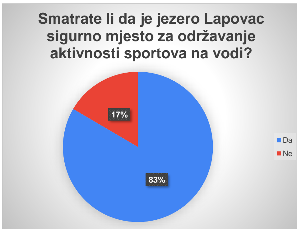
Graf 10. Prikaz rezultata na pitanje „Smatrate li da je jezero Lapovac sigurno mjesto za održavanje aktivnosti sportova na vodi?“