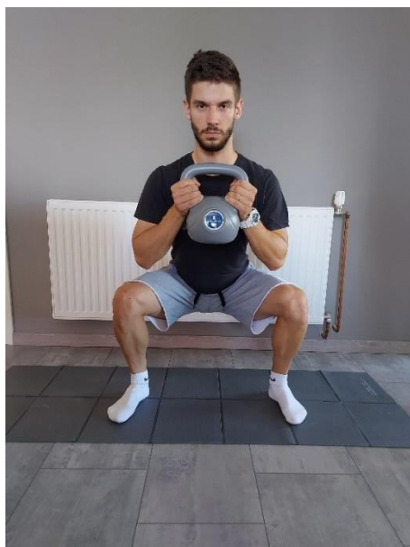
Slika 29. Široki čučanj s girjom