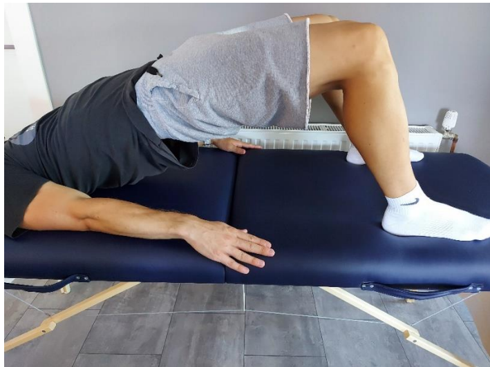
Slika 16. Podizanje kukova