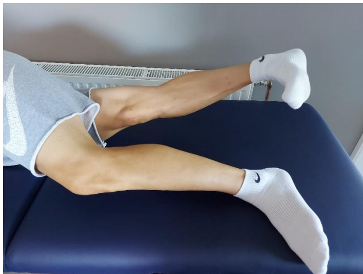
Slika 10. Bočna kontrakcija mišića aduktora natkoljenice