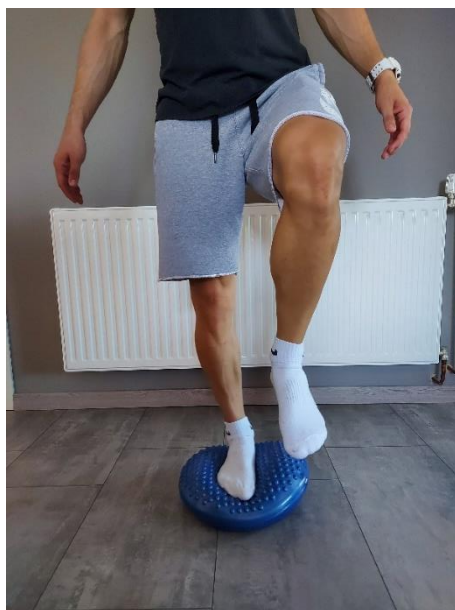
Slika 23. Izdržaj na jednoj nozi