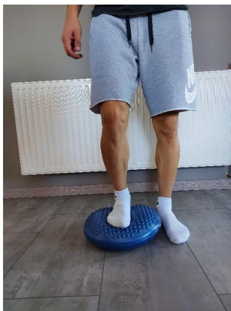
Slika 22. Pripremna faza

Izdržaj jednom nogom na zračnom balans disku. Jedna noga se nalazi na tlu, dok se druga noga nalazi na zračnom balans disku (Slika 22). Druga noga je savijena u koljenu i podignuta u visini kuka (Slika 23). Vježba se izvodi 10-30sekundi svakom nogom. Izvoditi 10 ponavljanja.