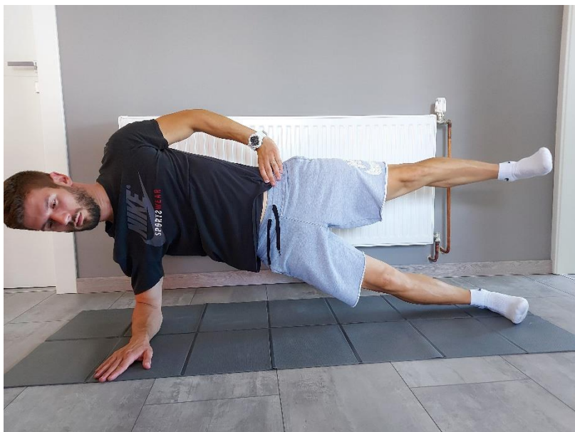
Slika 25. Bočni upor s odnoženjem