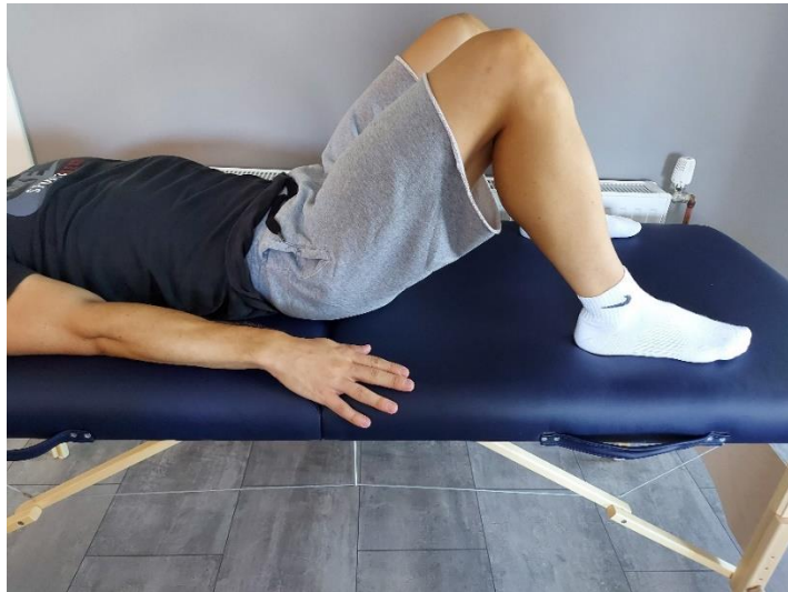
Slika 15. Priprema za podizanje kukova u zrak – mali most

Ležeća pozicija s pogrčenim nogama u koljenu i oslonjenima na puno stopalo (Slika 15). Zatim podići kukove od podloge, oslanjajući se na stopala i lopatice (Slika 16). Gornji položaj zadržavamo 5-10 sekundi, te zatim spustiti i opustiti. Izvodi se 10-15 ponavljanja.