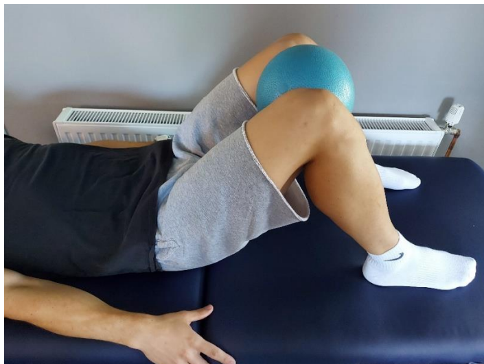
Slika 19. Priprema za podizanje kukova s loptom

Ležeća pozicija s pogrčenim nogama u koljenu i oslonjenima na puno stopalo, mala pilates lopta je između koljena (Slika 19). Zatim podići kukove od podloge, oslanjajući se na stopala i lopatice i koljenima pritišćući pilates loptu aktivirati aduktore (Slika 20). Gornji položaj zadržavati 5-10 sekundi, te zatim spustiti i opustiti. Izvodi se 10-15 ponavljanja.