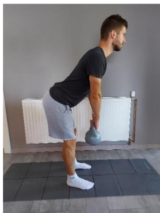
Slika 35. Proces izvođenja pretklona prema naprijed