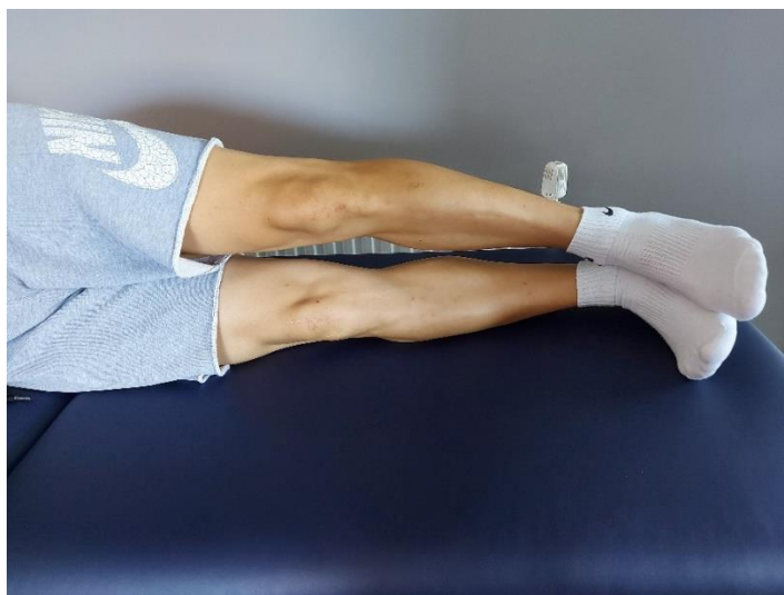
Slika 7. Priprema za odnoženje

Bočna pozicija, gornja noga je opružena, zategnuta (Slika 7), nožni prsti usmjereni prema tijelu i odnožiti gornju nogu, odvajajući je 20cm od donje noge (Slika 8). Gornji položaj zadržavati 5-10 sekundi, te zatim spustiti i opustiti. Svakom nogom izvodimo 10-15 ponavljanja.