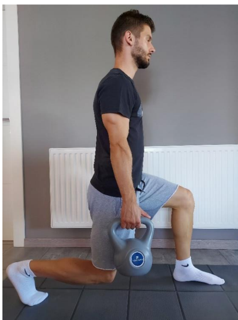
Slika 33. Iskorak s girjom prema naprijed