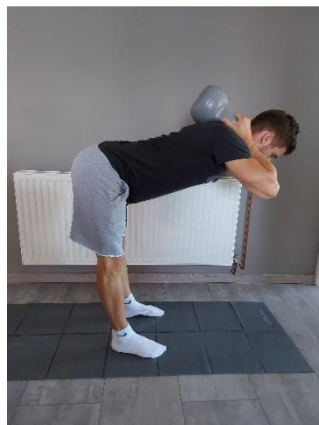
Slika 39. Najniža točka tijelom u pretklonu