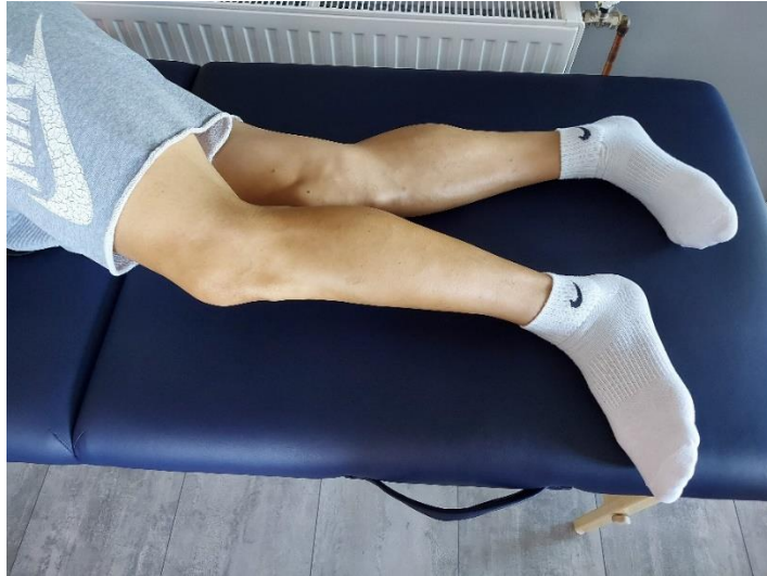
Slika 9. Priprema za bočnu kontrakciju aduktora

Bočna pozicija, gornja noga je prebačena prema naprijed, preko donje noge, i malo je pogrčena (Slika 9). Donja noga je opružena, zategnuta, prsti zategnuti, te slijedi podizanje donje noge od površine koliko je moguće (Slika 10). Gornji položaj zadržati 5-10 sekundi, te zatim spustiti i opustiti. Svakom nogom izvoditi 10-15 ponavljanja.