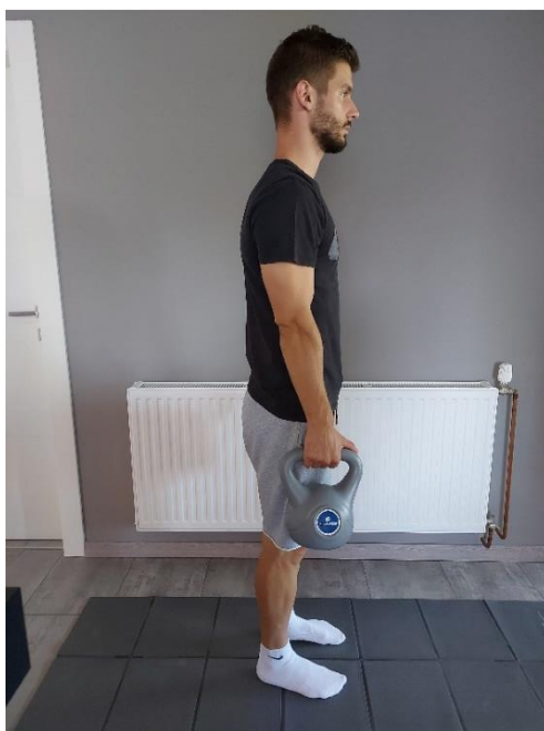
Slika 32. Priprema za iskorak s girjom

Iskorak naprijed s opterećenjem. Opterećenje u vidu girje se nalazi u suprotnoj ruci u odnosu na nogu kojom će se raditi iskorak prema naprijed (Slika 32). Prilikom iskoraka, koljeno stražnje noge ne dotiče pod (Slika 33). Vježba se izvodi svakom nogom po 10 ponavljanja.