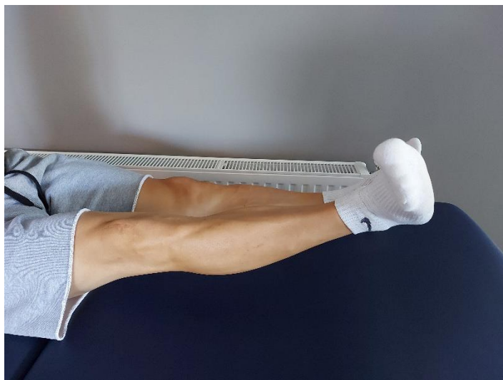
Slika 4. Izometrijska kontrakcija m. vastus lateralis uz podizanje noge