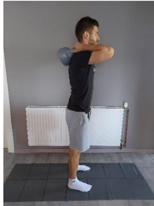
Slika 37. Priprema za izvođenje pokreta

Pretklon trupa s girjom. Girju držimo s obje ruke na lopaticama, širina stava je u širini kukova i idemo naprijed u pretklon (Slika 37). Iz uspravnog stava kukove gurati unatrag, i paziti na položaj kralježnice (Slika 38 i Slika 39). Izvoditi 10 ponavljanja.