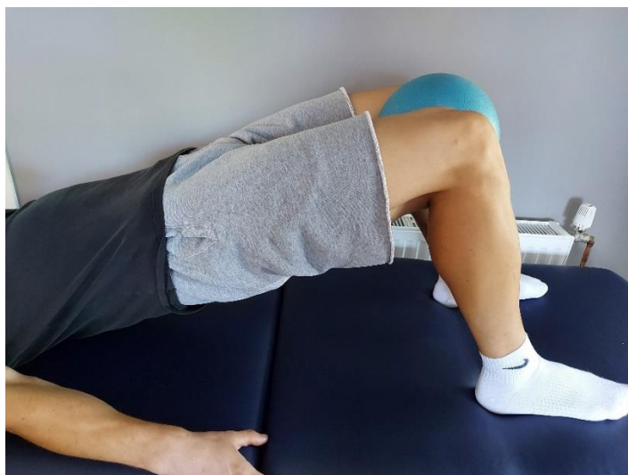
Slika 20. Podizanje kukova s loptom