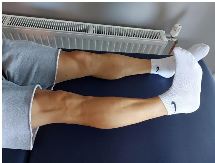
Slika 6. Izometrijska kontrakcija m. vastus medialis uz podizanje noge