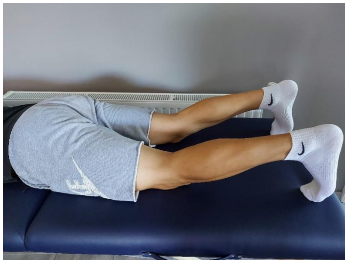
Slika 11. Priprema za podizanje koljena

Ležeća pozicija na trbuhu, noge su opružene i oslonjene na jastučice stopala (Slika 11). Mišići nogu se kontrahiraju, te se podižu koljena od podloge, dok kukovi i jastučići stopala ostaju na podlozi (Slika 12). Gornji položaj se zadržava 5-10 sekundi, te zatim spustiti i opustiti. Izvodi se 10-15 ponavljanja.