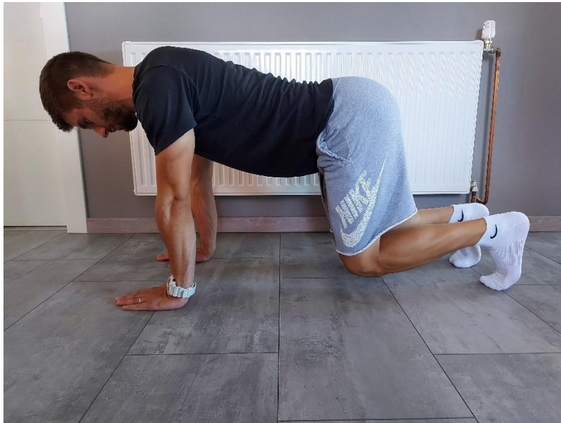
Slika 21. Upor za rukama sa fleksijom od 90° u koljenu

U početnoj fazi oslonac je na dlanove, koljena i jastučice stopala. Zatim se odvajaju koljena od podloge svega par centimetara tako da je pravac između koljena i kukova okomiti na podlogu i pravac između ramena i dlanova također okomit na podlogu (Slika 21). Takva pozicija se zadržava 10-30 sekundi, ovisno u kakvoj je formi osoba. Izvodi se 10 ponavljanja.