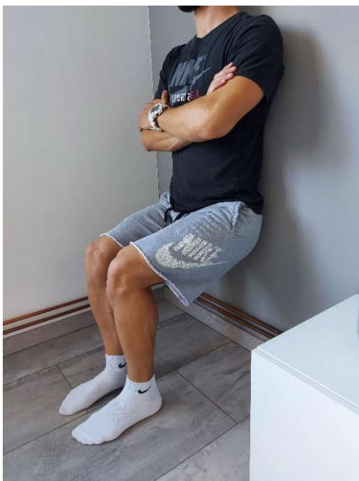
Slika 41. Izdržaj uza zid (2)