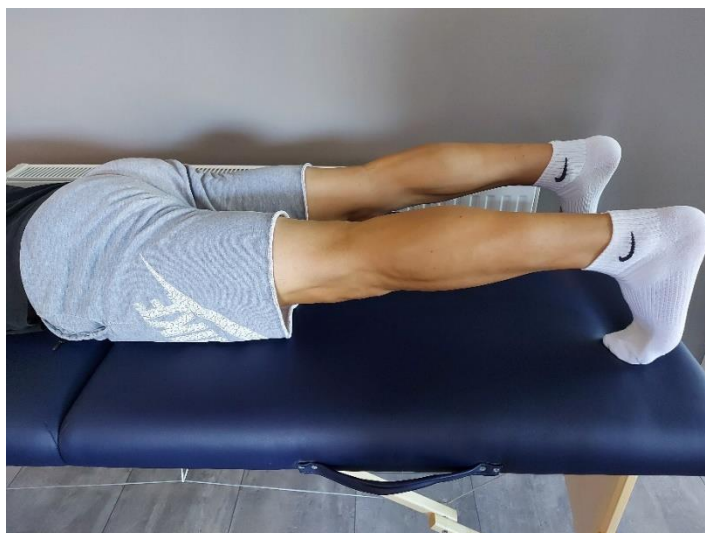
Slika 12. Kontrakcija mišića nogu