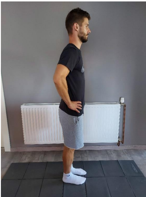
Slika 30. Uspravna pozicija za iskorak

Iskorak prema naprijed (Slika 30). Prilikom iskoraka, koljeno stražnje noge ne dotiče pod (Slika 31). Vježba se izvodi svakom nogom po 10 ponavljanja.