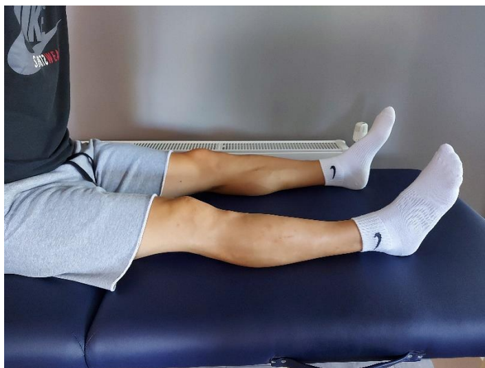
Slika 3. Početna faza

Noga je opružena, zaključana u koljenu (Slika 3), nožni prsti zategnuti, noga se podiže 15-cm od poda, te se stopalo okreće prema van za 45 stupnjeva (Slika 4). Gornji položaj se zadržava 5-10 sekundi, te zatim nogu spuštamo i opuštamo. Svakom nogom izvodimo 10-15 ponavljanja.