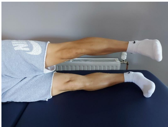
Slika 8. Odnoženje