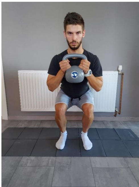
Slika 27. Čučanj s girjom