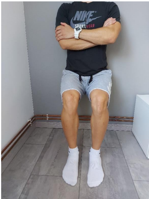
Slika 40. Izdržaj uza zid (1)

Izdržaj u poziciji čučnja uza zid. Koljena su u fleksiji do 90° (Slika 40 i Slika 41). Vježbu izvodimo 15-30 sekundi, 10 ponavljanja.