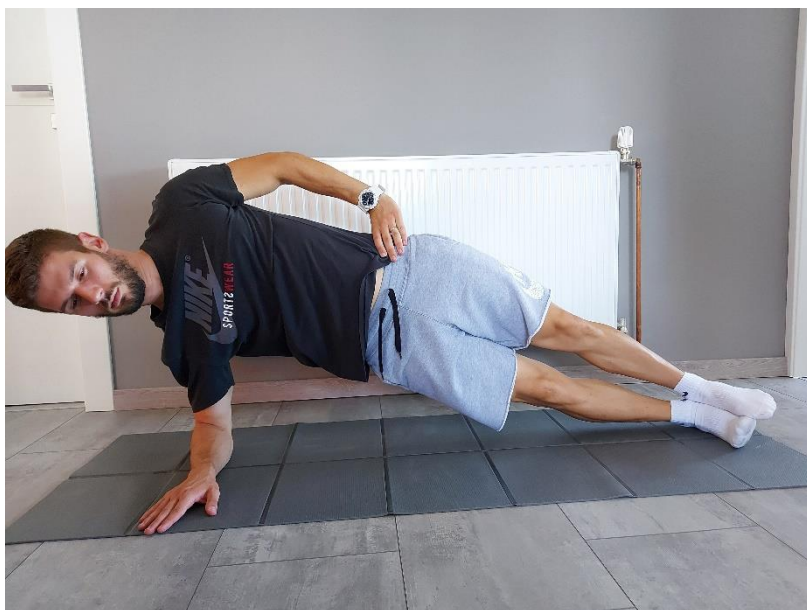
Slika 24. Bočni upor

Bočni upor s odnoživanjem gornje noge. Nalazimo se u bočnom izdržaju i zadatak nam je odvojiti gornju nogu od donje. U gornjem aktivnom položaju ostajemo 10 sekundi i spuštamo nogu dolje i opustimo. Vježbu izvodimo 10 ponavljanja.