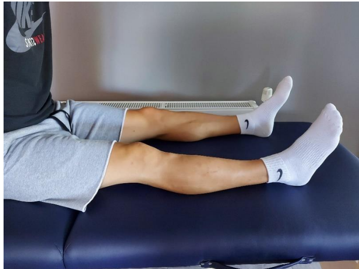
Slika 5. Početna faza

Noga je opružena, zaključana u koljenu (Slika 5), nožni prsti zategnuti, noga se podiže 15-ak cm od poda, te se stopalo okreće prema drugoj nozi za 45 stupnjeva (Slika 6). Gornji položaj zadržavamo 5-10 sekundi, te zatim spustimo i opustimo. Svakom nogom izvodimo 10-15 ponavljanja.