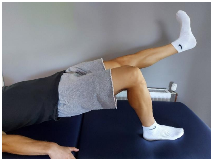
Slika 18. Mali most s jednom nogom opruženom u produžetku tijela