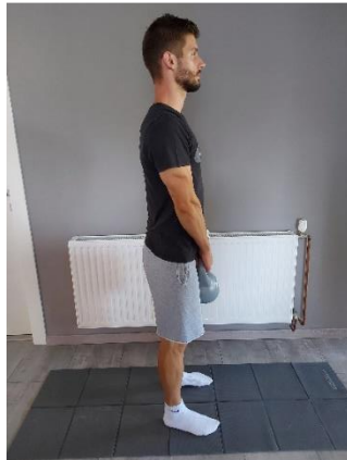
Slika 34. Uspravan položaj za pretklon tijelom

Mrtvo dizanje na opružene noge (Slika 34). Iz uspravnog položaja, kukove gurati unatrag, a girju spuštamo u visini nožnih prstiju (Slika 35 i Slika 36). Izvoditi 10 ponavljanja.