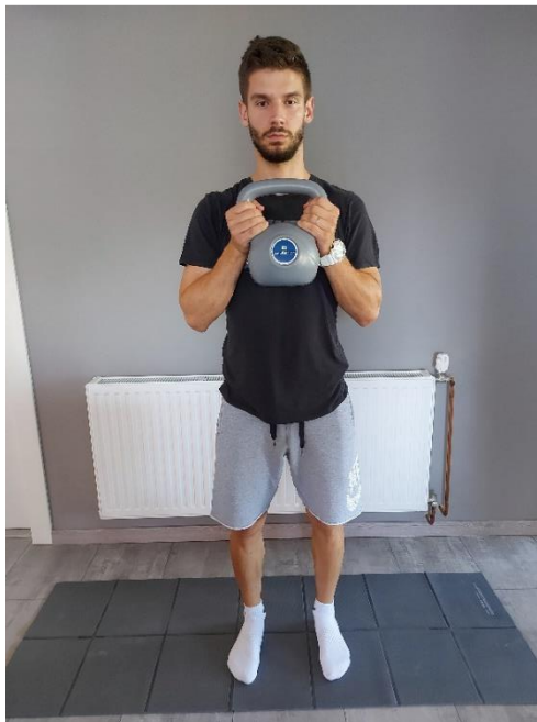
Slika 26. Priprema za čučanj

Čučanj s opterećenjem (Slika 26). Čučanj ćemo izvoditi s girjom, stav je širine kukova, a girja se nalazi u visini prsiju (Slika 27). Izvoditi 10 ponavljanja.