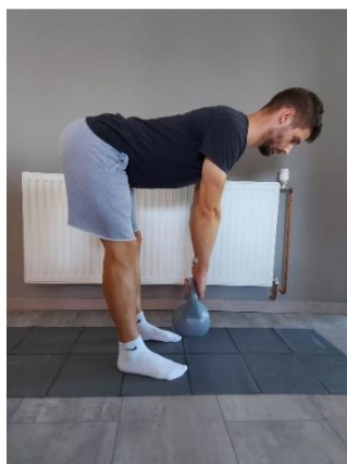
Slika 36. Najniža točka do koje ide gornji dio tijela