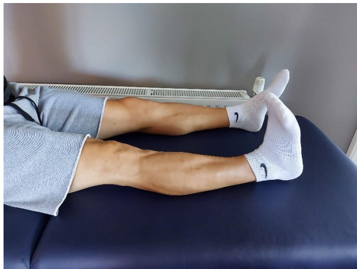
Slika 2. Izometrička kontrakcija mišića prednje strane natkoljenice