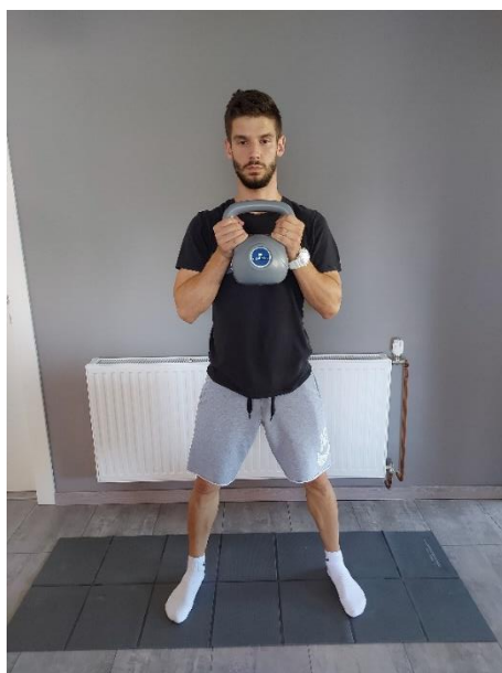
Slika 28. Priprema za široki čučanj

Čučanj s opterećenjem. Čučanj ćemo izvoditi s girjom, stav će biti u širini ramena i girja se nalazi u visini prsiju (Slika 28). Prilikom izvođenja vježbe paziti ćemo da nam koljena ne idu prema unutrašnjosti (Slika 29). Izvoditi 10 ponavljanja.