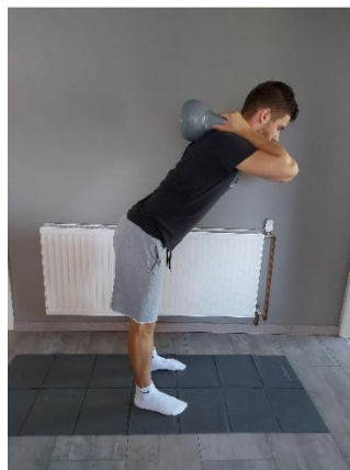
Slika 38. Proces izvođenja pretklona