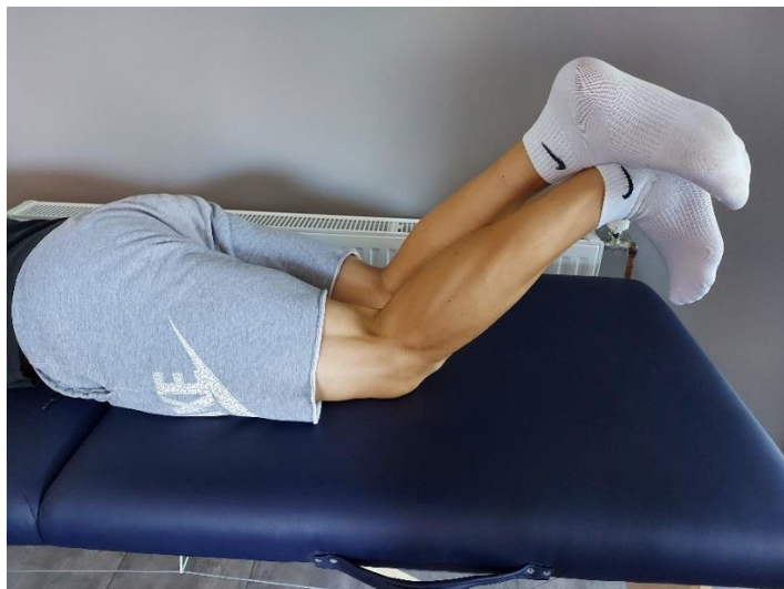
Slika 14. Aktivacija mišića stražnje strane natkoljenice