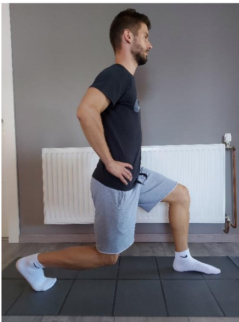
Slika 31. Iskorak prema naprijed