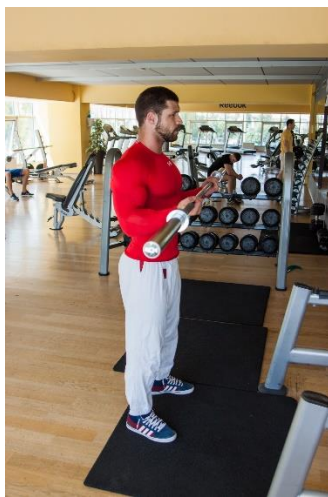
Slika br. 66