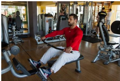
Slika br. 58

Sjedeće veslanje je vježba koja se izvodi na trenažeru. Vježbač sjedi na klupici, uspravnih leđa i blago pogrčenih nogu u koljenom zglobu, čvrsto s obje ruke držeći šipku (sl. br. 58). Izuzetno je važno da prilikom izvođenja ove vježbe, vježbač pazi na položaj leđa. Vrlo su česte ozljede u lumbalnom dijelu kralježnice i stoga prilikom ove vježbe treba biti pažljiv i nepovećavati opterećenje na račun tehnike. Vježbač započinje povlačenje šipke u visini prsa, podižući visoko laktove (sl. br. 59). Šipku je potrebno povući do prsa, ukoliko fleksibilnost u ramenome zglobu to dopušta, a to će ovisiti o individualnim obilježjima vježbača.(sl. br. 60). Nakon koncentrične faze, slijedi ekscentrična i vraćanje u početni položaj (sl. br. 58). Intenzitet opterećenja ove vježbe biti će 60 - 80% od 1RM. Broj ponavljanja kretat će se od 4 –8 ponavljanja unutar jedne serije, kroz 4 –5 serija. Pauza između serija trajat će 2 – 3 minute. Provođit će se aktivna pauza, dakle istežanje i relaksacija.