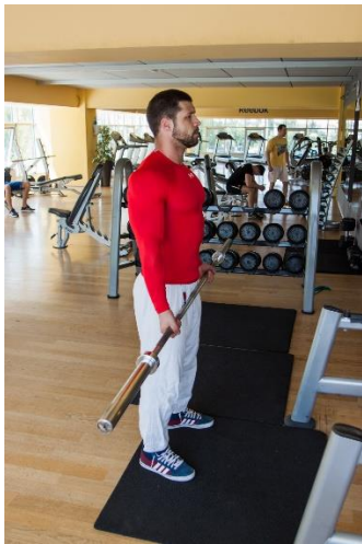
Slika br. 65

Vježbač prilikom izvođenja ove vježbe stoji u paralelnom stavu, stopalima raširenim u širini kukova (sl. br. 65). Ruke vježbača držeći dvoručni uteg, nalaze se u maksimalnoj ekstenziji (sl. br. 65). Iz tog početnog položaja, započinje izvođenje vježbe. Vježba se izvodi na takav način da vježbač izvodi biceps pregib, tako da vrši maksimalnu fleksiju ruke. Kada je postignuta maksimalna fleksija u lakatnome zglobu, to je pozicija koju vježbač mora zadržati zadano vrijeme ili što je duže moguće (sl. br. 66). Intenzitet opterećenja ove vježbe biti će 80% od 1RM. Vježba će se ponavljati 3 – 4 puta. Pauza između ponavljanja trajat će 4– 5 minute. Provodit će se aktivna pauza, dakle istezanje i relaksacija.