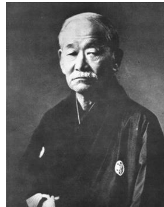
Slika 1. Jigoro Kano

Tehnika juda smatra se jednom od najbogatijih zato što je čini jako puno zajedničkih elemenata, još više izvedbenih varijanata tih tehničkih elemenata, kao i neiscrpna gibanja koja se izvode radi provođenja tehničko-taktičkih zamisli. Bogatstvo i raznolikost pokreta u judu posljedica je činjenice da se tehnike izvode usklađenim i kombiniranim pokretima u raznim smjerovima sagitalne, frontalne i horizontalne ravnine. Bogatstvu judaške tehnike pridonosi činjenica da svaki novi protivnik zahtjeva djelomične korekcije u izvedbi usvojenih dinamičkih stereotipa zato da bi