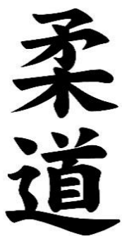
Slika 2. Ju - do

tehnika i u promjenljivim uvjetima izravne borbe bila efikasna. Promjenjivi uvjeti borbe, uzrokovani karakterističnom građom protivnikova tijela, za protivnika karakterističnim hvatom i gardom, vlastitim i protivnikovim specifičnim stilom borbe, načinom kretanja, protivnikovim tehničkim repertoarom, traže od judaša da bude motorički kreativan te da bude u stanju u dijelu sekunde modificirati dinamički stereotip kako bi u novonastalim prostorno-vremenskim biomehaničkim odnosima učinkovito reagirao