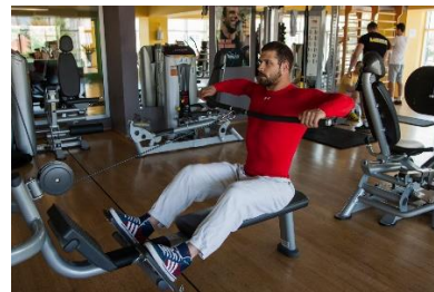
Slika br. 60