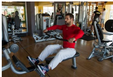
Slika br. 59