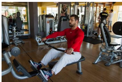
Slika br. 58

Sjedeće veslanje je vježba koja se izvodi na trenažeru. Vježbač sjedi na klupici, uspravnih leđa i blago pogrčenih nogu u koljenom zglobu, čvrsto s obje ruke držeći šipku (sl. br. 58). Izuzetno je važno da prilikom izvođenja ove vježbe, vježbač pazi na položaj leđa. Vrlo su česte ozljede u lumbalnom dijelu kralježnice i stoga prilikom ove vježbe treba biti pažljiv i nepovećavati opterećenje na račun tehnike. Vježbač započinje povlačenje šipke u visini prsa, podižući visoko laktove (sl. br. 59). Šipku je potrebno povući do prsa, ukoliko fleksibilnost u ramenome zglobu to dopušta, a to će ovisiti o individualnim obilježjima vježbača.(sl. br. 60). Nakon koncentrične faze, slijedi ekscentrična i vraćanje u početni položaj (sl. br. 58). Intenzitet opterećenja ove vježbe biti će 60 - 80% od 1RM. Broj ponavljanja kretat će se od 4 –8 ponavljanja unutar jedne serije, kroz 4 –5 serija. Pauza između serija trajat će 2 – 3 minute. Provođit će se aktivna pauza, dakle istežanje i relaksacija.