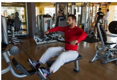
Slika br. 59