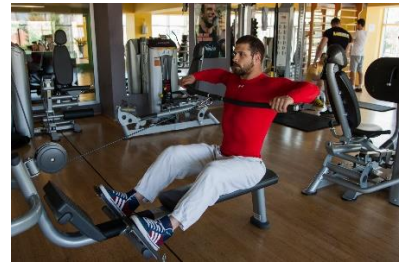
Slika br. 60