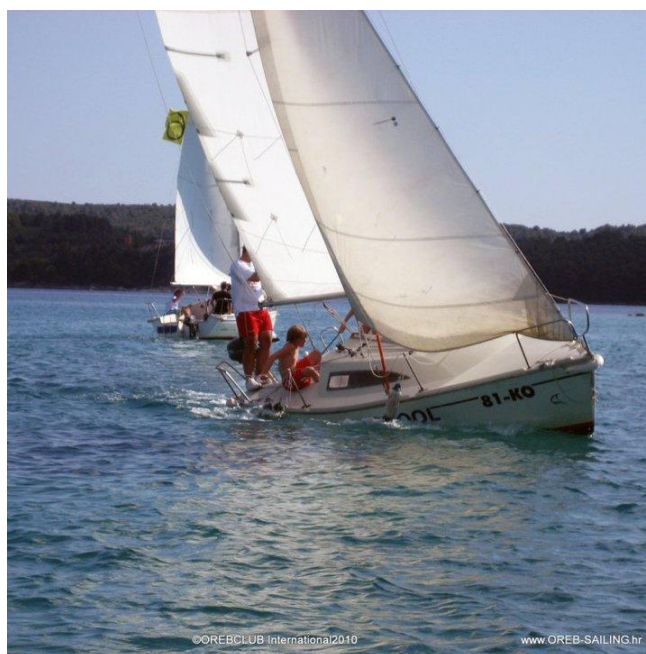
Slika 1. prihvaćanje

Prihvaćanje je element kod kojeg se krećemo iz jedrenja niz vjetar prema vjetru sve do smjera kretanja kad jedrimo oštro uz vjetar. Prihvaćanje je promjena smjera kretanja iz maksimalnog otpadanja do maksimalnog prihvaćanja. Pozicija maksimalnog prihvaćanja je otprilike 45 stupnjeva u odnosu na smjer puhanja vjetra.