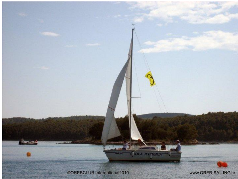
Slika 3. Otpadanje

Zaustavljanjem promjene kursa u smjeru maksimalnog otpadanja smanjujemo mogućnost ulaska u nekontrolirano kruženje i tim povećavamo samu sigurnost jedriličara.