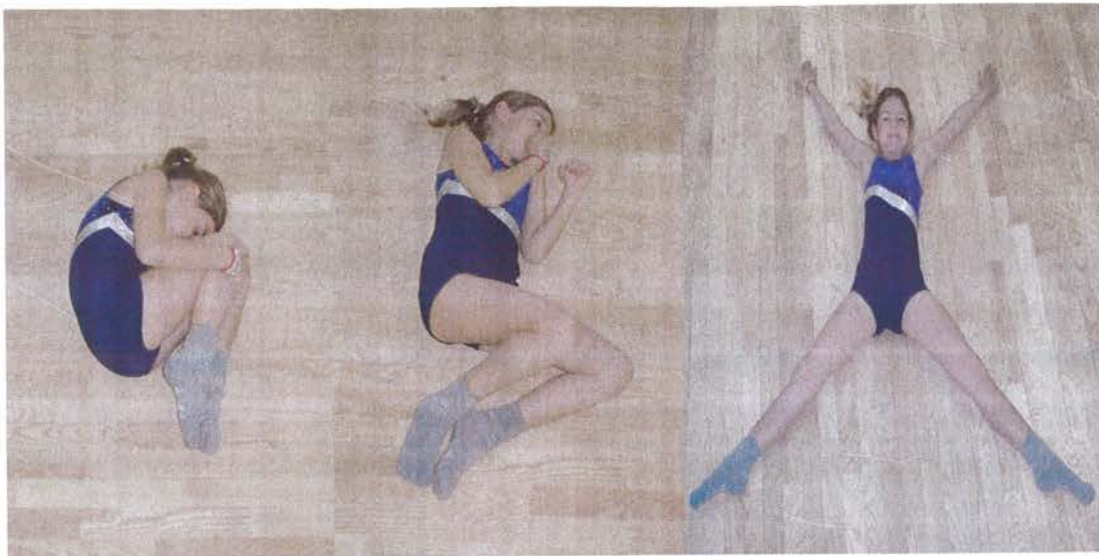
Slika 6. Širenje poput morske zvijezde