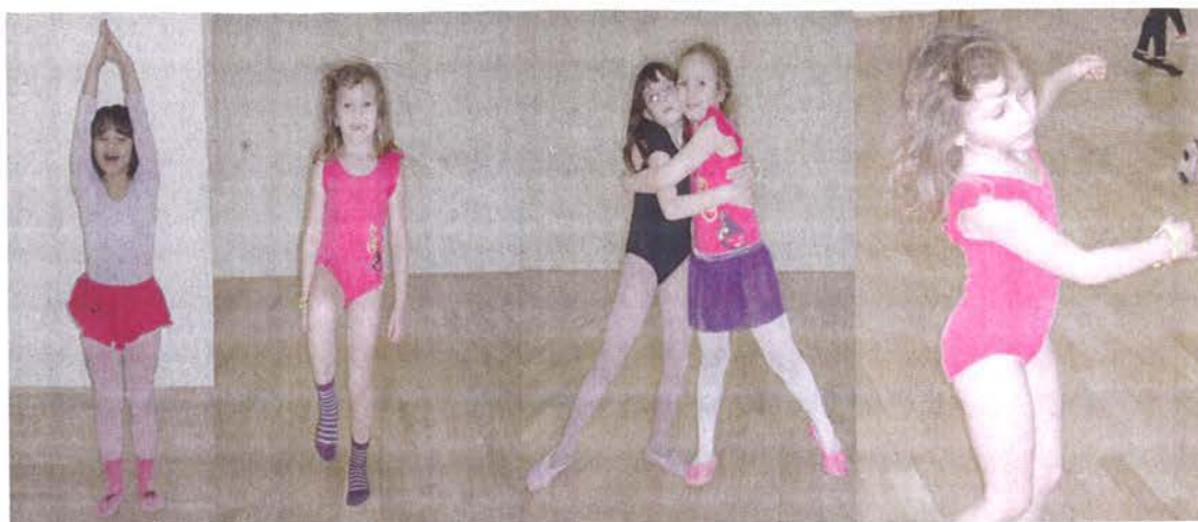
Slika 5. Brojalica u pokretu

I na kraju uvodnog dijela sata, primjenom dinamičkih kretanja potrebno je staviti u pokret sve dijelove tijela, pripremiti organizam na povećane napore na satu, utjecati na jačanje mišića, na razvoj opće motorike i na povećane funkcije dišnog i krvožilnog sustava. Primjerene vježbe za djecu tog uzrasta su: istraživanje različitih mogućnosti kretanja kad zamislimo hodanje u različitoj obući, ili zamislimo kretanje po različitoj podlozi, ili kretanje kao odraz različitih raspoloženja ili radnji (hod po prstima kao da nosimo visoke pete ili branje voća ili prave se važnima; hod po petama - ljutnja, stupanje – kao vojska u čizmama, trčanje – kao sportaši u tenisiceama, hod u čučnju – sakupljanje predmeta s tla, stavljanje voća u košaru i slično).