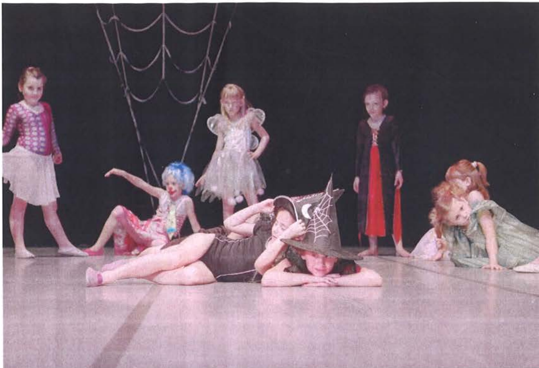
Slika 14. Igračke na tavanu