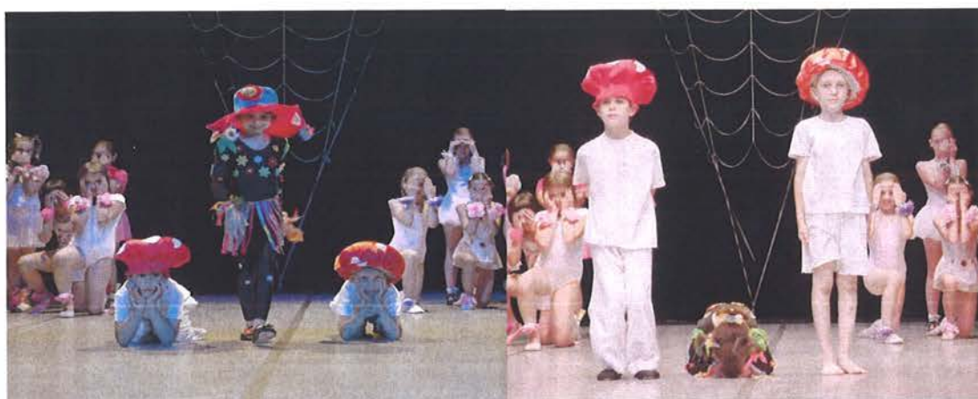
Slika 4. Primjerena dramatizacija

Izbor sadržaja, oblici rada i sredstva koja će se primijeniti, ovise o nekoliko čimbenika: dob i broj djece, homogena ili nehomogena skupina, prostor te sadržaj glavnog dijela sata. Pri izboru sadržaja svakako treba paziti da motorička gibanja budu primjerena dobi i djeci razumljiva, da osiguravaju izmjenu napora i odmora kako se djeca ne bi preopteretila ili ozlijedila. 11 Također je nužno da su dramatizacije prilagođene dobi polaznika (slika 4).