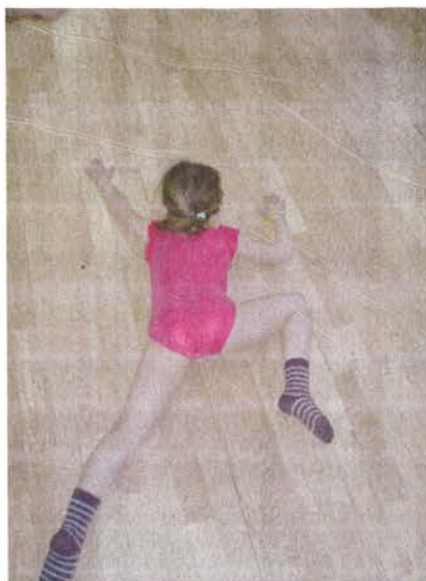
Slika 11. Puzanje poput guštera