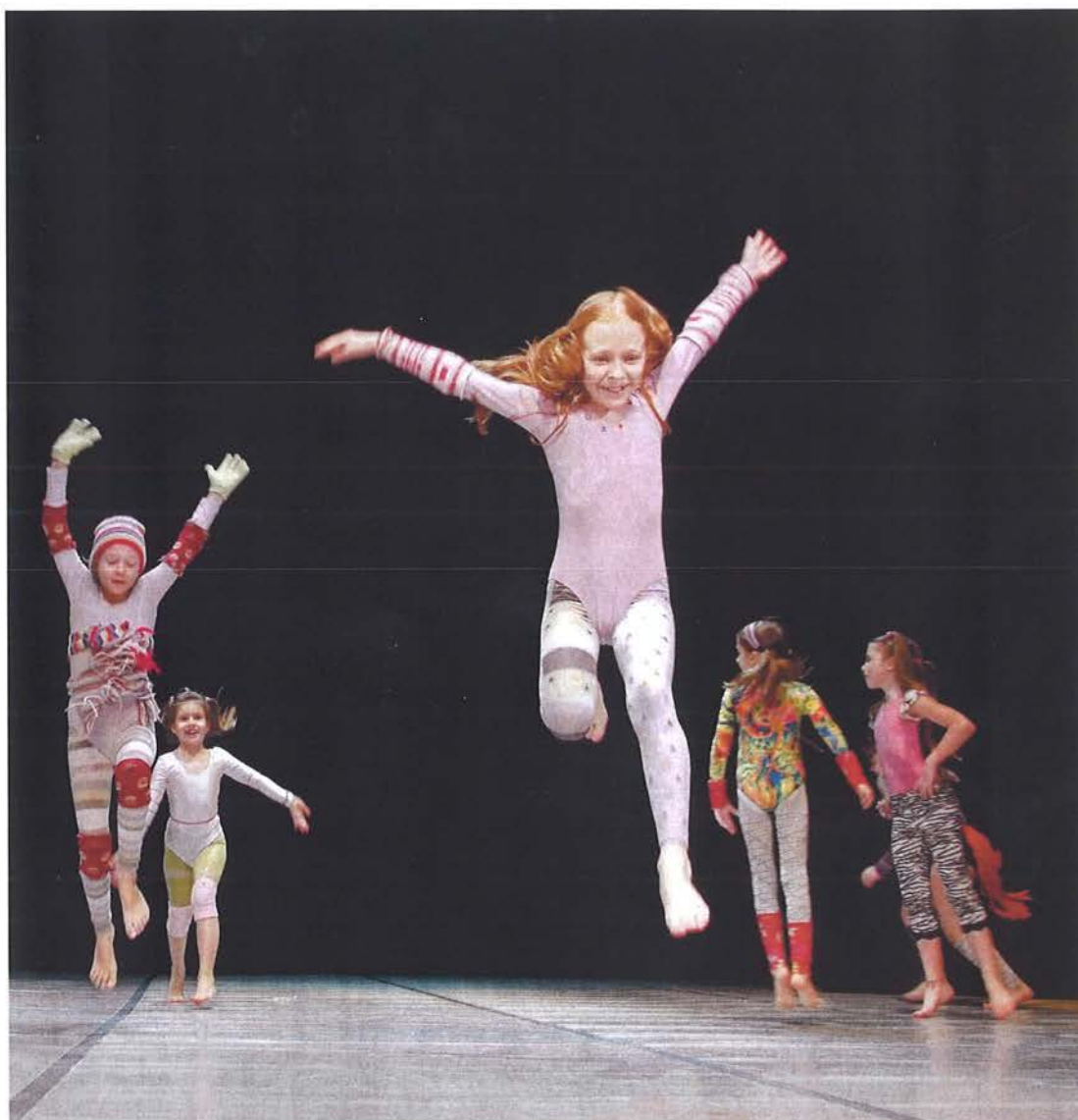
Slika 1. Dječja improvizacija

Svi navedeni razlozi ukazuju na važnost što ranijeg uključivanja djece u predškolske rekreacijske plesno-ritmičke programe te oblikuju ciljeve takovih programa.