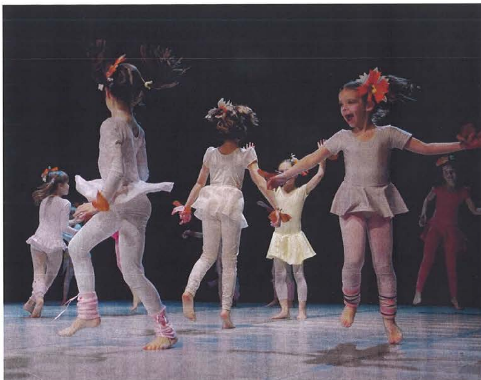
Slika 3. Dječje spontano i nesputano izražavanje

Oblikovanju kratkih plesnih kompozicija prethodi improvizacija, odnosno dječje spontano i nesputano izražavanje tijelom svojeg osobnog doživljaja određene teme na poticaj pedagoga i uz pomoć glazbe (slika 3). Sljedeći korak je odabir odgovarajućih pokreta i oblikovanje kratke plesne sekvence. Nakon utvrđivanja odabrane sekvence pokreta pristupa se njezinom uvježbavanju i izrađivanju. Kako bi izbjegli dosadu pri izvježbavanju sekvence potrebno je djecu svaki puta usmjeriti na različite aspekte izvedbe: tehnički moment, ritam, dinamički moment, usmjerenost pažnje, izražajnost pokreta. Isto tako, budući da se radi o predškolskom uzrastu nije uputno često ponavljati istu sekvencu na jednom satu, već samo uvježbavanje određene sekvence rasporediti kroz više nastavnih sati. Završni korak u stvaralačkom procesu je faza konačnog koreografskog oblikovanja koji podrazumjeva spajanje više sekvenci u jednu smislenu cjelinu, raznolikost grupnih odnosa, prostornih promjena, mogućnost ponavljanja itd.