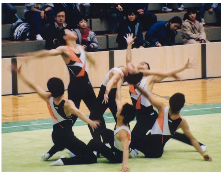
Slika 4. Grupna vježba

Muška ritmička gimnastika, isto kao i za gimnastičarke, se sastoji od grupnog i individualnog natjecanja. Grupna natjecanja se sastoje od šest gimnastičara koji izvode „slobodnu vježbu“ na natjecateljskom podiju, bez rekvizita (Slika 4.).