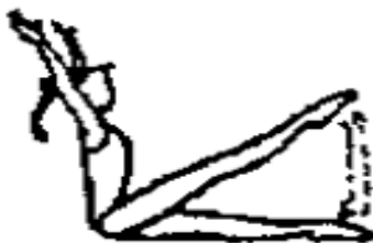
Slika 29. Škarice