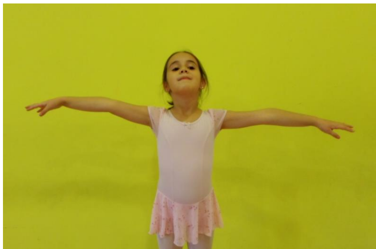
Slika 18. Odručenje