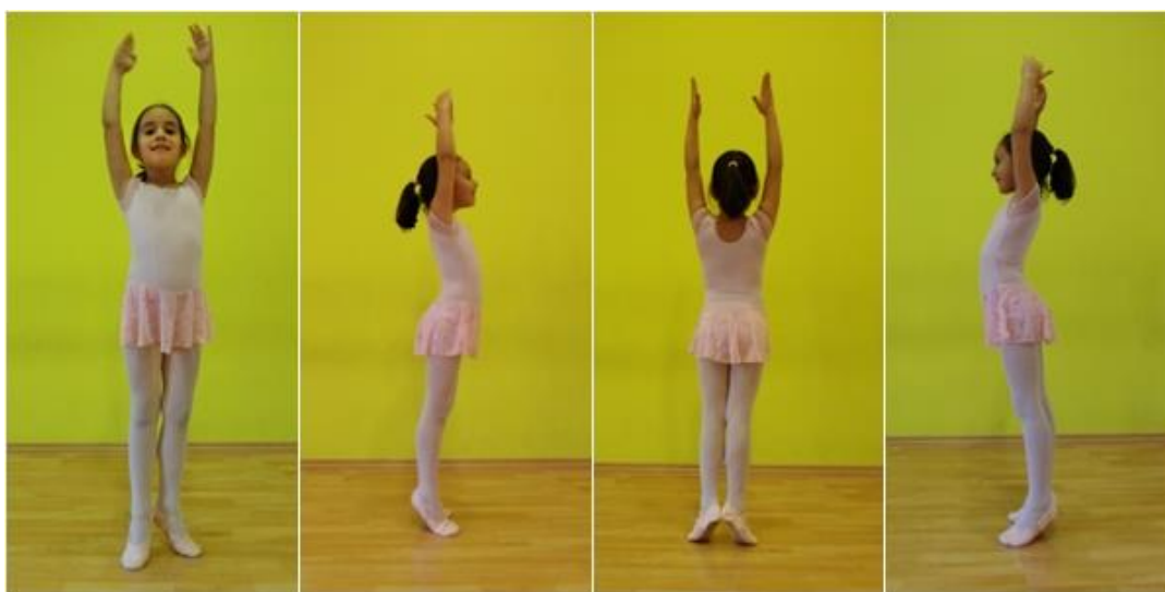
Slika 25. Sunožni okret s rukama u uzručenju

Sunožni okret ili „balerina“ je okret na obje noge sitnim koracima u usponu, u desno ili u lijevo za 360°, dok ruke mogu biti u različitim položajima – oslonjene o bok, odručene, uzručene.