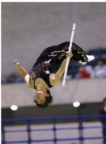
Slika 5. Štap