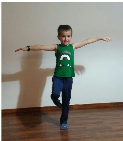
Slika 32. Passe ravnoteža

Suvremeno društvo pomiče barijere između muškaraca i žena u raznim djelatnostima pa tako i u sportu. U bliskoj budućnosti nadamo se uključivanju dječaka predškolske dobi u ritmičku gimnastiku i kod nas. (Slika 32. i 33.)