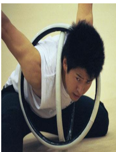
Slika 7. Dva mala obruča