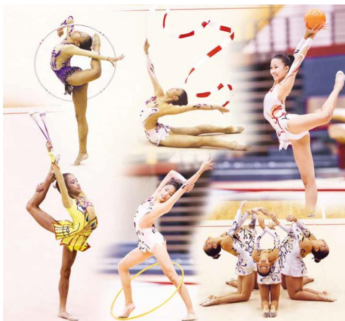
Slika 1. Ritmička gimnastika

Od početaka civilizacije do danas očita je povezanost plesa i ženskog vježbanja, od klasičnih plesova starih Grka do pravaca i škola modernog plesa 20. stoljeća. To je bila preteća jednog novog sporta – ritmičke gimnastike. (Slika 1.)