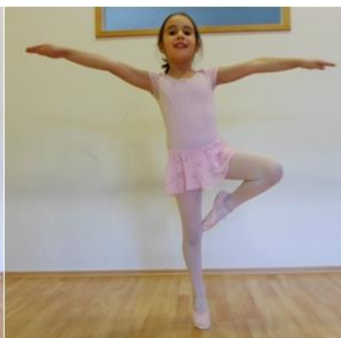
Slika 23. Otvorena passe ravnoteža u usponu