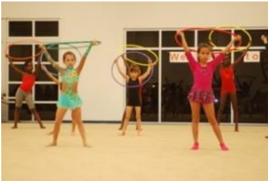
Slika 14. Obruč

Obruč se drži lagano kako bi bio mobilan u pokretima. Može se držati pothvatom ili nathvatom. Kod vrtnje obruč leži između palca i kažiprsta, meko, a šaka je centar pokreta. (Wolf-Cvitak, 2004.) Međutim, djecu vrtićke dobi prvo učimo vrtiti obruč oko zapešća.