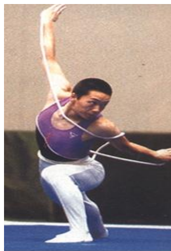
Slika 6. Vijača