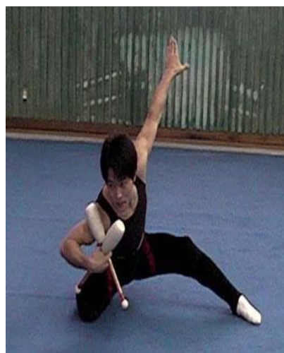
Slika 8. Čunjevi

U studenom 2003. u Japanu je održano prvo službeno natjecanje pod nazivom “Men’s RG World Championship”. To natjecanje okupilo je pet zemalja s dva kontinenta, a sudjelovali su gimnastičari iz Japana, Kanade, Koreje, Malezije i SAD-a. Na sljedećem Svjetskom prvenstvu održanom 2005. godine broj zemalja sudionica se povećava pa su tako nastupale ekipe iz Australije, Rusije, Japana, Kanade, Malezije, Koreje i USA. (Jurinec, Furjan-Mandić, Kolarec, 2008.)