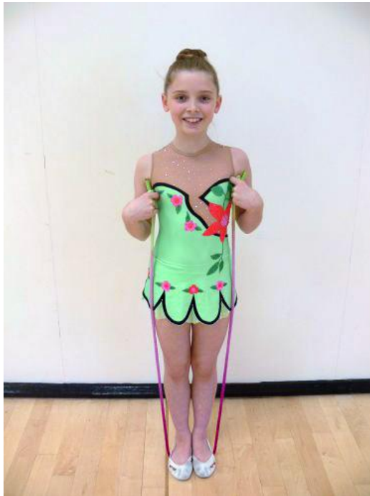
Slika 12. Duljina vijače (preuzeto sa: http://rhythmicgymnastics.org.uk/rhythmic-gymnastics-rope/ )

Prije nego što se vijača podjeli djeci, obavezno se mora pregledati. Na krajevima vijača mora imati čvor, a nikako plastični ili metalni završetak kojim se djeca mogu povrijediti. Kod podjele vijača, također se mora obratiti pažnja na duljinu; kad dijete stane na sredinu vijače, njeni krajevi morali bi sezati do visine pazuha (Slika 12.).