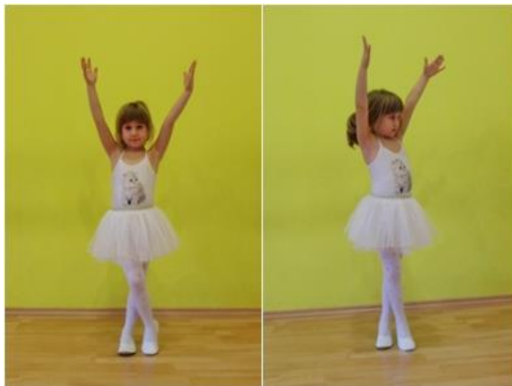
Slika 26. Križni okret s rukama u uzručenju

Križni okret ili „šerafić“ je okret na obje noge, u kojem se jedna noga križa ispred druge i okret se izvodi za 180° u suprotnu stranu od prednje noge, dok ruke mogu biti oslonjene o bok ili u uzručenju.