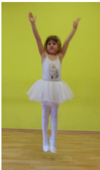
Slika 28. Sunožni pruženi skok