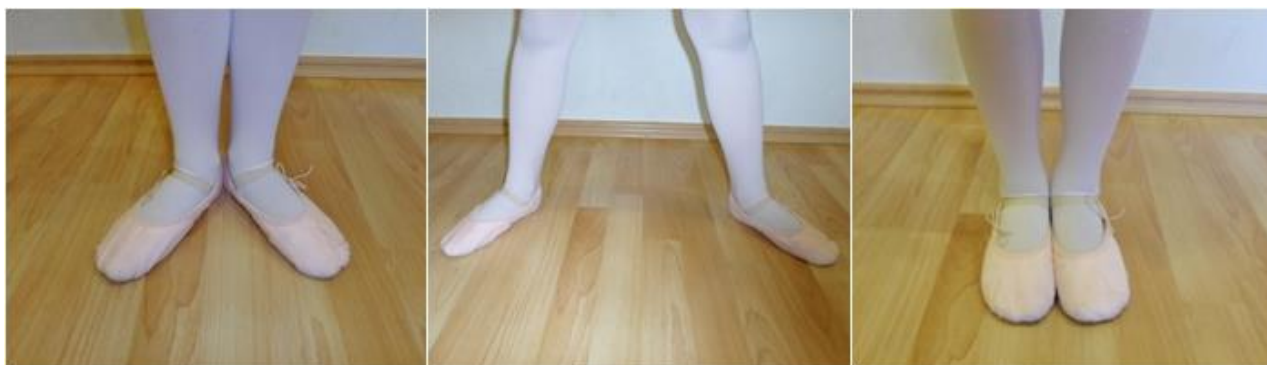
Slika 19. Prva