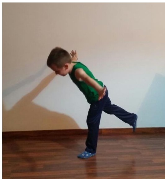
Slika 33. Vaga