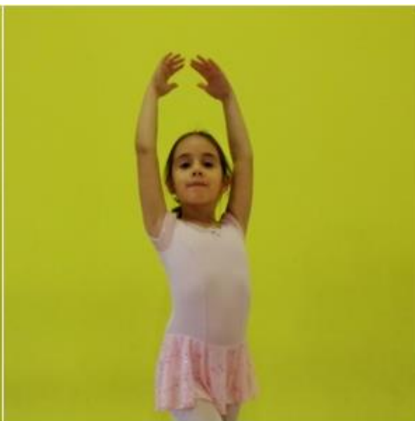
Slika 17. Uzručenje