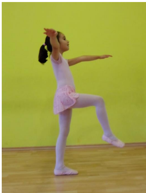
Slika 27. Predvježba za dječji poskok