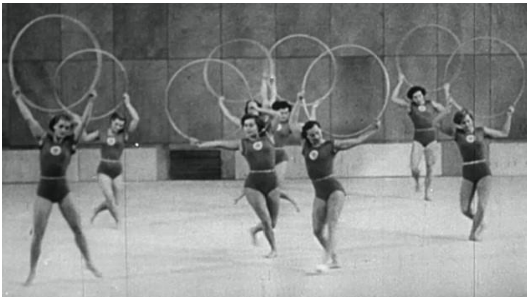
Slika 2. Helsinki 1952.

Na prvom pojedinačnom prvenstvu Sovjetskog Saveza 1949. g. natjecale su se vježbačice sa četiri natjecateljska sastava. Od 1950. g. prihvaćene su kvalifikacijske norme za natjecanja koje su određivale program, norme i organizacijske zahtjeve za sve kategorije natjecateljica. (Slika 2.)