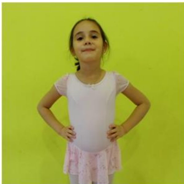
Slika 16. Ruke na boku

Najčešća držanja ruku djece vrtićke dobi su: ruke pogrčene na boku (Slika 16.), uzručenje (Slika 17.) i odručenje (Slika 18.)