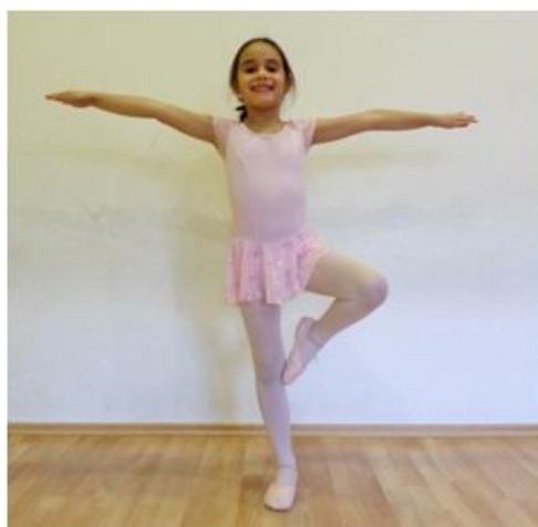
Slika 22. Otvorena passe ravnoteža na punom stopalu