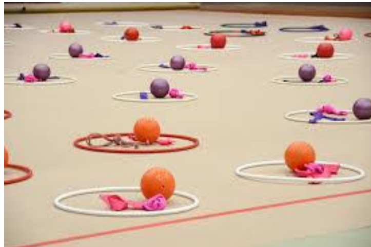
Slika 11. Vijača, obruč i lopta

Međutim, s obzirom na stupanj razvoja, prilikom poučavanja djece predškolske dobi u ritmičkoj gimnastici koristimo sljedeće sprave: vijaču, obruč i loptu. (Slika 11.)