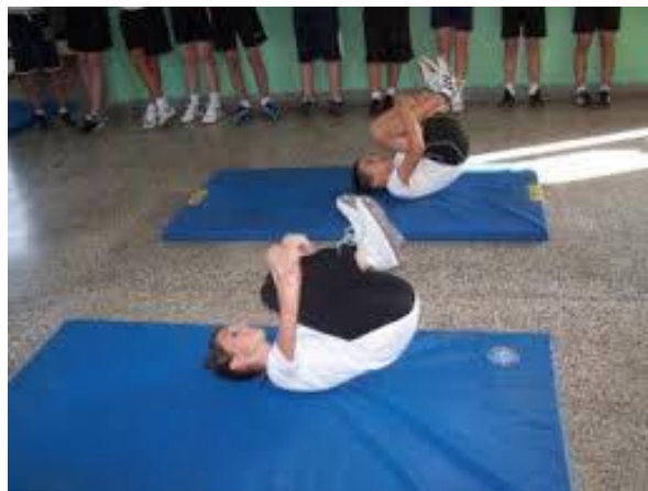
Slika 30. Povaljke na leđima s grčnim nogama