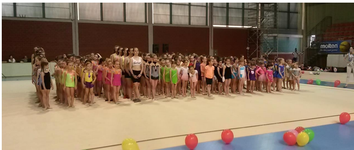
Slika 10. KRG Leda – Završna priredba 2015.

Postoje mnogi društveni čimbenici koji su važni za odluku pojedinca (u ovom slučaju roditelja/skrbnika) o sudjelovanju djeteta u određenom sportskom programu, to su: mediji, okruženje, objekti u kojima se provode treninzi, društvena klasa, zdravlje i sl.