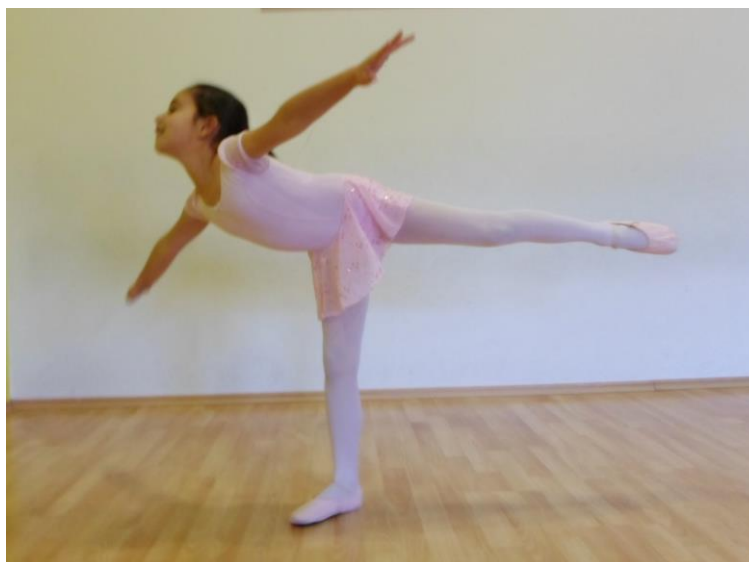
Slika 24. Prednja vaga