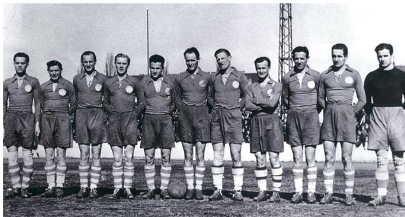
Slika 3. Prva nogometna ekipa

Na slici 3. se može vidjeti prva nogometna ekipa Dinama , današnji GNK Dinamo Zagreb.