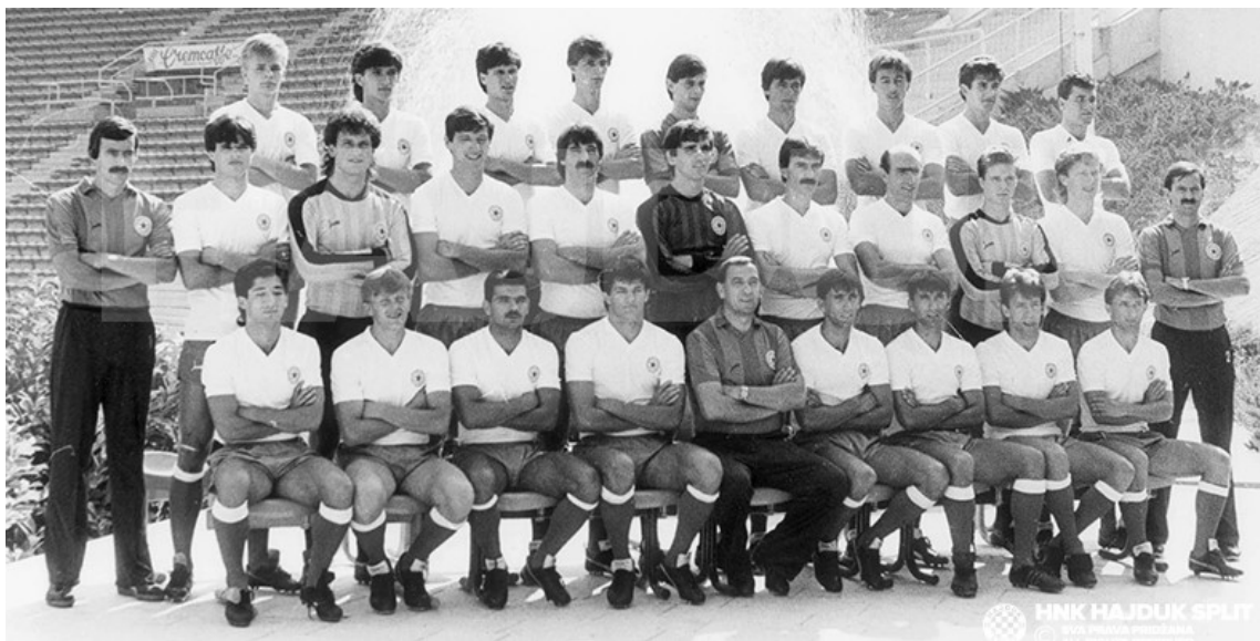
Slika 7. Hajdukova ekipa iz 1985. godine, https://hajduk.hr/eng/history/1981-1990