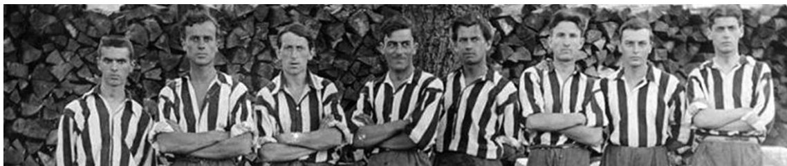
Slika 5. Prva momčad Hajduka, https://hajduk.hr/povijest/1911-1920

Hajduk je osnovan 13. veljače 1911. godine, a odobrio ga Carski namještenik. Osnivanje kluba bila je inicijativa četvorice Splićana. Na slici 4. je prikazana prva momčad Hajduka.