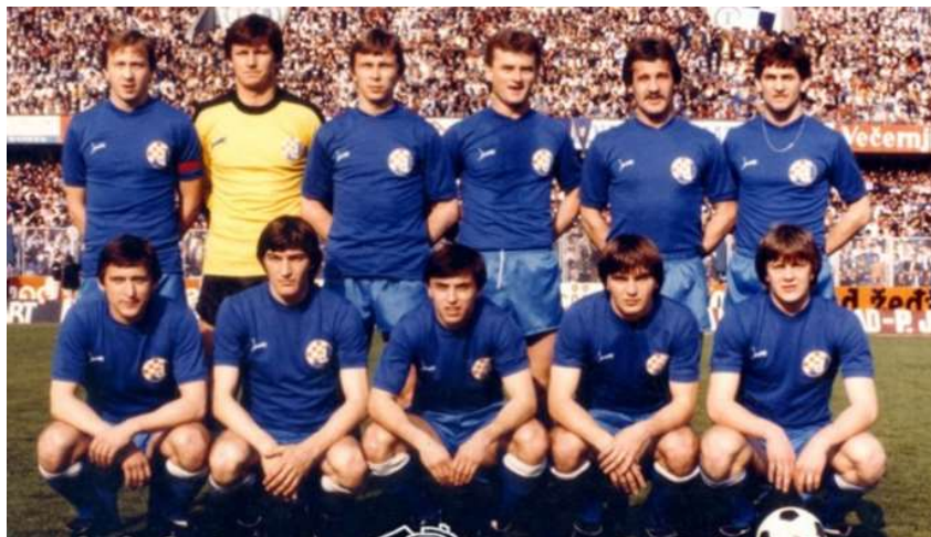
Slika 6. Dinamova zlatna momčad

Dinamova generacija koja je 1982. godine uzela naslov prvaka nazivaju zlatnom generacijom, slika 6.