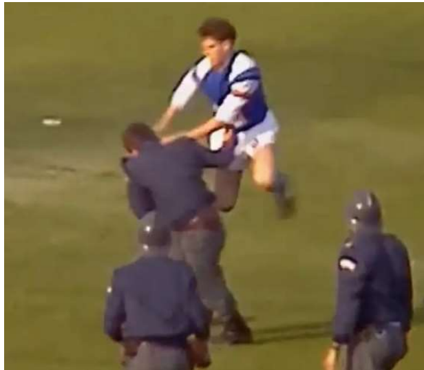
Slika 11. Boban u obrani svojih navijača protiv milicije

Utakmica koja se trebala odigrati 13.05.1990. godine bila je između Dinama i Crvene zvezde na Maksimiru. Umjesto utakmice na terenu su se navijači međusobno sukobili, a na kraju se umiješala i milicija. U obranu svojih navijača je stao i kapetan Zvonimir Boban koji se sukobio s milicijom, slika 11.