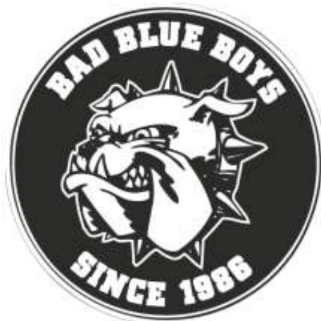
Slika 8. Maskota Bad Blue Boys – a, https://www.badblueboys.hr/bad-blue-bad-blue-boys/

BBB je ime za navijačku skupinu koja navija za zagrebački Dinamo. Osnovali su ih najvjerniji navijači Dinama i to po uzoru na slične skupine koje su postojale u inozemstvu. Ideju za naziv skupine su dobili po filmu „Bad Boys“ koji je bio poznat u to vrijeme. BBB-i su imali svoje podružnice i na utakmicama se pojavljuju razni transparenti poput BBB Maksimir, BBB Travno, BBB Dugave i sl. Njihova maskota je buldog, slika 8., a osnovani su 17. ožujka 1986. godine (Bad Blue Boys - https://www.badblueboys.hr/bad-blue-bad-blue-boys/ ).