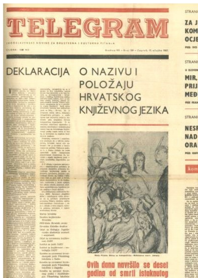
Slika 2. Časopis Telegram u kojemu je izašla Deklaracija o nazivu i položaju hrvatskog književnog jezika, https://www.matica.hr/kolo/314/deklaracija-o-nazivu-i-polozaju-hrvatskog-knjizevnog-jezika-20681/

dosljedno poštuju stigli iz Slovenije, i to u studenom 1966. godine. Ta je republika zahtijevala da savezna uprava dosljedno poštuje sve jezike naroda i oba pisma. Tome se pridružili i Makedonci. S obzirom na to daje najveće nezadovoljstvo sa stanjem jezika u saveznim institucijama bilo u Hrvatskoj, počeli su dogovori među hrvatskim jezikoslovcima, književnicima i intelektualcima uopće, da javno reagiraju. 17. ožujka 1967. godine u časopisu Telegram izašla je „Deklaracija o nazivu i položaju hrvatskog književnog jezika“, vidi sliku 2. (Radelić, 2006).