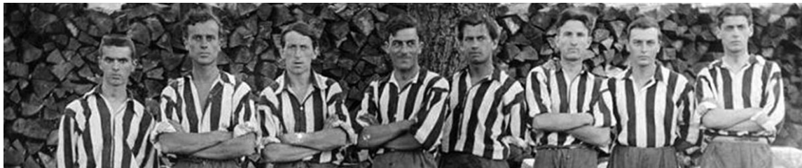
Slika 5. Prva momčad Hajduka, https://hajduk.hr/povijest/1911-1920

Hajduk je osnovan 13. veljače 1911. godine, a odobrio ga Carski namještenik. Osnivanje kluba bila je inicijativa četvorice Splitsana. Na slici 4. je prikazana prva momčad Hajduka.