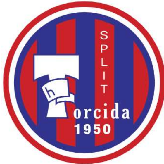
Slika 9. Logo Torcide, https://worldvectorlogo.com/logo/torcida-split

Torcida je osnovana nakon održanog Svjetskog prvenstva u Brazilu 1950. godine se među skupinom navijača pojavila ideja da osnuju navijačku skupinu koja bi se zvala Torcida. Torcidin logo se može vidjeti na slici ispod teksta.