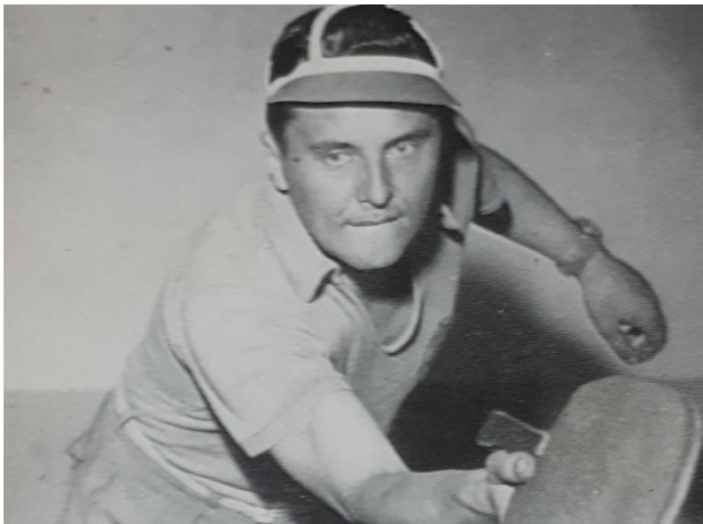
Slika 3. Žarko Dolinar

„Veliki uspjeh Žarka Dolinara koji je s V. Harangozom 1954. postao svjetski prvak u igri muških parova još je više potaknuo razvoj stolnog tenisa u brojnim hrvatskim centrima. Iste godine u Hrvatskoj registrirano 75 klubova s 1875 igrača i igračica“ (HSTS, 2010).