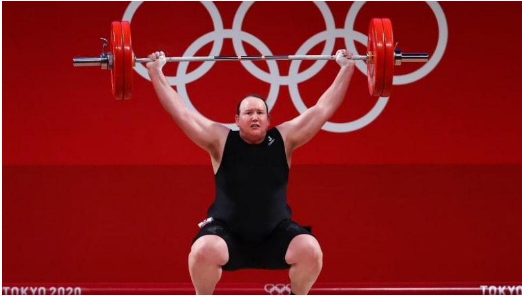
Slika 6. Laurel Hubbard na Olimpijskim igrama u Tokyu 2020. godine

( https://www.eurosport.com/weightlifting/tokyo-2020/2021/when-is-laurel-hubbard-weightlifting-why-is-there-controversy-around-transgender-athlete-and-what-ar_sto8466092/story.shtml )