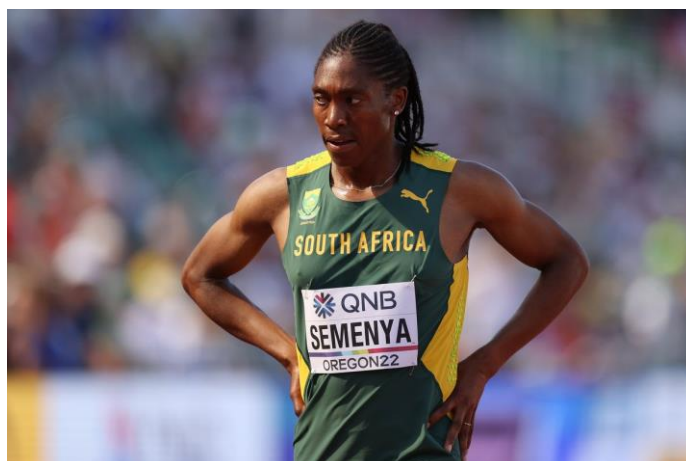
Slika 3. Južnoafrička atletičarka Caster Semenya

( https://www.runnersworld.com/news/a44507052/caster-semenya-wins-appeal-over-testosterone-rules/ )