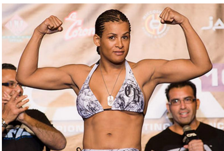
Slika 4. Bivši američki MMA borac Fallon Fox

Iz novijeg perioda će se također spomenuti ime Fallona Foxa, transrodnog MMA borca (Slika 4.). Potrebnu operaciju izveo je 2006. godina kada je bio 30 godina star. Povukao se iz sporta, u ulozu natjecatelja, nakon kontroverzne borbe 2014. godine protiv Tamikker Brents. Glavni razlog je bio to što nije mogla podnijeti negativnosti okruženja za vrijeme njezinog pojavljivanja u MMA-u (Harper, 2020).