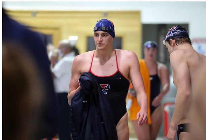
Slika 5. Američka plivačica Lia Thomas

Lia Thomas je plivačica koja se sve do 2020. godine predstavljala kao muškarac, a sada se smatra transrodnom sportašicom (Slika 5.). Thomas, koja je rođena kao muškarac, izazvao je globalnu kontroverzu kada se pridružila ženskom plivačkom timu. Njezino pravo da se natječe u ženskim utrkama, a ponekad i sam njezin spol, napadnute su od strane sportskih zvijezda, političara, aktivista, njezinih natjecatelja, pa čak i roditelja nekih njezinih suigrača (Independent Digital News and Media, 2022).