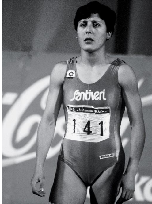
Slika 8. Španjolska atletičarka María José Martínez-Patiño

( https://colinmnash.medium.com/why-question-female-athletes-sex-a61aa5a9d1d8 )