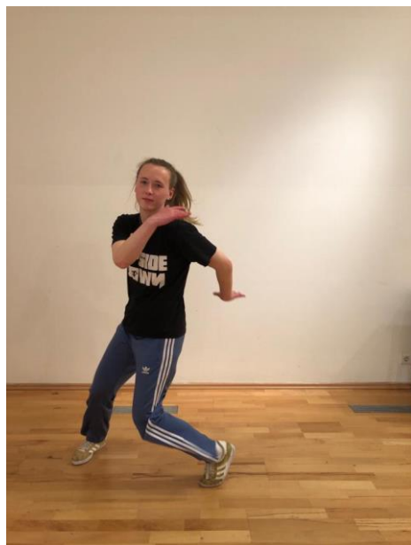
Slika 3. „ Salsa rock “