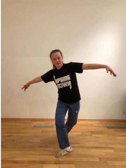
Slika 1. „ Indian step “

U Toprock ubrajaju se elementi koji se izvode u stojećem položaju i najčešće služe kao uvod u izlaz. Većina tih elemenata potječe iz rockinga ili uprockinga , a izvorno su bili zamišljeni kao signal drugim natjecateljima da se maknu s plesišta.