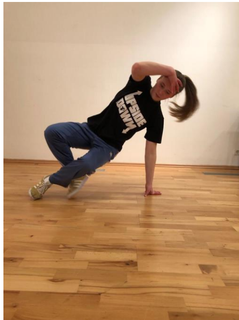
Slika 5. „Six step“