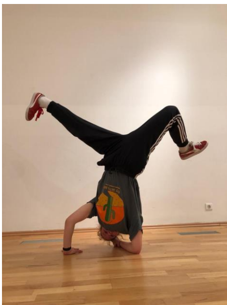
Slika 11. „Chairfreeze“