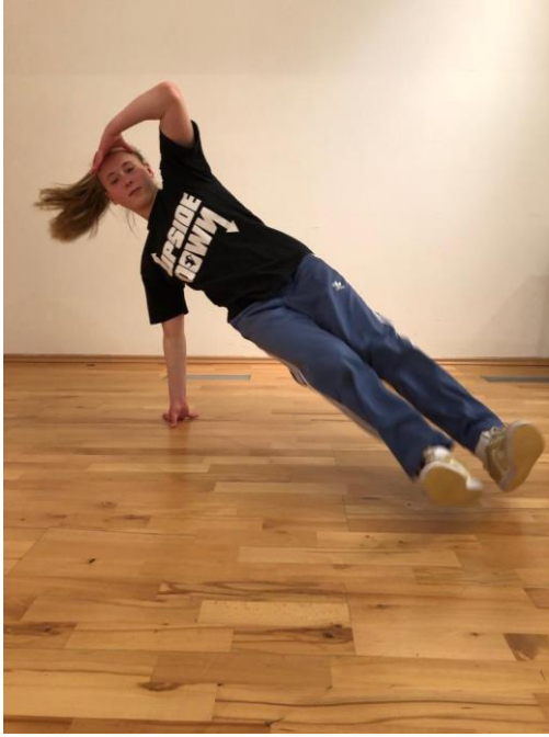
Slika 6. „Kickouts“.