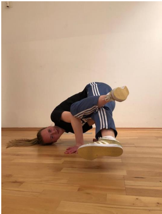
Slika 9. „Babyfreeze“.

Freezes čine elementi prilikom kojeg plesač u potpunosti zaustavlja svoje kretanje, zauzima pozu te ju zadržava u periodu od 3-5 sekundi. Spoj su jakosti, fleksibilnosti i ravnoteže. Ovu grupaciju pokreta najteže je izvesti nakon Power Moves ili Air Moves-a , a najčešće se koriste na kraju izlaza ili u kombinaciji sa Footworkom (Hrvatski sportski plesni savez, 2023).