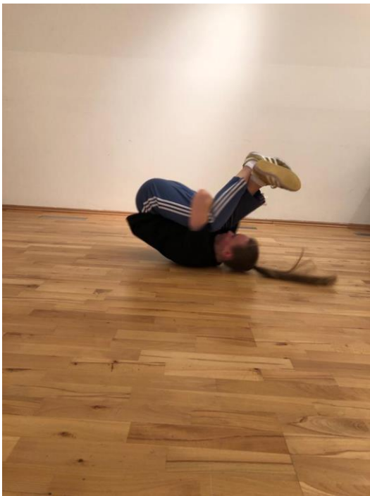
Slika 8. „Backspin“