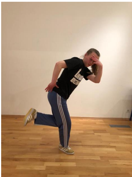
Slika 2. „ Cross over “