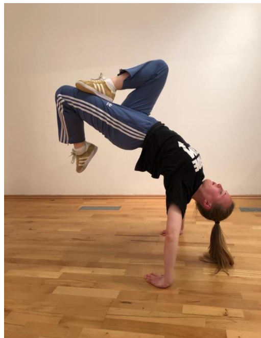
Slika 10. „Scorpion“