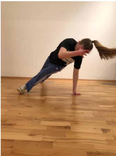
Slika 4. „Side shuffle“

Prva potkategorija Downrock elemenata naziva se Drops , označava pokrete koji čine prijelaz iz Toprocka u Downrock . Sljedeća potkategorija je Footwork/Legwork čije elemente čine svi pokreti donjih ekstremiteta izvedeni na tlu (npr. koraci, zamasi, kickovi ). Spins su pokreti koji se sastoje od okreta oko longitudinalne osi od minimalno 360 stupnjeva. Jedna od najbitnijih potkategorija su Power moves , koji čine elemente kružnog tipa prilikom kojega se povećava centrifugalna sila; Ovi pokreti mogu se izvoditi na leđima ili preko leđa, te na rukama. Iznimno su složeni za izvedbu te iziskuju visoku razinu tehničke izvedbe pokreta, brzinu i dinamiku istoga, te jakost i snagu segmenata lokomotornog sustava zaduženog za izvedbu samih pokreta. Sljedeće dvije potkategorije su Blow Ups i Air Moves koje karakterizira vrlo eksplozivne i brze kretnje: Blow Ups elementi čine faktor iznenađenja, te mogu biti izvedeni na tlu ili u zraku, dok su Air Moves pokreti u kojima plesač ne dodiruje tlo. To mogu biti premeti, salta, itd. Zadnja potkategorija su Tranzicije koje označavaju spojnicu između pokreta. Tranzicije zavise o individui, mogu biti upečatljivi ili ne. Tranzicijama se povezuju pokreti iz navedene tri kategorije Toprock , Downrock i Freezevi (Hrvatski sportski plesni savez, 2023).