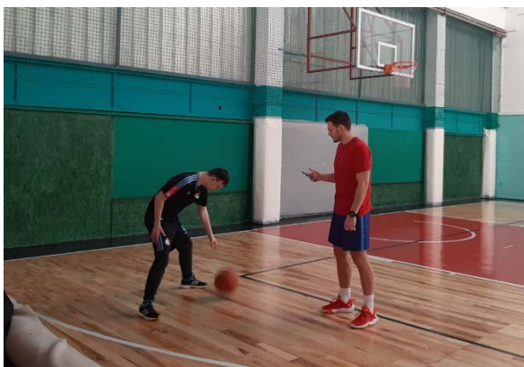
Slika 3. Izvođenje testa vođenje lopte u minuti