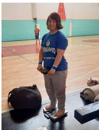
Slika 5. Mjerenje postotka tjelesna mase i indeksa tjelesne mase pomoću Tanita BC-545N mjernog uređaja (vlasništvo autora)