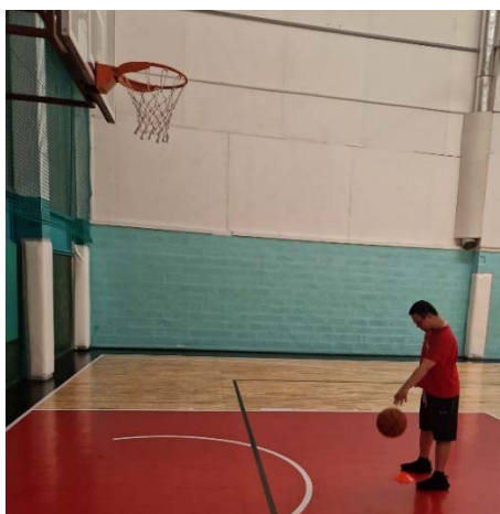
Slika 4. Izvođenje testa šut na koš s tri metra udaljenosti.