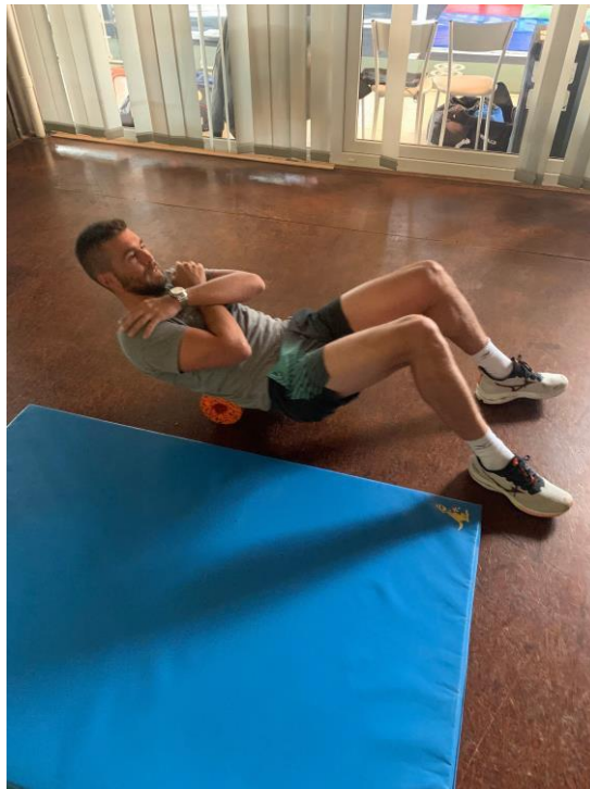
Slika 7. Inhibicija rolerom (priprema za trening)

U ovom dijelu prikazat ćemo primjer treninga jakosti i snage, u prevenciji od ponavljanja ozljede, u trenažnom tjednu između turnirskih natjecanja.