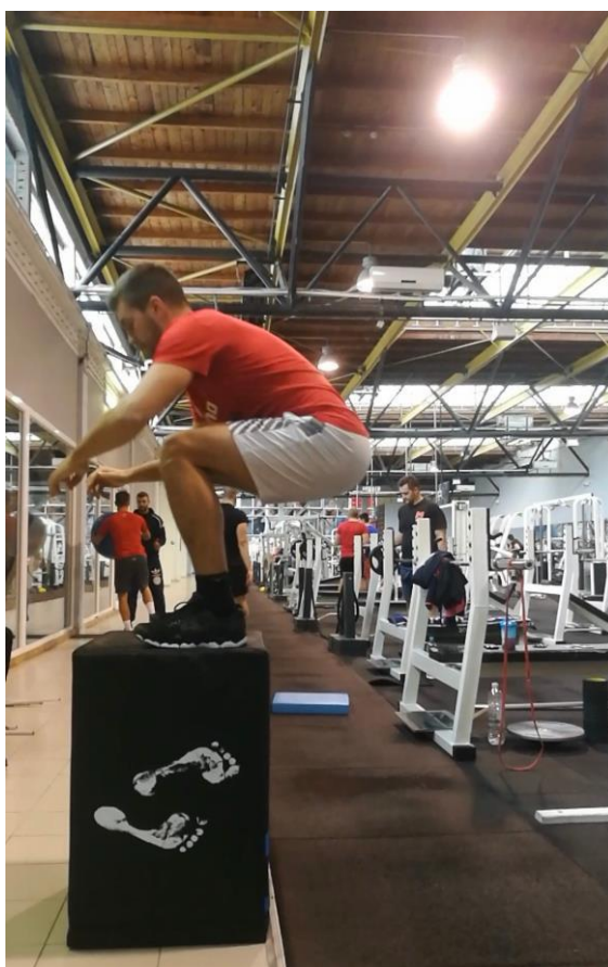
Slika 11. Naskok na sanduk

Krećemo sa skokovima iz stopala koji se izvode u dvije serije od kojih svaka ima 2 x 6 skokova. Znači, tenisač izvede 24 skoka iz stopala. Slijede naskoci na sanduk koji je visok 70 do 90 cm i na taj način podižemo intenzitet od prve do treće serije s po 6 skokova u svakoj seriji (Slika 11.). Tenisač izvede 18 naskoka na sanduk. Slijede povezani kangaroo skokovi kroz prepone koji se izvode također u dvije serije od kojih svaka ima 2 x 6 skokova. Tenisač izvede 24 skoka preko prepona. Ukupno u prvom dijelu treninga tenisač izvede 66 skokova.