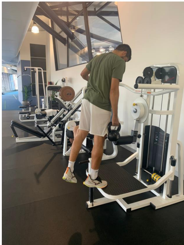
Slika 6. Jednonožno podizanje na prste s girijom