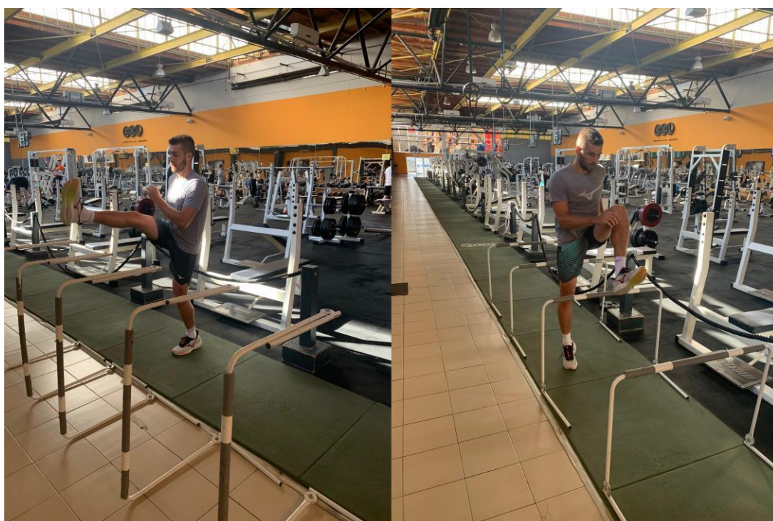
Slika 10. Metodika na atletskim preponama

Trening počinje zagrijavanjem organizma trčanjem 10 minuta, kontinuiranim standardnim tempom, brzinom 10 km/h na pokretnoj traci. U uvodnom dijelu odrađuju se još tretman rolerom i vježbe dinamičke fleksibilnosti.