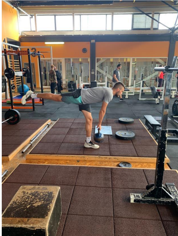
Slika 5. Jednonožno mrtvo dizanje na opruženu nogu (vage) s girijom