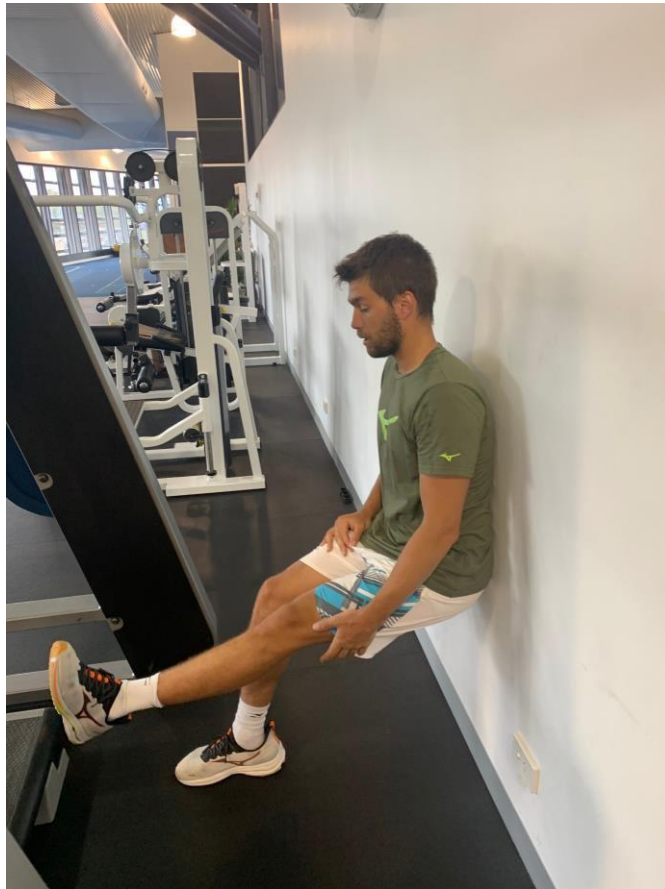
Slika 3. Jednonožni izdržaj u sjedu uza zid

Nakon zagrijavanja, inhibicije rolerom i općepripremnih vježbi razgibavanja krećemo na glavni dio treninga. Naravno, u tom dijelu prilikom izvođenja vježbi cilj nam je da tijekom izvođenja vježbe tenisač ne osjeti bol ili da ta bol ne bude veća od 3 na skali od 1 do 10. Tako prilikom izvođenja ekscentričnog jednonožnog čučnja (Slika 4.) na zahvaćenoj nozi razina boli nam diktira do kojeg kuta spuštanja izvodimo pokret. Kada bi imali slučaj da je bol prevelika, zamijenili bismo vježbu izometrijskom vježbom za jačanje mišića kvadricepsa.