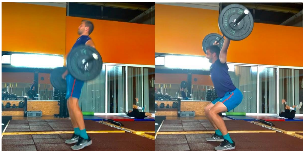
Slika 12. Trzaj (tehnika olimpijskog dizanja utega)

U glavnom B-dijelu treninga krećemo s drugim dijelom eksplozivnih radnji. Zagrijavanje za vježbu olimpijskog dizanja utega (trzaj) provodimo na način da tenisač izvede po 3 do 4 ponavljanja vježbi prednjeg čučnja, dead lift , veslanje u pretklonu i visoko vučenje s olimpijskom šipkom (20 kg) kako bi se dodatno pripremio za obrazac kretanja koji slijedi. Trzaj izvodimo u 5 serija s time da je prva serija s 20 kg još uvijek zagrijavajuća. Tenisač tako izvede 4 radne serije s malim brojem ponavljanja (Slika 12.).