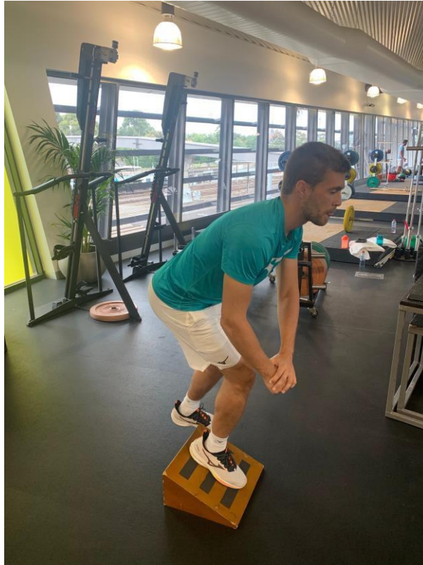
Slika 4. Jednonožni ekscentrični čučanj na kosoj podlozi

Kod izvođenja vježbe jednonožnog mrtvog dizanja na opruženu nogu (Slika 5.) nema savijanja koljenskog zgloba tako da se ova vježba izvodi bez boli. Također vježbe podizanja na prste koje uključuju mišiće lista ( m. soleus i m. gastrocnemius ) (Slika 6.) i vježbe na trenažeru koje rade pokrete abdukcije i adukcije u zglobu kuka ne izazivaju bolove u koljenu.