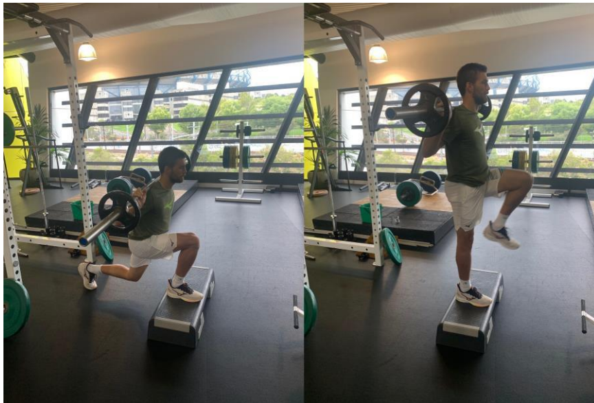
Slika 9. Varijanta bugarskog čučnja s prednjom nogom na steperu