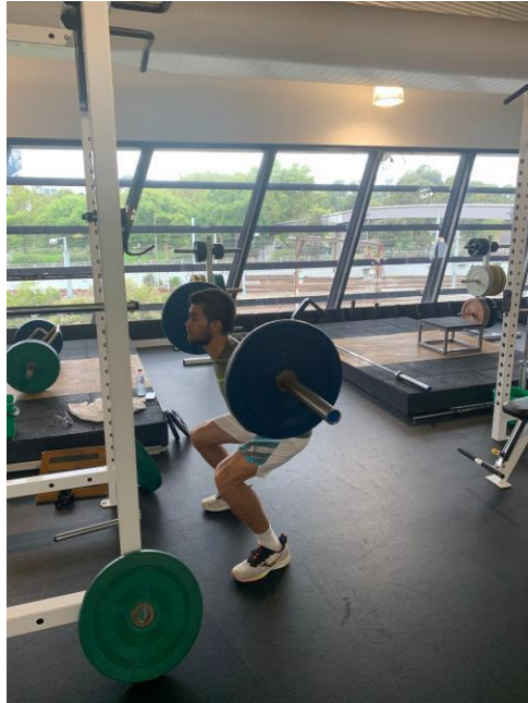
Slika 8. Stražnji čučanj