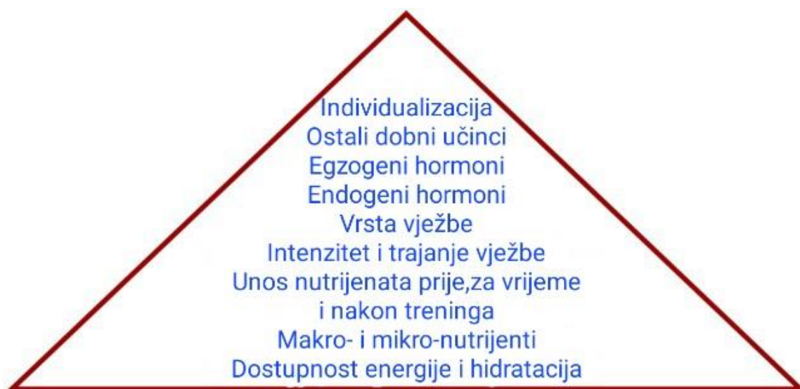
Slika 2. Potencijalna hijerarhija prehrambenih mogućnosti i potreba za sportašice. Prilikom izrade prehrambenih planova, sportaši bi trebali osigurati da su sve niže komponente piramide