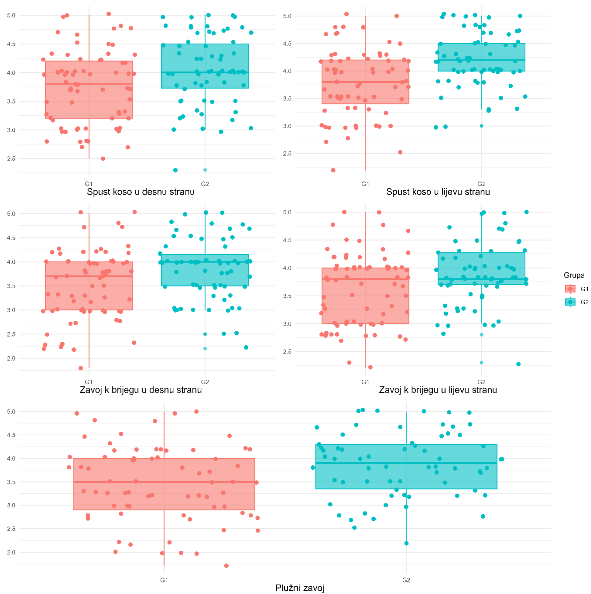
Slika 3. Distribucija ocjena ispitanika s obzirom na pripadnost grupi u varijablama u kojima je uočena statistički značajna razlika