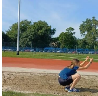
Slika 4. Doskok