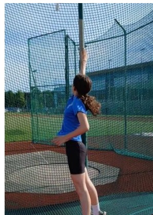
Slika 6. Mjerenje visine vertikalnog skoka