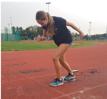
Slika 1. Početna pozicija u testu trčanje na 20m

Test se provodio u tenisicama i svi ispitanici imali su pravo na jedan pokušaj.