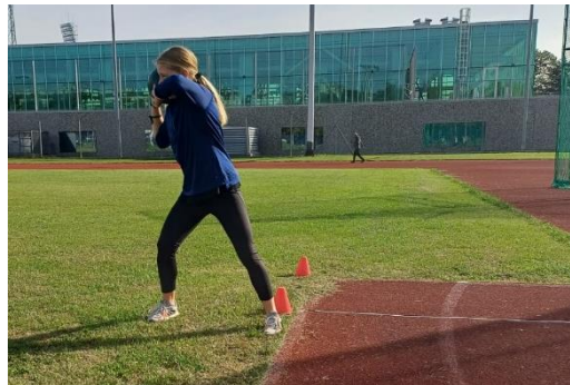
Slika 7. Početna pozicija u testu jednoručnog bacanje medicinke 2kg s mjesta

Svaki ispitanik imao je pravo na dva pokušaja.