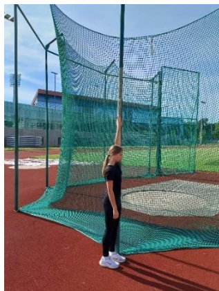
Slika 5. Mjerenje stajaće visine vertikalnog skoka

Stajaća visina oduzeta je od visine koju je ispitanik dosegao skokom te je rezultat prikazan kao visina vertikalnog skoka.