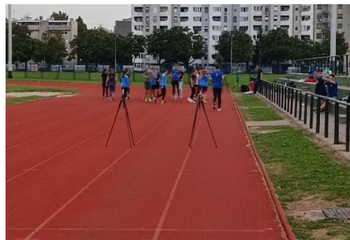
Slika 2. Fotostanica za mjerenje brzine