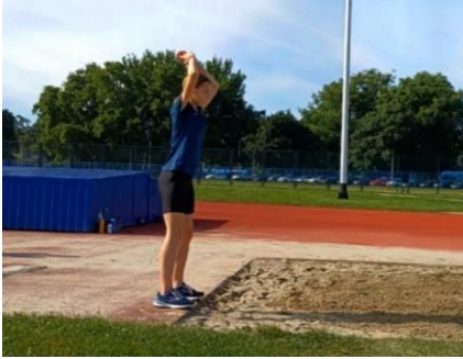
Slika 3. Početna pozicija skoka u dalj s mjesta

Svaki ispitanik imao je pravo na 2 pokušaja.