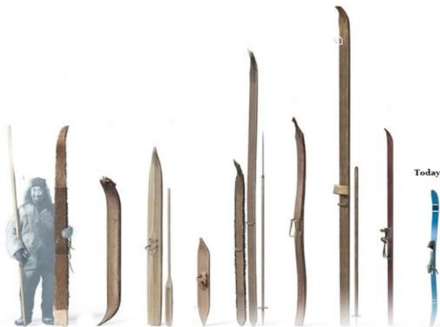
Slika 2. Povijesni prikaz razvoja skija („History of ski equipment“)

Skije su od samih početaka imale prednji kraj savijen prema gore (ovakav oblik ostao je sve do danas), a donja strana skije, ona koja kliže po podlozi, bila je presvučena životinjskom kožom s ciljem boljeg klizanja skije po snijegu (preteča današnjega voska za kliznu podlogu) (Dawson, 1997).