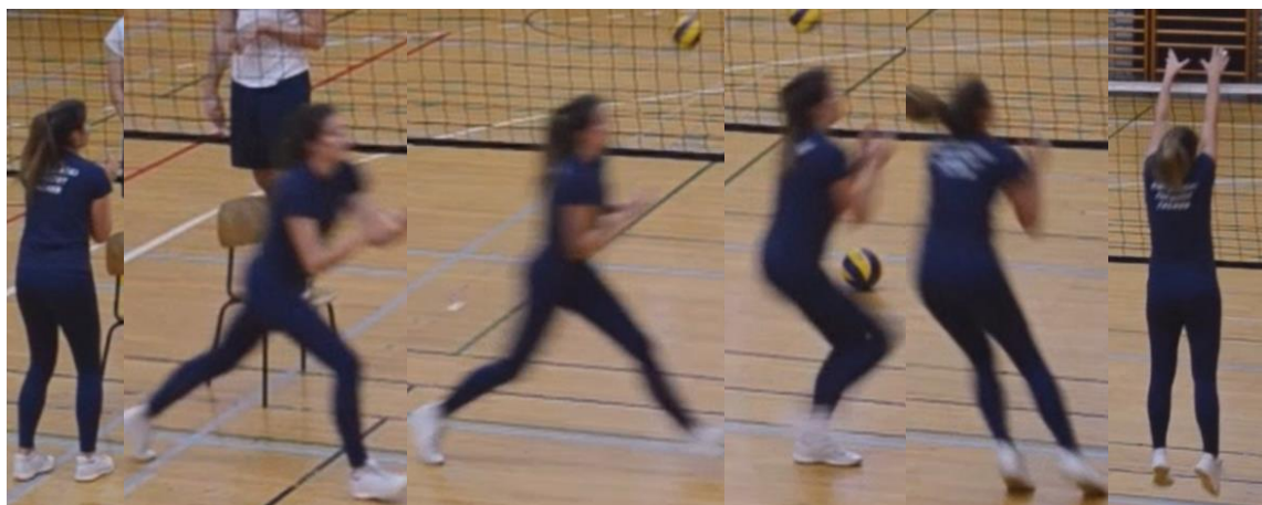
Slika 6. Kombinirana tehnika kretanja u pripremnoj fazi bloka u desnu stranu

Osnovna faza: u ovoj fazi dolazi do kontakta između lopte i dlanova igrača. Tijelo i ruke igrača su maksimalno zategnuti, dlanovi i prsti su okrenuti prema sredini terena, kako bi se postigao poen blok, a izbjegnulo da lopta nakon dodira ruku ode u aut. U ovoj fazi razlikujemo aktivni ili pasivni blok što ovisi isključivo o položaju dlanova.