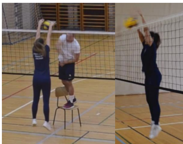
Slika 7. Osnovna faza bloka

Osnovna faza: u ovoj fazi dolazi do kontakta između lopte i dlanova igrača. Tijelo i ruke igrača su maksimalno zategnuti, dlanovi i prsti su okrenuti prema sredini terena, kako bi se postigao poen blok, a izbjegnulo da lopta nakon dodira ruku ode u aut. U ovoj fazi razlikujemo aktivni ili pasivni blok što ovisi isključivo o položaju dlanova.