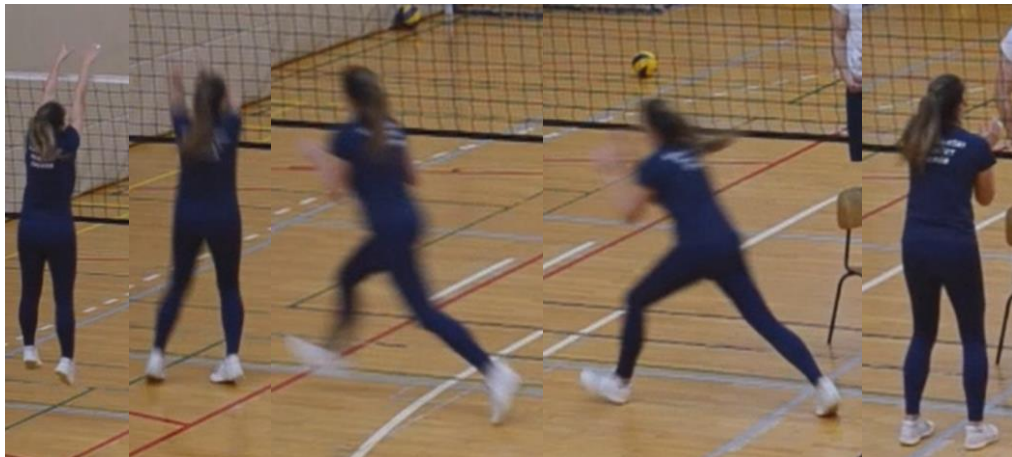
Slika 4. Križna tehnika kretanja u pripreмноj fazi bloka u lijevu stranu

Križna tehnika – kao i u dokoračnoj tehnici ukoliko je potrebno kretanje u lijevo započinje se lijevom nogom, a ako je kretanje u desno započinje se desnom nogom. Nakon odabira strane igrač otvara kukove u stranu u koju ide radi veliki iskorak nogom stopalom okrenutim u smjeru kretanja, drugom nogom izvodi dugački prekorak te se stopalo postavlja okrenuto prema mreži okomito na smjer kretanja kako bi se započelo sa zatvaranjem kukova. Zatim se priključuje druga noga, zatvaraju se kukovi te igrač licem i tijelom okrenutim prema mreži na odabranom mjestu skače u blok i doskače na isto mjesto bez pomaka u stranu.