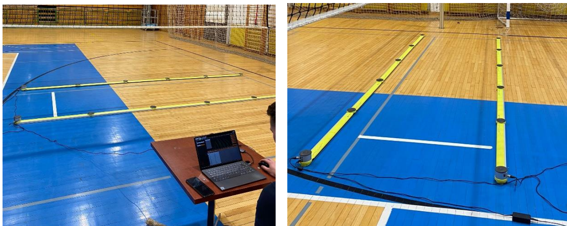
Slika 9. – Opto Jump

Opto Jump je optički mjerni sustav kojeg čine dva panela, prijemni i odašiljački, na kojima se nalaze ćelije. Paneli se moraju nalaziti točno jedan nasuprot drugog kako bi ćelije koje se povezuju infracrvenim zrakama bile paralelne, te kako bi sustav mogao pravilno očitavati prekide između ćelija i tako slao signale i očitavao kretanje između panela. Paneli se međusobno povezuju i produžuje te je moguće mjeriti kretanja na dužinama i do 100 m. za potrebne ovog istraživanja korišten je sustav u dužini od 5 metara. Sustav je povezan s računalnom aplikacijom te je na sustav povezana i kamera te se sva mjerenja i snimaju kako bi se tehnika mogla analizirati.