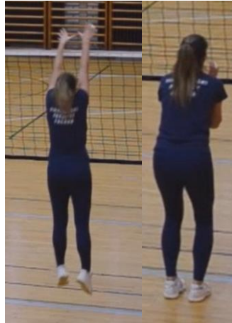
Slika 8. Završna faza bloka