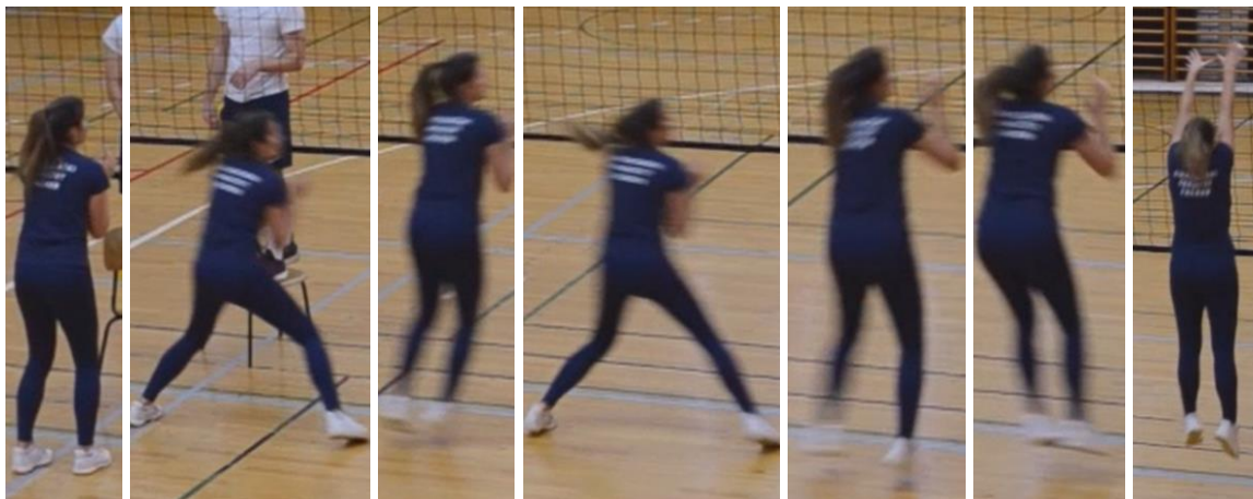
Slika 3. Dokoračna tehnika kretanja u pripremnoj fazi bloka u desnu stranu

Dokoračna tehnika – za premještanje u lijevu stranu kretanje se započinje s lijevom nogom, a za premještanje u desnu stranu kretanje se započinje desnom nogom. Izvodi se veliki iskorak u stranu te se drugom nogom dokoračno priključuje, zatim se ponavlja još jednom isti iskorak i dokorak te nakon toga igrač izvodi bočni sunožni naskok s obje noge zajedno i odraz u blok na način da se pružaju noge i zatim i ruke koje se pružaju u vis i naprijed istovremeno.