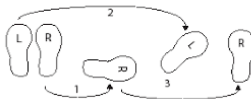
Slika 5. Ilustracija kretanja stopala u križnoj tehnici

Kombinirana tehnika – u nazivu ove tehnike se već da naslutiti da je riječ zapravo kombinaciji dvije tehnike i to upravo gore navedene križne i dokoračne. Igrač izvodi početne korake kao i u križnoj tehnici: otvaranje kukova iskorak u stranu, prekorak drugom nogom te nakon toga umjesto priključivanja noge radi sunožni bočni naskok koji je isti kao i u završnom dijelu dokoračne tehnike te iz te pozicije skače u blok.