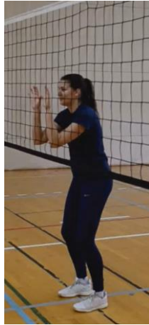
Slika 2. Početna faza bloka

Pripremna faza: igrač postavlja svoje tijelo u projekciju zaleta protivničkog smečera. Ukoliko to nije ispred njega, nego se treba premjestiti na drugi dio mreže, odabire jednu od tehnika kretanja.