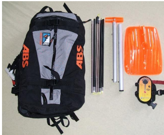
Slika 1. Oprema za spašavanje iz lavina

Kombinacija lavinskih prijemnika i sondiranja omogućuje brzu i efikasnu pretragu velikih područja. Prijemnicima se okvirno odredi područje u kojem se nalazi osoba dok se sondiranjem precizno definira lokacija osobe. Važno je da se sve osobe koje se kreću u lavinskim područjima budu obučene za korištenje opreme kako bi se iskoristio pun potencijal alata i što prije pronašle žrtve.