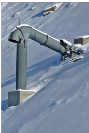
Slika 2. Gazex sistem za kontrolirano izazivanje lavina