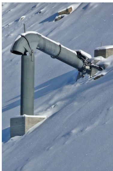
Slika 2. Gazex sistem za kontrolirano izazivanje lavina