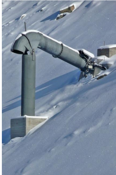
Slika 2. Gazex sistem za kontrolirano izazivanje lavina