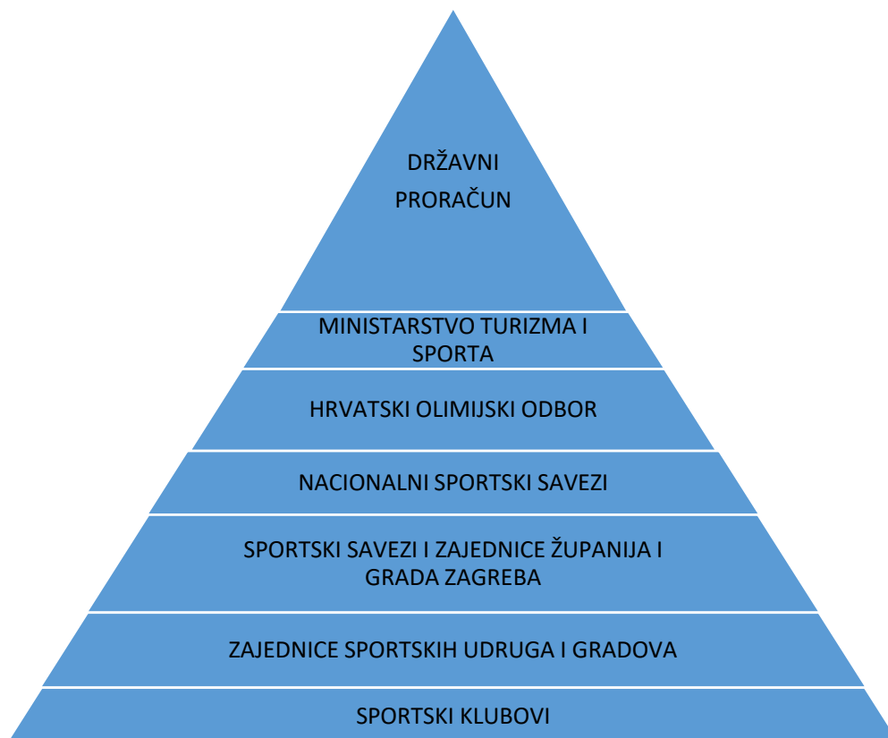
Tablica 14. Organigram financiranja sporta u Republici Hrvatskoj

HAOK Mladost je prateći svoju strategiju uspio izvući klub iz dubioza međutim za sljedeći iskorak neophodna je promjena u samom sustavu sporta. Prije svega u financiranju sporta s naglaskom na financiranje klubova koji su izravni proizvođači vrhunskih sportaša.