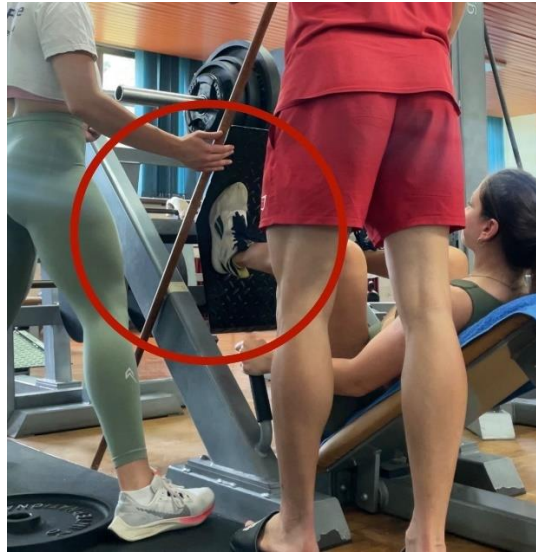
Slika 4. Konačna amplituda pokreta

Slika 3. Dubina spuštanja kao udaljenost od drške sprave do gornjeg ruba ljepljive trake