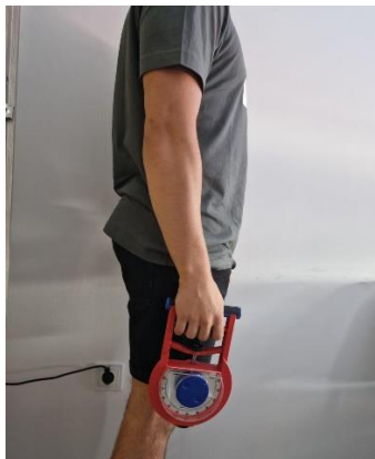
Slika 3. Pozicija ispitanika prilikom mjerenja s Takei dinamometrom

Djeca su bila testirana dvama mjernim instrumentima za procjenu snage stiska šake jedanput sa dominantnom i jedanput sa nedominantnom rukom. Prije samog testiranja snage stiskom šake, prikupili su se demografski podaci o svakom ispitaniku pomoću upitnika: dob, spol, da li se bavi sportom (da/ne), sportski staž, vrsta sporta i broj treninga tjedno. Prije svakog testiranja ispitanicima je demonstriran i usmeno objašnjen test. Svakom ispitaniku je prilagođena veličina dinamometra ako je bila potrebna. Nakon toga ispitanik je proveo test samostalno uz nadzor mjerioca. Svaki ispitanik radi testiranje Takei dinamometrom, prvo desnom rukom pa lijevom rukom. Nakon 3 minute pauze pristupa mjerenju stiska šakom na Jamar dinamometru. Također prvo radi testiranje desnom rukom, a zatim lijevom rukom. Protokol mjerenja Takei dinamometra (Slika 3.) izgledao tako da se ispitanik nalazio u stojećoj poziciji sa rukama spuštenim uz tijelo. U jednoj ruci se nalazio Takei dinamometar. Mjerna skala je bila okrenuta prema van (prema mjeriocu koji očitava rezultat). Tijekom mjerenja ispitanik ne smije pomicati tijelo u svrhu generiranja veće sile. Rezultat se prikazuje u kilogramima.