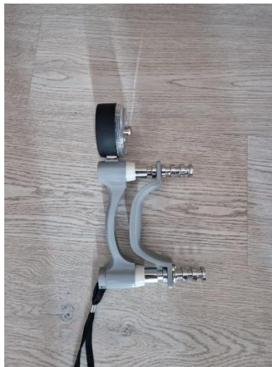
Slika 1. Jamar dinamometar

predviđanje klasifikacije sportaša. Rezultati ovog istraživanja mogu pomoći stručnjacima za snagu u radu sa sportašima ili pri regrutiranju sportašica u pogledu razvoja i korisnosti snage stiska šake. Vrijednosti snage stiska šake među sportašima razlikuju se ovisno o sportu, spolu, tjelesnoj težini, razini sportaša, dobi i vrsti treninga. Snaga stiska šake trebala bi biti uključena u bateriji testova za prepoznavanje potencijalnih sportskih talenata, posebno u disciplinama poput juda, hrvanja, boksa, mačevanja, jedrenja, veslanja, dizanja utega i tenisa (de Andrade Fernandes i Bouzas Marins, 2011). Postoji mnogo instrumenata za mjerenje snage stiska šake. Hidraulični ručni dinamometar Jamar trenutno je zlatni standard (Conforto i suradnici, 2019). Jamar dinamometar prepoznat je kao standardni instrument za mjerenje snage stiska šake s visokim razinama valjanosti, pouzdanosti i preciznosti.