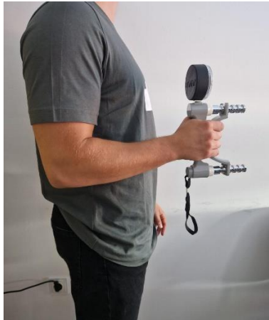
Slika 4. Pozicija ispitanika prilikom mjerenja s Jamar dinamometrom