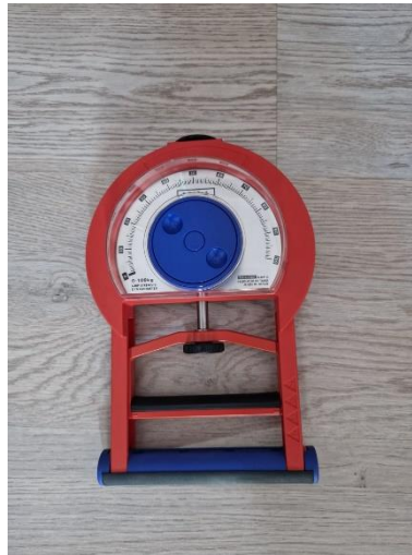
Slika 2. Takei dinamometar

može smatrati kao valjan i pouzdan mjerni instrument za mjerenje snage stiska šake. Sadrži podesivu ručku pravokutnog i udobnog oblika, elektromehanički sustav i digitalni ili analogni zaslon (Gatt i suradnici 2018).