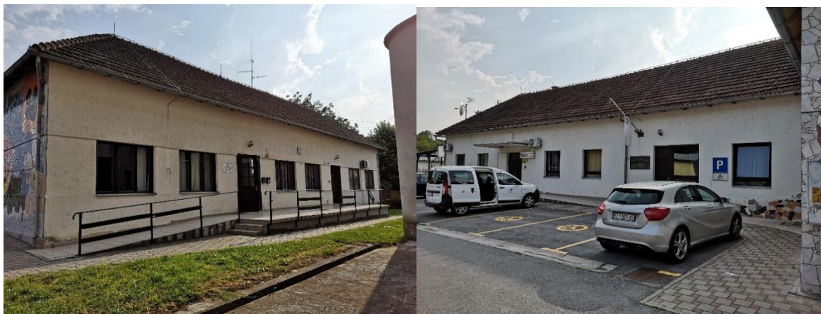
Slika 4. i Slika 5. Zgrada streljačkog kluba u Slatini „Centar“

Najaktivnija i najuspješnija družina bila je Streljačko društvo Četvrtog i Petog rajona, koje je 1970. godine preimenovano u Streljačko društvo „Borac“, a 1974. godine u Streljačko društvo „Centar“ (Slike 4 i 5).