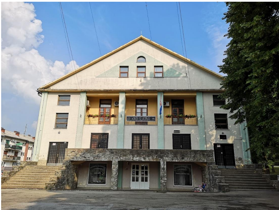
Slika 3. Zgrada u kojoj je osnovan prvi streljački klub u Slatini „Borac“

Streljački savez općine Podravska Slatina osnovan je 1963. godine, no njegovo djelovanje bilo je u početnim godinama ograničeno nedostatkom odgovarajuće infrastrukture. Ključan iskorak dogodio se 22. prosinca 1968. godine, kada je u podrumu kinodvorane otvorena prva zračna poluautomatska streljana s ukupno šest staza. Iste godine savez je proširio svoju djelatnost osnivanjem streljačkih družina u samoj Slatini i okolnim mjestima (Kraljik, 1999). Ukupno šesnaest družina okupilo je više od 700 strijelaca, čime je streljaštvo postalo značajna sportska aktivnost u regiji. Među klubovima koji su djelovali pod okriljem saveza bili su Borac (Slatina), Miholjac, 13. Maj (policija), OSNO (Općinski sekretarijat narodne obrane), Graditelj, Gaj, Sekulinci, Voćin, Croatia, Predrijevo, Zvonimirovac, Sopje, Jugobanka, te kasnije Centar. Ova raznolika mreža klubova svjedoči o snažnom interesu i širokoj uključenosti zajednice u razvoj streljaštva (Kraljik, 1999).