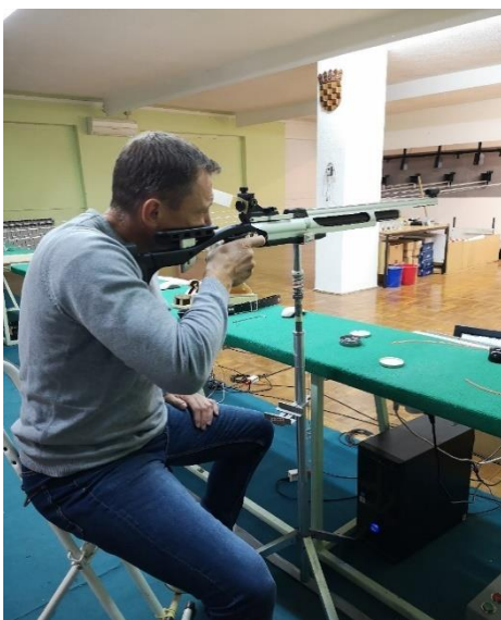
Slika 1. Primjer strijelca osobe s invaliditetom koji gađa uz pomoć posebnog stalka

Odjeća i oprema koju strijelci koriste uključuju streljačke kapute, hlače i cipele. Osobe s invaliditetom koriste i dodatna pomagala kao što su streljačke stolice, koje mogu uključivati kolica, stolice, sjedala i visoke stolice. Također, tu su i streljački stolovi, koji mogu biti pričvršćeni za streljačku stolicu ili samostalno stajati te stalci za potporu, koji mogu biti pričvršćeni za streljački stol ili stajati na tronošcu (Slike 1 i 2)