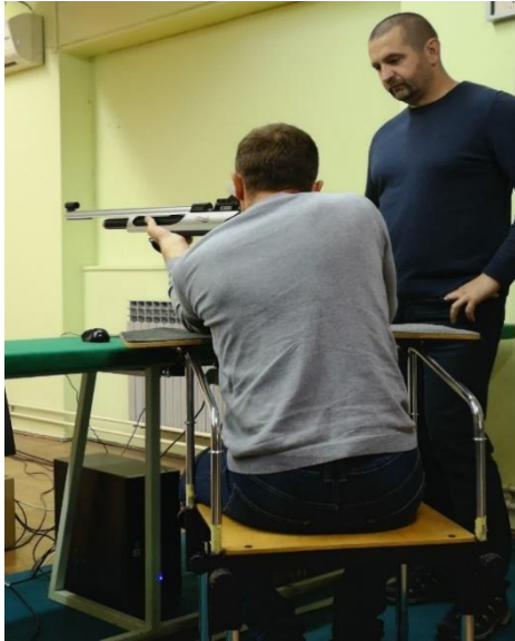
Slika 2. Primjer strijelca osobe s invaliditetom koji gađa uz pomoć posebne stolice i asistenta

Zbog svoje specifičnosti streljaštvo je sport pogodan za osobe s invaliditetom i gluhe osobe. Streljaštvo je jedan od rijetkih sportova gdje osobe s invaliditetom i gluhe osobe postižu rezultate vrlo blizu onim vrhunskim. Ovisno o klasifikaciji stupnja invaliditeta, osobe s invaliditetom koriste razna tehnička pomagala kao što su stalci, remeni, stolice i drugo kako bi nadomjestili svoj invaliditet u svrhu bavljenja streljaštvom. Takav vid sportske rekreacije omogućuje da se putem streljačkog sporta, kao jednog vida rehabilitacije, što brže uključe u svakodnevni život i rad.