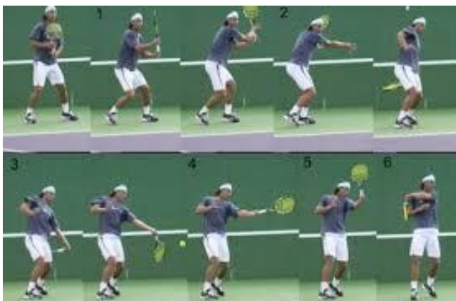
Slika 3. Forhend

Pokret za forhend počinje se iz osnovne pozicije. Iz tog položaja prelazimo u bočni položaj i krećemo u zamah. Reket odvajamo od lijeve ruke i u luku, od prilike visine ramena, reket vodimo unazad. Istovremeno, desno stopalo se okreće tako da bude paralelno sa mrežom, na