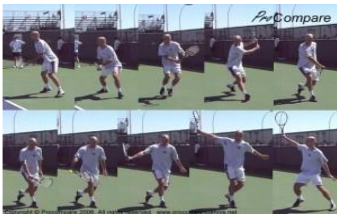
Slika 4. Jednoručni bekend.

Postoji jednoručni i dvoručni bekend. Kod jednoručnog bekenda, u fazi zamaha, reket s obje ruke dovodimo natrag iznad visine struka uz blago savijanje lakta, ali ne i ručnog zgloba. Pokret zamaha izvodi se tako da lijeva ruka drži vrat reketa i povlači ga unazad, što stabilizira pokret zamaha i omogućuje daljnji zasuk trupom. Iz osnovnog stava okrećemo tijelo na lijevu stranu, a istovremeno stopalo lijeve noge dovodimo u položaj paralelan s osnovnom linijom. U tom trenutku težinu tijela prebacujemo na lijevu nogu, a desno rame okrećemo prema mreži. Glava reketa spušta se pri prijelazu u fazu predmaha da bi se njome postigao što jači izmah. Radi postizanja što bolje ravnoteže, stopala moraju biti razmaknuta više od širine ramena. Da bi se postigao optimalan prijenos svih sila na loptu, lopta se udara postrance ispred tijela u visini kukova (u usporedbi sa forhendom još više naprijed), čvrstim ručnim zglobovima i okomitom udarnom površinom reketa. Pokret izmaha nastavlja se u smjeru udarca. Kod dvoručnog bekenda desnom se rukom reket drži za dno ručke, a lijeva ruka je iznad prstiju desne ruke. Zamah je isti kao kod jednoručnog bekenda, desno rame je usmjereno na loptu, a težina se prenosi s lijeve na desnu nogu. Predmah reketa započinje s nižeg položaja prema naprijed i prema gore. Sraz s loptom je u visini kuka, dosta ispred tijela, a težina je na desnoj nozi. Obje su ruke kod izmaha ispružene visoko udesno iznad glave.