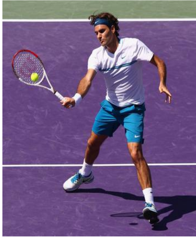
Slika 6. Roger Federer - bekend volej. Slika 7. Roger Federer - forhend volej.

Forhend-volej iz osnovnog stava, počinje sa pomicanjem reketa na gore, tako da je ruka savijena u laktu. Glava reketa se nalazi u visini desnog ramena. Desno stopalo i tijelo zakrećemo na desnu stranu, tako da su ramena postavljena dijagonalno. Kada nam lopta dolazi ususret, predmahom krećemo u njenom pravcu i kratkim brzim pokretom izvodimo udarac ispred tijela. U momentu udarca, ruku pružamo u pravcu lopte i istovremeno težinu tijela, koja je do tada više bila na desnoj nozi, prebacujemo na lijevu nogu. U trenutku udarca, zglob ruke je čvrst i u tom trenutku se glava reketa nalazi iznad šake. Lopta se udara otvorenim reketom odozgo. U fazi izmaha pokret se nastavlja u smjeru udarca-naniže, a završava blago naprijed-nagore kao harmoničan prijelaz u zauzimanje osnovnog stava.