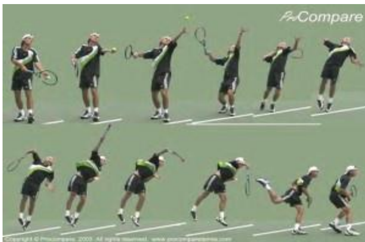
Slika 5. Servis.

Kod servisa je izuzetno važno bacanje lopte. Pravac bacanja lopte određuje i vrstu servisa. Postoje različite vrste servisa: ravan, top-spin, slice-servis. Servis zahvati su: kontinentalni, poluistočni forhend zahvat i poluistočni bekend zahvat. Servis se izvodi otprilike 30 cm. lijevo ili desno od sredine osnovne linije. Tijelo okrećemo prema mreži, lijevo stopalo je uz liniju (u slučaju da serviramo sa desne strane), a desno je skoro paralelno sa mrežom. Težina tijela je više na desnoj nozi. Reket se drži objema rukama koje su blago savijena u laktu, a u