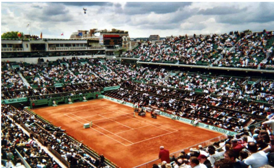
Slika 2. Roland Garros, zemljana podloga.

Zemljani se tereni općenito smatraju najsporijom podlogom za tenis i kao takvi imaju svoje specifičnosti koje traže prilagodbu tenisača. Loptica na njima odskače relativno visoko i sporo, a izmjene udaraca mogu potrajati znatno duže nego kod, primjerice, travnatih ili tvrdih terena. Veće trenje kod zemljanih podloga odgovorno je za usporavanje loptice što ne ide na ruku igračima koji svoju igru baziraju na snažnom servisu. Na zemljanim se terenima najbolje snalaze tenisači koji vole igrati defanzivni tenis s osnovne linije. Kretanje igrača je specifično – zamjetan je klizeći korak pri istrčavanju na lopte koje je teže dohvatiti. Najpoznatiji su crveni zemljani tereni koji nastaju od mljevene cigle. U Sjevernoj je Americi popularna Har-Tru podloga – podloga nastala od specifične mljevene zelene stijene. Har-Tru je nešto brži od "obične" zemljane podloge. Dodatkom pigmenta boja zemljanih terena se može mijenjati prema želji. Način izrade zemljanih terena u osnovi podrazumijeva ravnanje prirodnog tla na koje se postavlja sloj kamenog granulata koji ima ulogu drenažnog sloja. Na to se postavlja sloj od ostataka željezne rudače iznad kojeg ide sloj vapnenačkog kamena. Na vrhu se nalazi zemljani sloj posut crvenom prašinom nastalom mljevenjem cigle. Zemljani su tereni zahvalni zbog činjenice da po udarcu loptice o tlo ostaje vidljiv trag koji u dvojbenim situacijama olakšava odluku je li loptica završila unutar ili izvan terena.