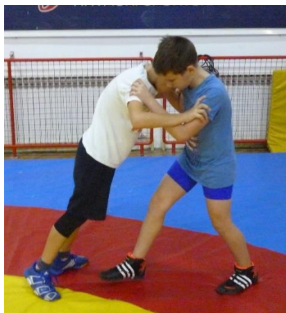
Slika 26: igra 25

26. Opis i pravila: hrvači stoje jedan nasuprot drugog, drže ruke iza leđima i nastoje stati jedan drugom na stopalo.