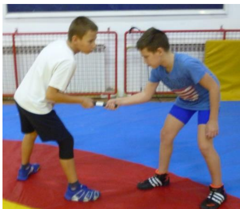
Slika 36: igra 23

Elementi tehnike: osnovni napadački hrvački stav