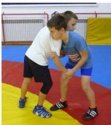
Slika 41: Igra 42

Elementi tehnike: dovođenje u parter, rameno bacanje