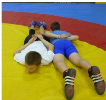
Slika 45: Igra 12