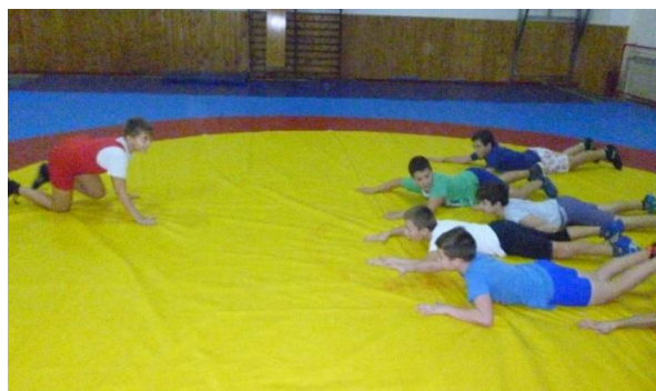
Slika 14: Puzeći hrvači

strunjače na drugi, ali tako da pokušaju izbjeći hrvača na sredini strunjače. Cilj igre je da hrvač u sredini strunjače okrene jednog puzećeg hrvača na leđa prije nego puzeći hrvač ne dotakne drugi kraj strunjače. Samo jedan puzeći hrvač mora dotaknuti kraj strunjače da bi spasio ostatak puzećih hrvača koji slobodno prelaze na drugu stranu te se igra ponavlja. Hrvači koji su okrenuti ostaju na sredini strunjače i pokušavaju okrenuti ostale. Pobjednik je onaj hrvač koji jedini ostane neokrenut. Hrvači koji se nalaze na sredini strunjače ne smiju se podizati iz visokog parternog položaja. Za vrijeme igre hrvači izvode tehnike napada i obrane u položaju partera. Ovom igrom utječemo na razvoj specifične maksimalne i eksplozivne snage, koordinacije i brzine.