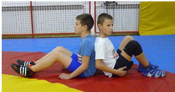
Slika 43: Igra 5