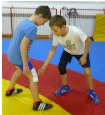
Slika 47: igra 18