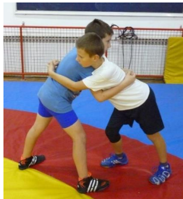
Slika 40: igra 37

Elementi tehnike: križni hvat i bacanje uvinućem, obaranje obuhvatom trupa, presavijanje