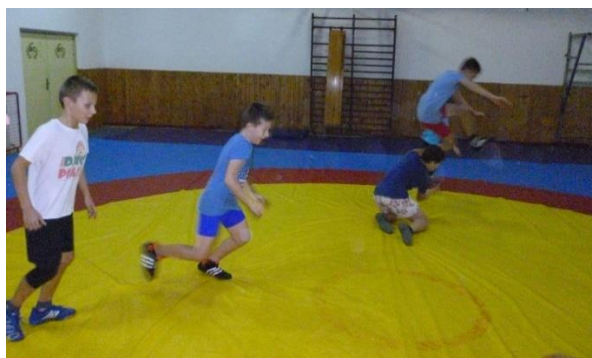
Slika 16: Ovčice preko ograde

Trener označi vijačom prostor u kojem se nalazi vuk, između livade na kojoj su ovčice i prazne livade. Cilj je da što više ovčica pretrči na livadu koja je slobodna (slika 16). Onoga koga vuk (u četveronožnom položaju) dotakne, prelazi iz stojećeg položaja u skupinu vukova i lovi ostatak ovčica. Posljednja ovčica je pobjednik. Ova igra služi za razvoj koordinacije, brzine i agilnosti.