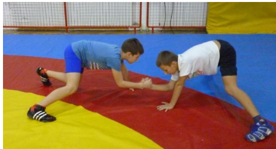
slika 24: igra 20