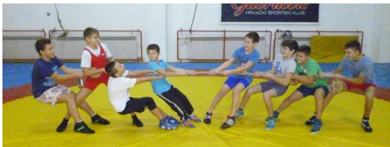
Slika 1: Povlačenje konopca