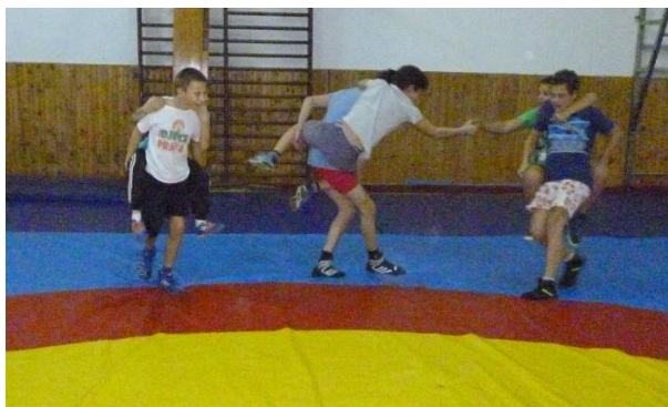
Slika 15: Hvatanje konjanika