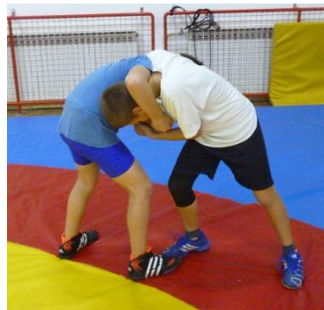
slika 30: igra 7