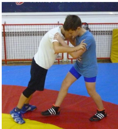
Slika 26: igra 25

26. Opis i pravila: hrvači stoje jedan nasuprot drugog, drže ruke iza leđima i nastoje stati jedan drugom na stopalo.