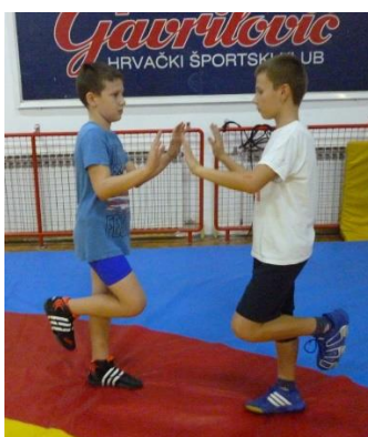
Slika 19: Igra 5

Specifične sposobnosti: “osjećaj za protivnika“, brzina reakcije i održavanje ravnoteže