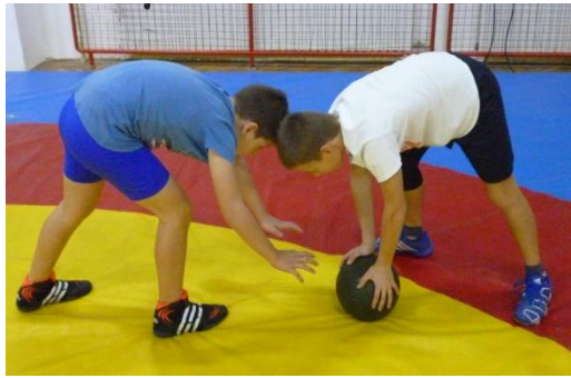
Slika 48: igra 20

Elementi tehnike: dolazak na leđa, usavršavanje osnovnog borbenog položaja