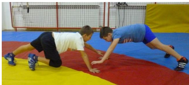
Slika 27: igra 28

Elementi tehnike: kretanje u visokom parternom položaju