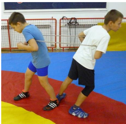
Slika 37: igra 28

29. Opis i pravila: hrvači stoje jedan nasuprot drugog i drže se rukama međusobno za nadlaktice. Zadatak je izvući protivnika iz zadanog prostora.