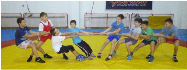
Slika 1: Povlačenje konopca