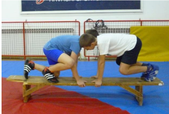
Slika 21: Igra 11

Specifične sposobnosti: izbacivanje protivnika iz ravnoteže i održavanje ravnoteže