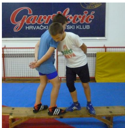
Slika 20: Igra 9