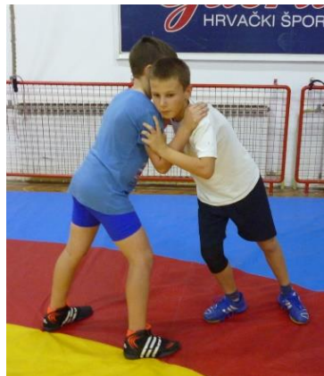
Slika 29: igra 1

Elementi tehnike: učenje osnovnog hrvačkog stava i izguravanje iz kruga