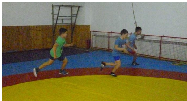
Slika 10: Hvatalica oko kruga