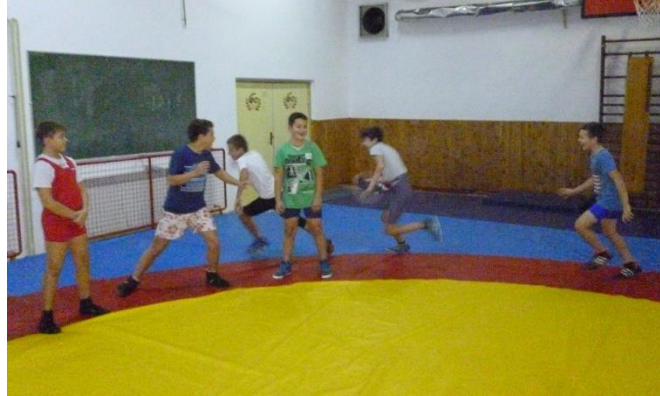
Slika 9: Udaranje mlatićem

Hrvači stoje na vanjskom rubu borilišta, licem okrenuti prema centru borilišta i držeći ruke iza leđa (slika 9). Iza svih stoji jedan hrvač koji u ruci drži mlatić od spužve ili sličnog materijala. Hrvač mora neprimjetno staviti mlatić u ruku drugom hrvaču, te on hvata prvog hrvača do sebe s ciljem da ga udari. Da bi se spasio drugi hrvač mora bježati trčecim korakom oko kruga te se vratiti do svog početnog mjesta. Igra služi za razvoj brzine, agilnosti, borbenosti.