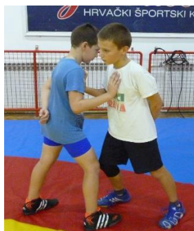
Slika 31: Igra 11

Elementi tehnike: izguravanje iz kruga, dovođenje u parter preko ruke