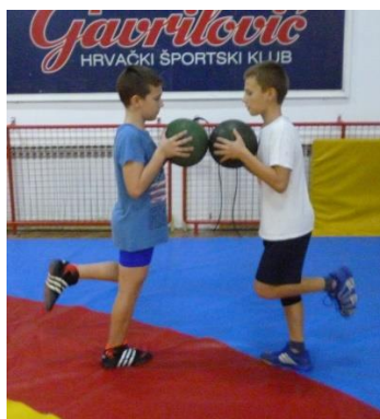
Slika 17: Igra 1