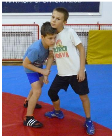
Slika 39: igra 34

Elementi tehnike: dovođenje u parter preko ruke