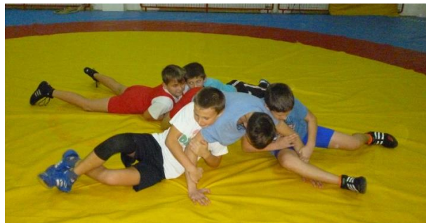
Slika 2: Guliver

Igra se provodi na strunjači i to u parternom položaju (slika 2). Jedan igrač je “Guliver”, a druga četvorica su Liliputanci koji nastoje savladati “Gulivera” tako što će ga položiti na prsa i “svezati” te ga držati za ruke i noge 10 sekundi. Igru igraju pet hrvača, a usporedno se mogu igrati nekoliko igara. Kroz igru hrvači razvijaju snagu ruku i ramenog pojasa, te pravilno postavljanje ruku i nogu za obranu od prevrtanja obuhvatom trupa.