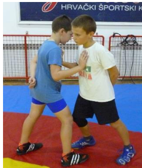
Slika 31: Igra 11

Elementi tehnike: izguravanje iz kruga, dovođenje u parter preko ruke