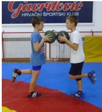
Slika 17: Igra 1