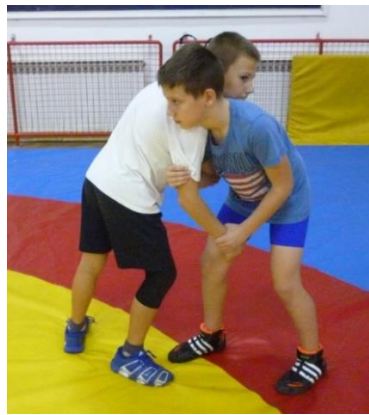
Slika 41: Igra 42

Elementi tehnike: dovođenje u parter, rameno bacanje