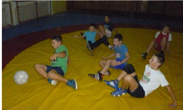
Slika 12: Četveronožni nogomet

Ova vježba služi za razvijanje statičke snage ruku i trupa, ponajviše mišića opružaća podlaktice, ali i za razvoj opće koordinacije. Te mišićne skupine i ta vrsta koordinacije posebno su bitni kod obrane od okretanja obuhvatom trupa te ostalih tehnika hrvanja u parternom položaju.