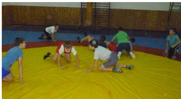
Slika 3: Gusari