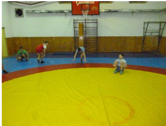
Slika 7: Hvatalica u i oko kruga

Unutar hrvačkog borilišta koje je u obliku kruga stoje hrvači, a jedan ili dva hrvača su lovci i oni se nalaze izvan kruga (slika 7). Hrvači i lovci da bi ušli ili izašli iz kruga moraju napraviti zadatak – npr. pad prema naprijed. Cilj igre je da lovac rukom dotakne hrvača prije nego izvede pad i izađe ili uđe u krug. Nakon što lovac rukom dotakne nekog od hrvača, uloge im se zamjenjuju i hrvač postaje lovac. U igri se zadaci mogu mijenjati kao na primjer: kolut naprijed, kolut natrag, okret za 360 °i slično. Igra služi za razvoj koordinacije, brzine i agilnosti.