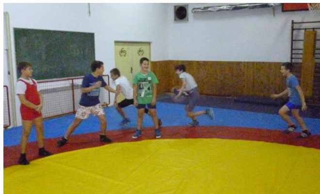
Slika 9: Udaranje mlatićem

Hrvači stoje na vanjskom rubu borilišta, licem okrenuti prema centru borilišta i držeći ruke iza leđa (slika 9). Iza svih stoji jedan hrvač koji u ruci drži mlatić od spužve ili sličnog materijala. Hrvač mora neprimjetno staviti mlatić u ruku drugom hrvaču, te on hvata prvog hrvača do sebe s ciljem da ga udari. Da bi se spasio drugi hrvač mora bježati trčecim korakom oko kruga te se vratiti do svog početnog mjesta. Igra služi za razvoj brzine, agilnosti, borbenosti.