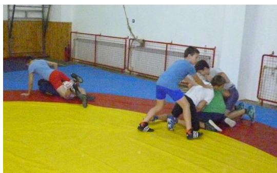
Slika 11: Kralj borilišta