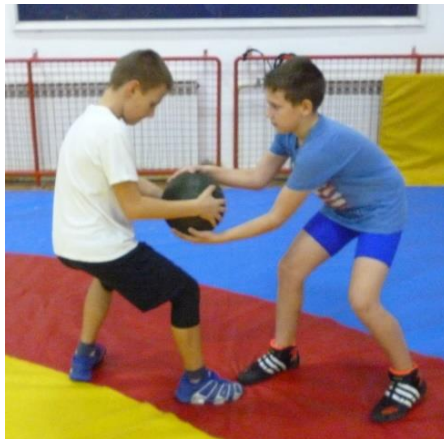
Slika 35: Igra 22

Elementi tehnike: učenje i usavršavanje osnovnog borbenog hrvačkog stava