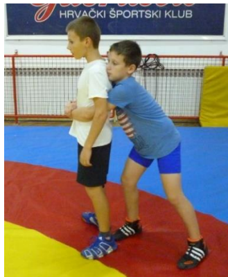
Slika 34: Igra 19