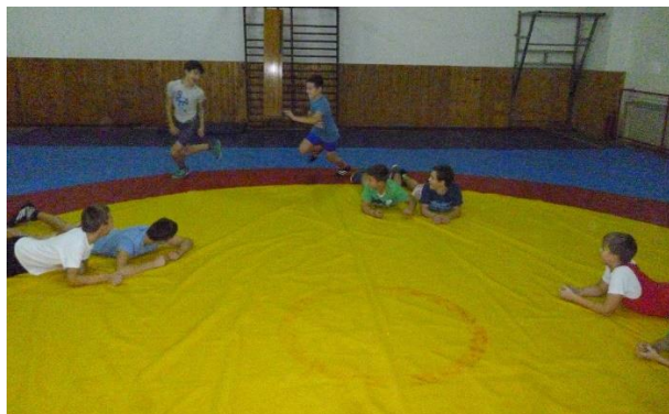
Slika 6: Hvatalica treći u paru

Hrvači su podijeljeni u parove, ali tako da leže na trbuhu jedan do drugog na strunjači (slika 6). Jedan hrvač bježi, dok ga drugi hvata. Da bi se spasio, hrvač koji bježi može leći pored bilo kojeg para. Umjesto njega ustaje onaj koji je najudaljeniji (tada treći) i bježi dalje. Kada lovac uhvati hrvača koji bježi, tada oni zamjenjuju uloge. Cilj igre je uhvatiti hrvača koji bježi prije nego legne na strunjaču i tako se spasi. Postoji i druga varijanta ove igre gdje je zadatak da hrvač koji je bježao legne pored nekog od parova, a najudaljeniji (treći) ustaje i hvata hrvača koji ga je do maloprije hvatao. Igra služi za razvoj koordinacije, brzine i agilnosti.