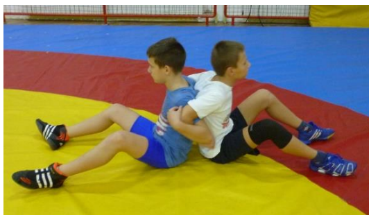
Slika 38: Igra 31

32. Opis i pravila: Hrvači stoje u zadanom prostoru, jedan hrvač nastoji uhvatiti drugog hrvača oko pojasa s leđa i spriječiti ga u određenom vremenu da ne izađe iz zadanog