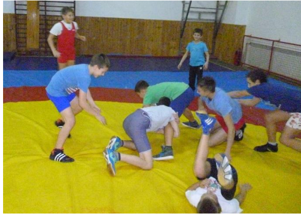
Slika 5: Vuk i ovca

Ova igra predviđena je hrvačima početnicima jer ne zahtjeva veliku snagu, dok stariji hrvači igraju napredniju varijantu ove igre. Tako kroz igru hrvači usavršavaju različite tehnike obaranja i rušenja protivnika hvatovima i obuhvatima za noge.