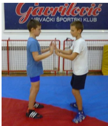
slika 18 : igra 3