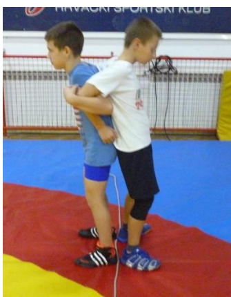
Slika 33: igra 14

Specifične sposobnosti: sposobnost izvođenja protivnika iz ravnoteže