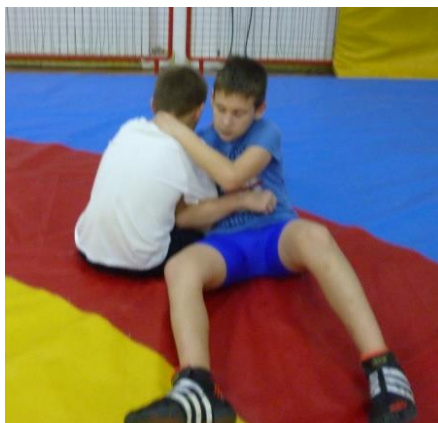
Slika 44: Igra 8