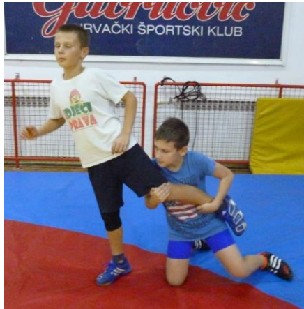
slika 25: igra 23

Elementi tehnike: dovođenje u parter i obrana od obaranja hvatom noge