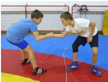
Slika 28: igra 31