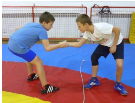
Slika 28: igra 31