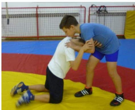
Slika 49: Igra 23

Elementi tehnike: dovođenje u parter, obaranje obuhvatom noge