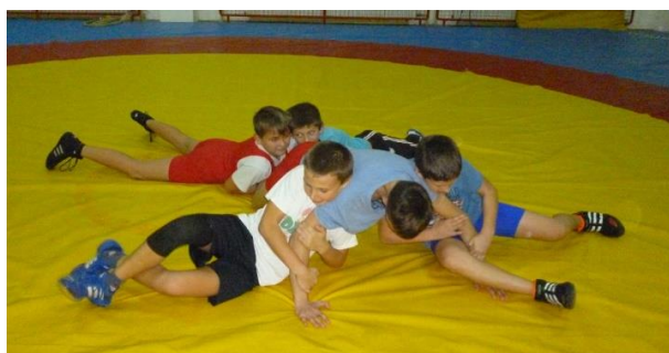
Slika 2: Guliver

Igra se provodi na strunjači i to u parternom položaju (slika 2). Jedan igrač je “Guliver”, a druga četvorica su Liliputanci koji nastoje savladati “Gulivera” tako što će ga položiti na prsa i “svezati” te ga držati za ruke i noge 10 sekundi. Igru igraju pet hrvača, a usporedno se mogu igrati nekoliko igara. Kroz igru hrvači razvijaju snagu ruku i ramenog pojasa, te pravilno postavljanje ruku i nogu za obranu od prevrtanja obuhvatom trupa.