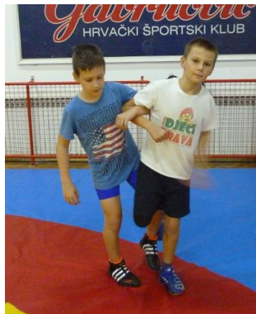
slika 23: igra 16

Elementi tehnike: obaranje kvačenjem noge