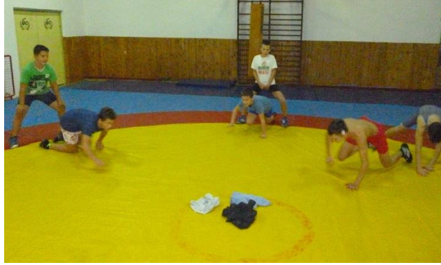
Slika 8: Hvatanje majice