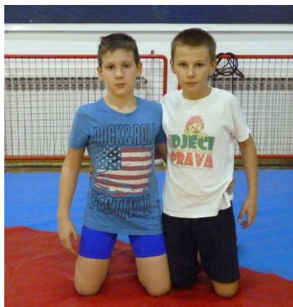
Slika 42: igra 1

Elementi tehnike: dovođenje u parter, dolazak na leđa