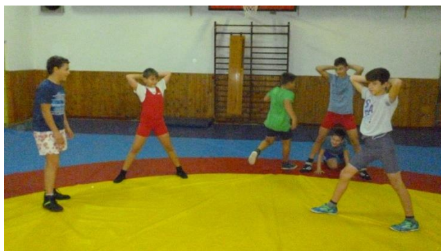
Slika 4: Ledena baba

Trener odredi jednog ili više hrvača koji dobivaju ulogu ledene babe i hvataju ostale (slika 4). Ostali hrvači slobodno se kreću trčecim korakom po dvorani, izbjegavajući ledenu babu. Zadatak ledene babe je trčecim korakom jednom rukom dotaknuti drugog hrvača te je on tada „zaleđen“. Zadatak „zaleđenog“ hrvača je zaustaviti se, zauzeti raskoračni stav, te staviti dlanove na potiljak. Slobodni hrvači pokušavaju „odlediti zaleđene“ suigrače na način da im se sprijeda četveronoške provuku kroz noge. Igra završava kada ledena baba zalede sve hrvače ili nakon isteka predviđenog vremena za igru. Igra služi za razvoj koordinacije, brzine i agilnosti.