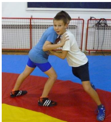
Slika 32: igra 13

14. Opis i pravila: hrvači stoje jedan nasuprot drugog okrenuti leđima (slika 33). Drže se rukama zakvačeni za laktove. Zadatak je prevući protivnika preko zadane linije.