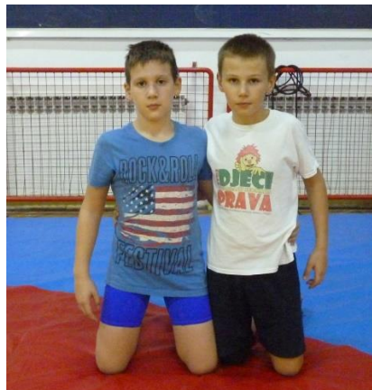
Slika 42: igra 1

Elementi tehnike: dovođenje u parter, dolazak na leđa