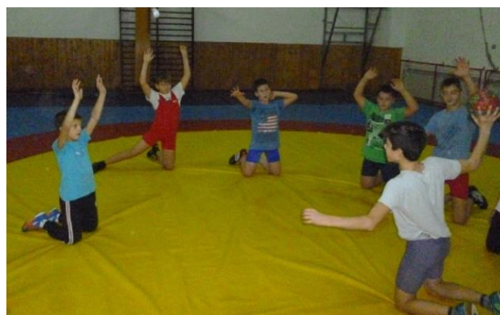
Slika 13: Rukomet na koljenima

Na strunjači su postavljeni golovi. Hrvači su podijeljeni u dvije ekipe podjednakih motoričkih znanja i sposobnosti. Svaka ekipa ima svoju boju dresa kako bi se lakše raspoznavali na terenu. Hrvači se isključivo moraju kretati u klečećem položaju (slika 13). Igra se igra loptom raznih dimenzija. Ukoliko u igri sudjeluje veći broj igrača u igru se ubacuju dodatne lopte. Cilj igre je u klečećem položaju, dodavajući se sa suigračima zabiti gol. Koljena se ne smiju dizati, a hrvača koji vodi loptu smije napadati samo jedan hrvač. Ovom igrom razvija se opća koordinacija i brzina.