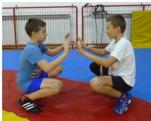
Slika 22: igra 13

Specifične sposobnosti: izbacivanje protivnika iz ravnoteže i održavanje ravnoteže