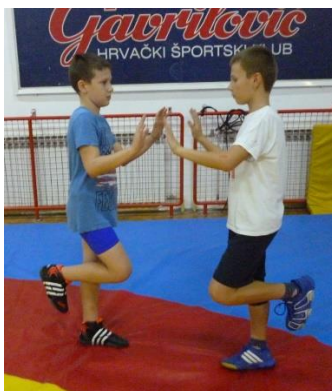
Slika 19: Igra 5

Specifične sposobnosti: “osjećaj za protivnika“, brzina reakcije i održavanje ravnoteže