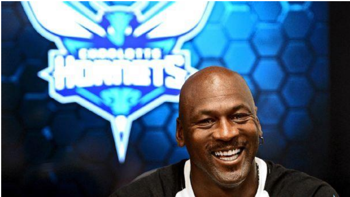
Slika 4. Michael Jordan, vlasnik NBA momčadi Charlotte Hornets

Izvor: http://espn.go.com/nba/story/_/id/11785709/charlotte-hornets-owner-michael-jordan-said-hopes-paved-road-others-player-become-owners