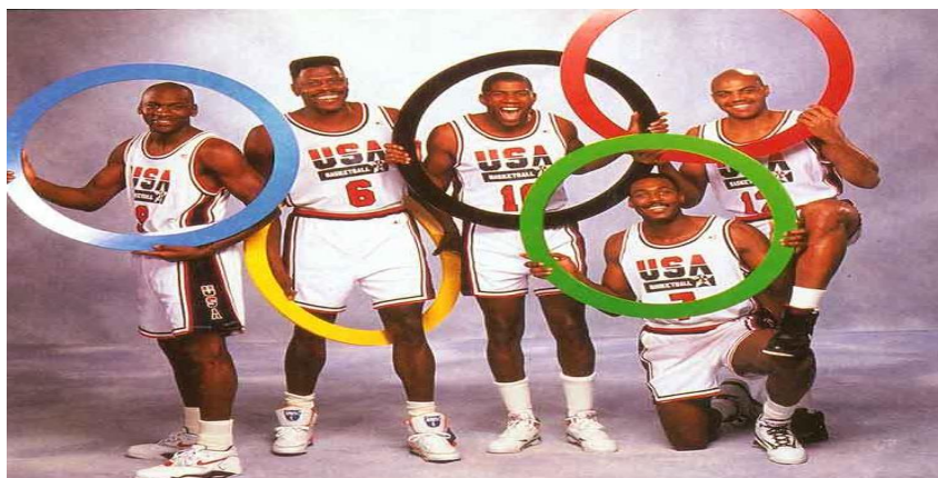
Slika 2. Osvajači zlatne medalje na Olimpijskim igrama u Barceloni 1992.

Globalizacija i povećanje prihoda je bio glavni razlog da NBA liga dozvoli svojim igračima nastup na Olimpijskim igrama 1992. Poznati Dream Team (slika 2.) koji je predvodio Michael Jordan donio je veliku medijsku pozornost. NBA liga je tim potezom omogućila prodaju medijskih prava i svojih proizvoda diljem svijeta. Danas se NBA utakmice prate u preko 200 zemalja i više od 70 igrača dolazi izvan SAD-a. Kina je najveće tržište za NBA izvan SAD-a s preko 50 000 dućana koji prodaju njihove proizvode, a 30% posjetitelja koji posjećuju internetsku stranicu NBA-a informiraju se putem mandarinskog jezika. NBA ekipe nastupaju na prijateljskim utakmicama, ali i igraju sezonske utakmice izvan SAD-a radi promocije lige (Coakley, 2014).