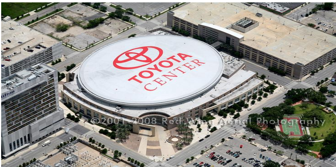
Slika 1. Toyota Centar, dvorana košarkaške ekipe Houston Rockets

Tokom povijesti sport je služio kao javna zabava za ljude različitih statusa, različitih klasa. Danas je sport izrazito komercijaliziran. Odluke o sportu, o pravilima igre donose ekonomske organizacije, a korporativni interes je toliko velik da određuju važnost i značenje samog sporta. Sport se sada ocjenjuje putem prihoda, prodaje roba, naknada od licenci, ugovora medijskih prava. Sportski događaji se procjenjuju na temelju medijskih kriterija poput tržišnog udjela i troškova reklamnog prostora. Sportaši imaju svoju zabavljачku vrijednost, ali i fizičke sposobnosti zbog kojih su prepoznati. Korporacije sa svojim logom obilježavaju ime stadiona, sportskih događaja. Proizvođač automobila Toyota platio je 100 milijuna dolara za korištenje njihovog imena kao imena dvorane (slika 1). Korporacije određuju raspored utakmica, medijski prijenos, obilježja dresa pojedinih ekipa. Vlasnici su sportskih ekipa koje pružaju zabavu milijunima ljudi (Coakley, 2014).