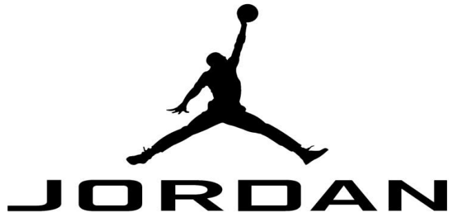
Slika 3. Air Jordan logo