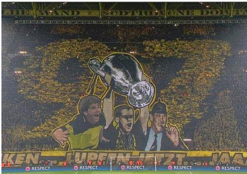
Slika 7. Koreografija navijača Borussie Dortmund.

Jedino što ostaje navijačima nakon ovakvih afera je nada u bolje sutra. Nada da će vodstvo institucija, klubova i nogometnih organizacija biti stručno, pošteno i da neće biti naznaka pojave korupcije.