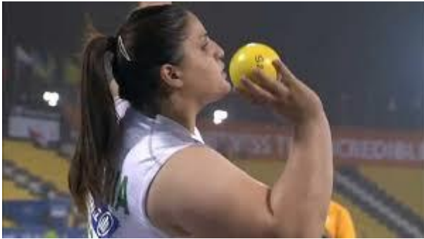
Slika 3. Bacanje kugle