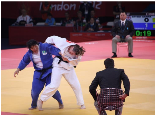
Slika 8. Judo borba