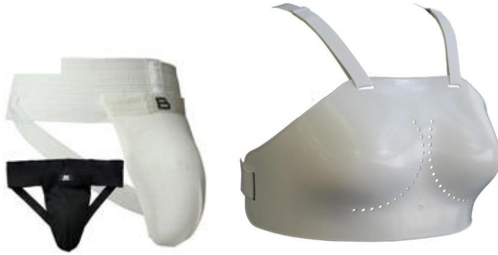
Slika 17. Suspenzor za muškarce i žene

turnirima svi igrači koji sudjeluju u igri moraju imati oči pokrivene mekanim flasterima (EYE PATCHES) ispod maske. (Slika 16) (IBSA, 2016)