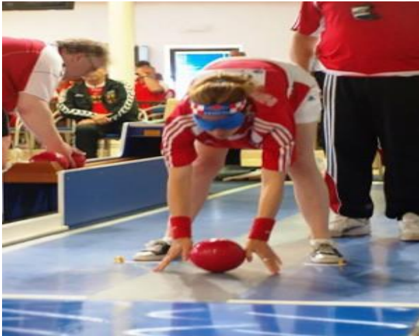
Slika 11. Kuglanje