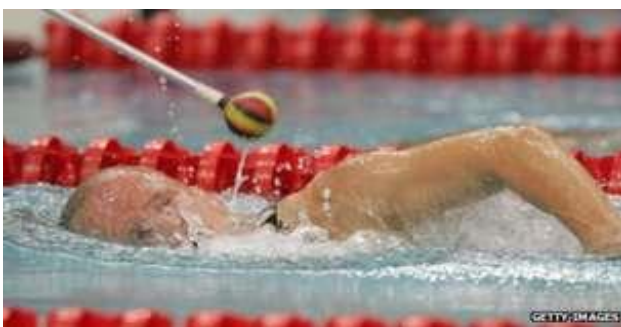
Slika 10. Plivanje