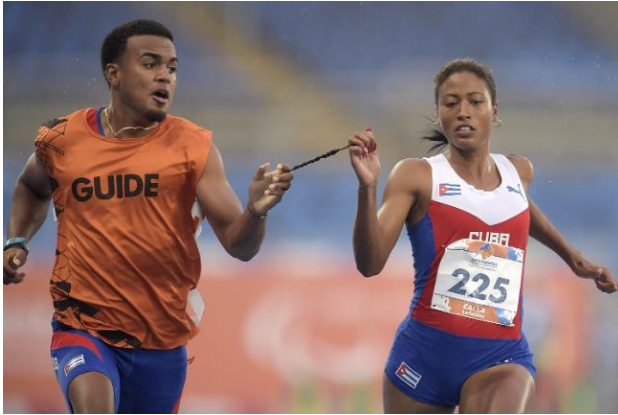
Slika 2. Trčanje