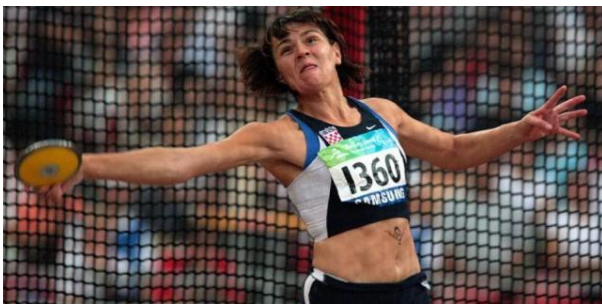
Slika 4. Bacanje diska