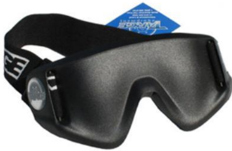
Slika 16. Neprozirna maska za goalball

Nepridržavanje bilo kojeg od ovih uvjeta će rezultirati kaznom odgode igre (DELAY OF GAME). ( Slika 15 ) (IBSA, 2016)