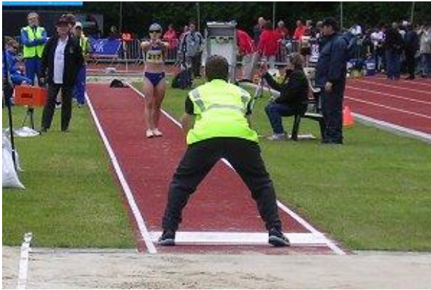
Slika 5. Skok u dalj