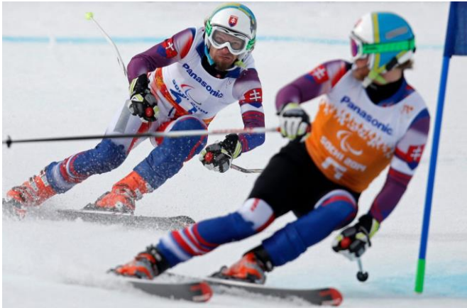
Slika 9. Skijanje s vodičem ispred slijepog skijaša