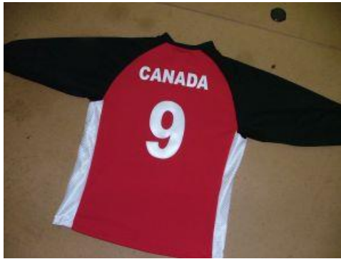
Slika 15. Goalballski dres

Svi igrači jednog tima moraju nositi isti dres. Svaki igrač mora imati određeni broj na sredini prednje i stražnje strane dresa. Veličina brojeva moraju biti najmanje 20 centimetara visine, moraju biti od 1 do 9 i ne smiju biti zaklonjeni sucima.