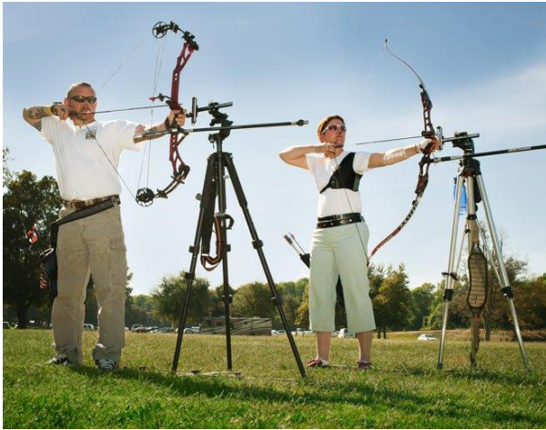
Slika 1. Streličarstvo