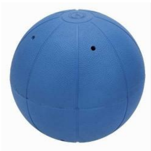
Slika 14. Zvučna lopta za goalball

Lopta (Slika 14) mora biti u skladu sa sljedećim specifikacijama: