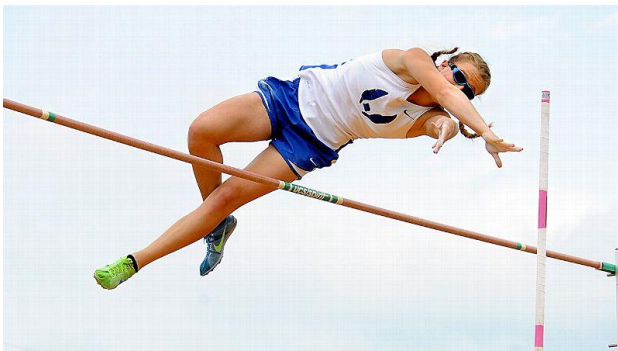
Slika 6. Skok u vis