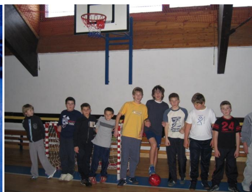
Slika 8. Sportske igre