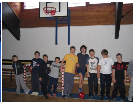
Slika 8. Sportske igre