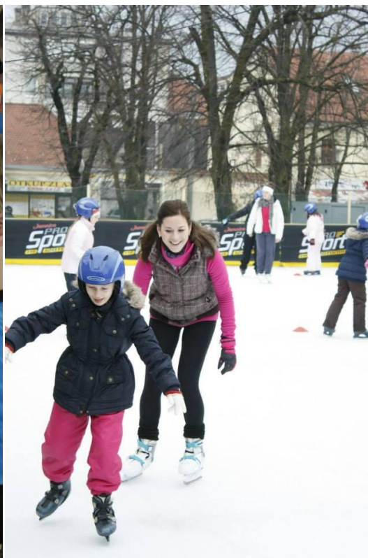
Slika 29. Škola klizanja