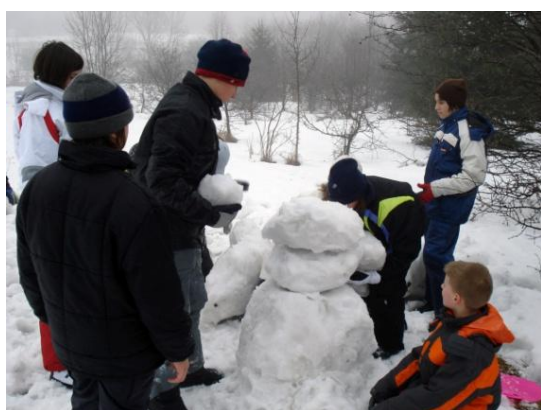
Slika 14. Izrada snježnih skulptura

2007. godine bio je vrhunac zimskih igračonica gledajući broj polaznika koji je iznosio 206. Iznos koji je grad subvencionirao iznosio je preko rekordnih 200 000 kn, a ukupni troškovi zimovanja bili su preko 300 000 kn. Osim dosadašnjih aktivnosti program je pojačan upoznavanjem osnova streličarstva te je organizirano natjecanje u istom (slika 16.). Provedena je nova igra "Potraga za blagom" (slike 15. i 17.) koja od djece iziskuje da putem zagonetki i snalaženja u prirodi rješavaju zadatke postavljene od strane voditelja. Također, iznimno zanimljivo je bilo i natjecanje u izradi snježnih skulptura (slika 14.).