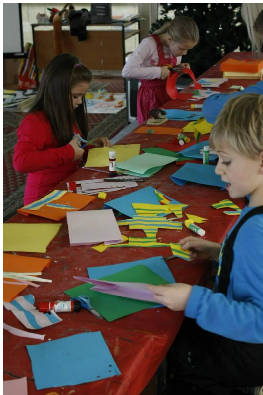
Slika 28. Likovna radionica

Ponuda klizališta građanima nudi sadržajno provođenje slobodnog vremena, mogućnost nadoknade onoga što suvremeni način života uzima, kao i stvaranje pozitivnih navika korisnog provođenja slobodnog vremena.