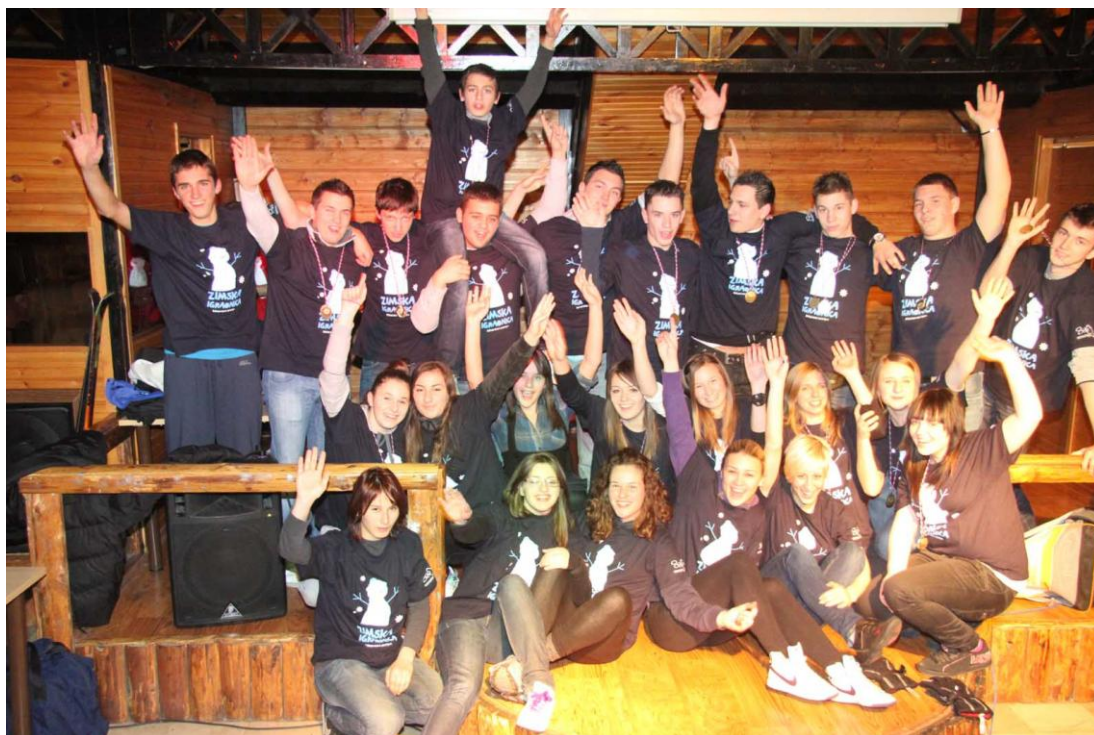
Slika 1. Sudionici zimske igraonice na Bjelolasici 2010. godine

Prošlo je 15 godina od kada je grad Jastrebarsko pokrenuo organizaciju zimske igraonice u želji da svakom djetetu u svome gradu omogući aktivno sudjelovanje u zimskim sportovima u mjestu, te izvan mjesta stanovanja. Detaljnom analizom programa Zimskih igraonica doći će se do zaključaka, te odlučiti o mogućnostima daljnje realizacije Zimskih igraonica u gradu Jastrebarsko. Moći će se zaključiti na koji se način i s kakvim efektom različiti programi realiziraju. Rad bi trebao poslužiti kao smjernica prema osiguravanju kvalitetne Zimske igraonice u budućnosti, kako u samom gradu, tako i izvan mjesta stanovanja.