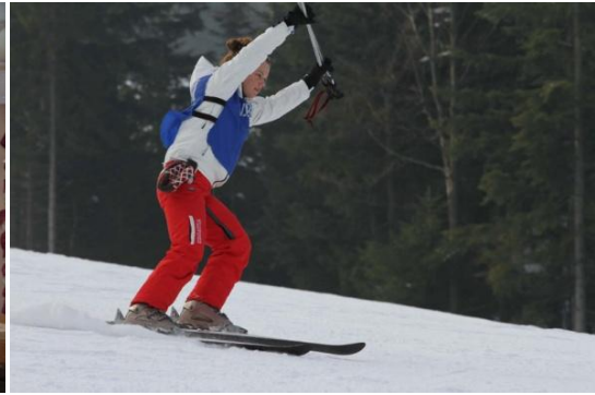
Slika 25. Škola skijanja