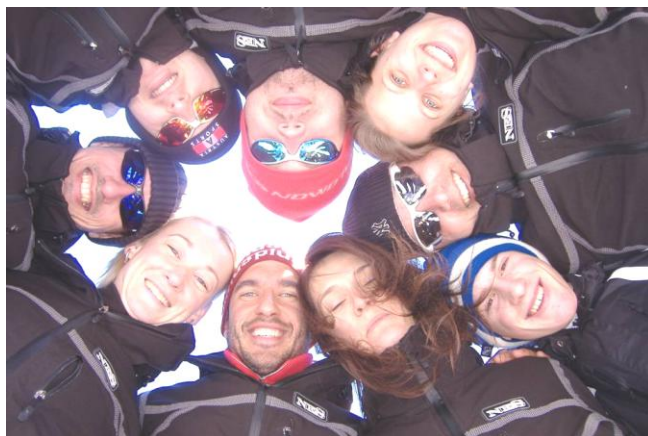
Slika 2. Voditelji

Djeca su pod cjelodnevnim vodstvom i pažnjom animatora (voditelja). Apsolutno svaka aktivnost ovisi o njihovoj organizaciji i načinu na koji će prenijeti interes na dijete. Ako djeca nemaju dobro i kvalitetno vodstvo mala je vjerojatnost da će se postići ciljevi samog zimovanja te kvaliteta istog. Zaključak je da su voditelji temelj kvalitetnog zimovanja, te samo dobri voditelji mogu prenijeti ljubav, interes i dobiti maksimalnu povratnu informaciju od djece. U suprotnom broj djece bi se iz godine u godinu smanjivao, a djeca se ne bi sa zimovanja vraćala ispunjena i radosna.