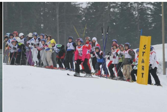
Slika 27. Natjecanje u skijanju