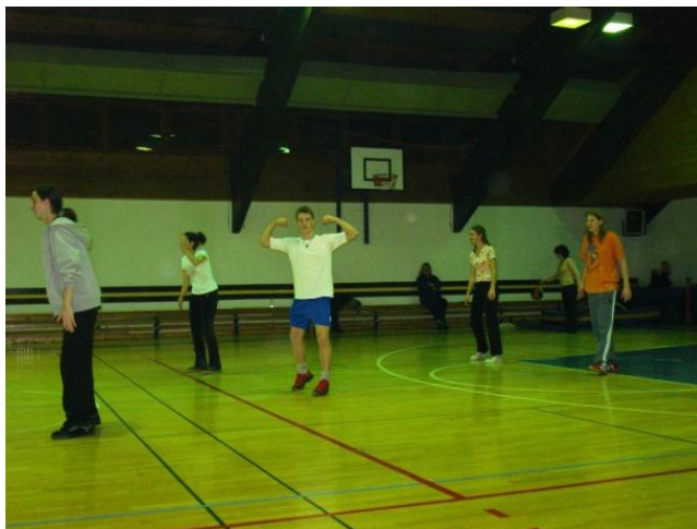
Slika 18. Sportski turniri

Noviteti u 2008. godini su bili sportski turniri u dvorani (slika 18.). Djeca su bila podijeljena u grupe te su se provodili turniri u: odbojci, nogometu, graničaru i košarci. Gledajući broj sudionika i troškove zimovanja, ova godina je usporediva sa 2007. te je odrađena na istoj razini.