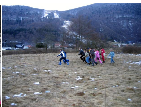
Slika 15. Potraga za blagom