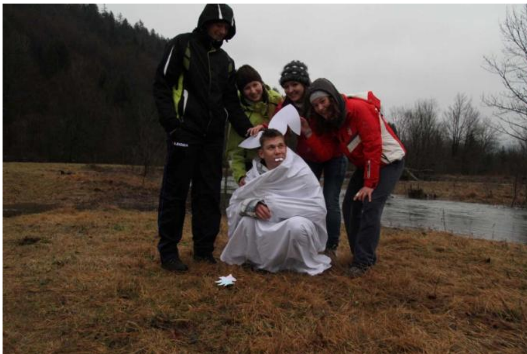
Slika 21. Kreativna radionica

2010. godinu bilježi smanjen broj sudionika koji iznosi 145, koji je vjerojatno povezan s vremenskim neprilikama. Zbog nedostatka snijega bio je potreban dodatni angažman voditelja i korištenje rezervnih, unaprijed planiranih i organiziranih aktivnosti u slučaju takvih uvjeta. Cijena je porasla na 550 kn. Sva djeca su bila na jednodnevnom izletu na Kleku gdje su upoznata s osnovama planinarenja (slika 22.). Osim toga prvi put su se mogli susreti na Zimskim igraonicama s igrom: paintball (slika 23.), te osmišljavanjem priče (slika 21.). Ove godine na zimovanju sudjelovalo je manje djece nego 2009. godine, što se može pripisati financijskoj situaciji, lošim vremenskim uvjetima kao i smanjenom interesu populacije starije školske dobi zbog nedostatka snijega a samim time i nemogućnosti organizacije škole skijanja.