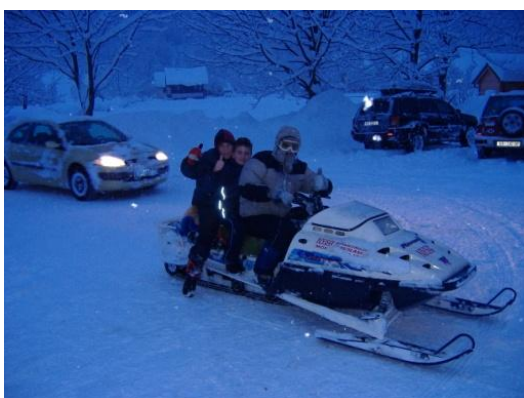
Slika 7. Vožnja motornim sanjkama