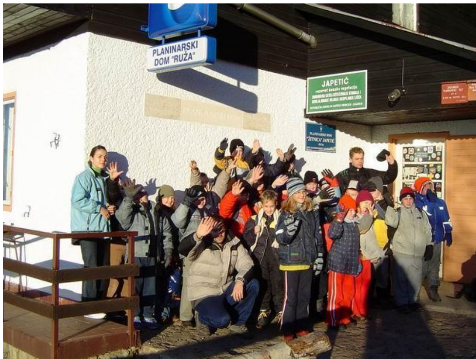
Slika 3. Sudionici Zimske igraonice na Japetiću