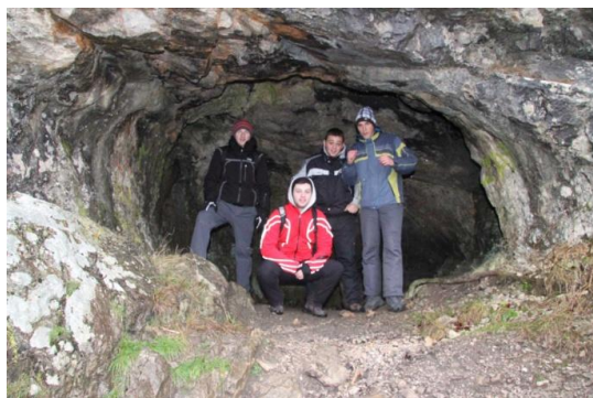
Slika 22. Izlet na Klek