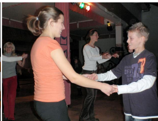
Slika 20. Mala škola plesa