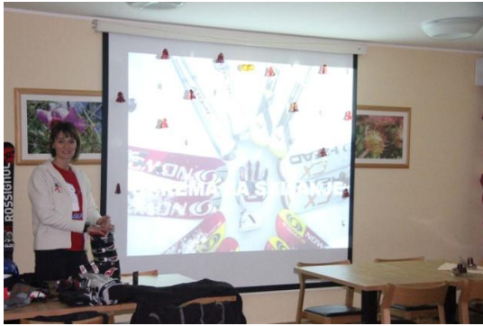
Slika 24. Teorijsko predavanje