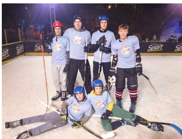
Slika 30. Hokej na ledu