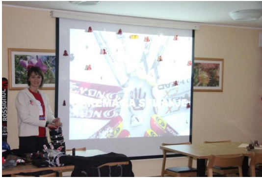
Slika 24. Teorijsko predavanje