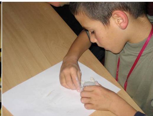
Slika 6. Likovna radionica