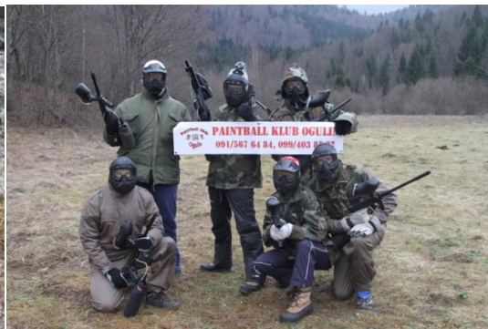
Slika 23. Paintball