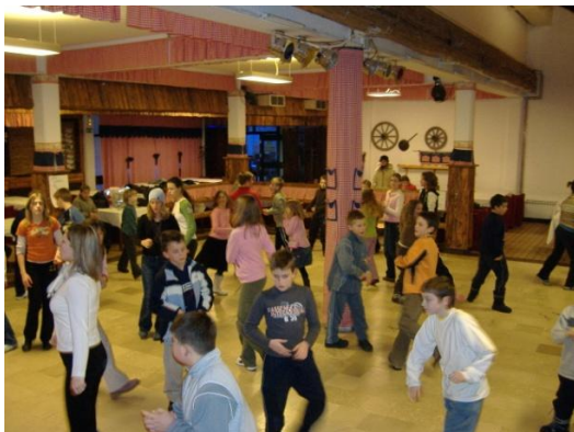
Slika 5. Koreografija

Program u dvorani je bio ispunjen sportskim i štafetnim igrama (slika 8.). Za kraj, zadatak su bile kreativne radionice gdje su djeca na bilo koju temu pripremala zajednički nastup i na taj način demonstrirali svoje talente (slika 10.).