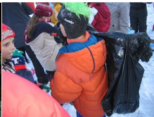
Slika 12. Briga za okoliš