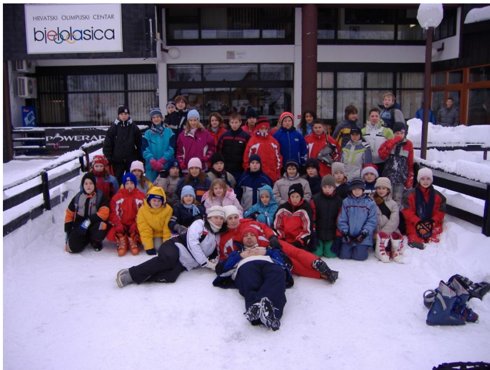
Slika 4. : HOC Bjelolasica (Izvor: Grad Jastrebarsko)

2005. godina za organizatore se nameće i kao velika prekretnica. Manji broj zainteresirane djece (42 djece) pokazalo je odluke roditelja da im djeca ne odu na zimovanje. Iako je PD Japetić bio lokacija izvan grada Jastrebarsko nalazio se je u neposrednoj blizini, što je roditeljima davalo dodatnu sigurnost. Uvjereni u opravdanost svoje odluke o organizaciju zimovanja u udaljenijem HOC Bjelolasici voditelji kreću s provođenjem zimovanja. Smještaj u apartmanima, gdje svaka soba ima svoju kupaonu, veliki je napredak nakon Japetića. Osim toga, skijaške staze i prostor za malu školu skijanja bilo je od velike važnosti za napredak i povećanje obujma aktivnosti. Osim male škole skijanja (slika 9.), prvi put se kao večernja aktivnost organizira ples. Odnosi se na zajedničku koreografiju svih sudionika igraonice koju su djeca učila svaki dan boravka te na završnoj večeri zajedno demonstrirali naučeno (slika 5.). Osim toga uvedena je i likovna radionica kao kreativna radionica u slučaju lošeg vremena (slika 6.). Na Bjelolasici , djeca su prvi put imala mogućnost voziti se motornim sanjkama (slika 7.). Sportska dvorana koristila se ponekad u večernjim terminima ili za vrijeme lošijih vremenskih uvjeta.