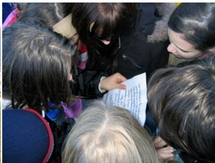
Slika 17. Potraga za blagom