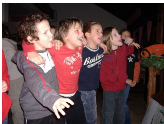
Slika 11. Dječji disko

Kvaliteta organizacije 2005.g. i odluka organizatora da prijeđe na novu destinaciju pokazala se opravdanom kroz veliki porast broja sudionika 2006. godine. Broj djece koji je pohađao zimovanje iznosio je 176 sudionika podijeljenih u 3 grupe. Grad je te godine sufinancirao projekt sa više od 100 000 kn. S obzirom na vremenske prilike koji nisu uvijek bile povoljne za sanjkanje i skijanje pojavile su se nove aktivnosti u prirodi. Boravak u prirodi je i dalje bio primarni dio zimovanja te su se provodile razne aktivnosti kao što su: čišćenje okoliša i briga o okolišu (slika 12.), upoznavanje s prirodom, upoznavanje šumskih puteva te oznaka u prirodi koje nam pokazuju kako se snaći u šumi (slika 13.). Večernji program je bio dodatno pojačan dječjim diskom (slika 11.).