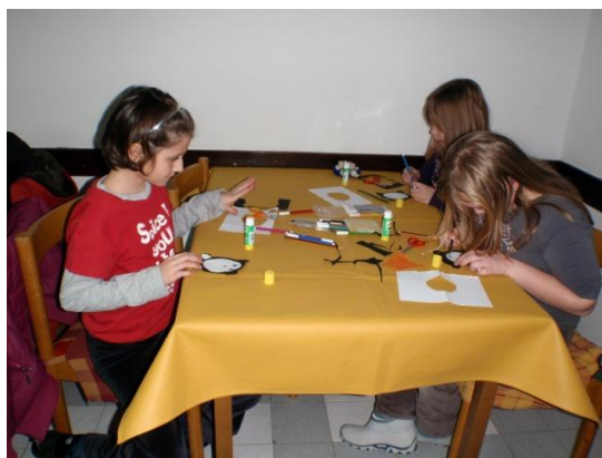
Slika 19. Izrada Božićnih čestitki

2009. godina prati trend 2007. i 2008. po kvaliteti i broju sudionika. No, povećava se sadržaj dosadašnjih aktivnosti, dan se provodi u prirodi, u igri i učenju, a popodnevni odmor je moguće upotpuniti izradom Božićnih čestitki (slika 19.) i malom školom plesa (slika 20.).