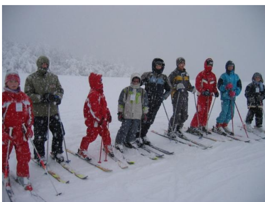
Slika 9. Škola skijanja