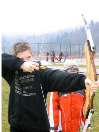
Slika 16. Streličarstvo