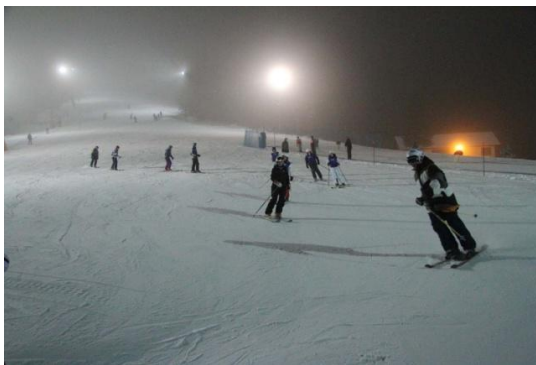
Slika 26. Noćno skijanje