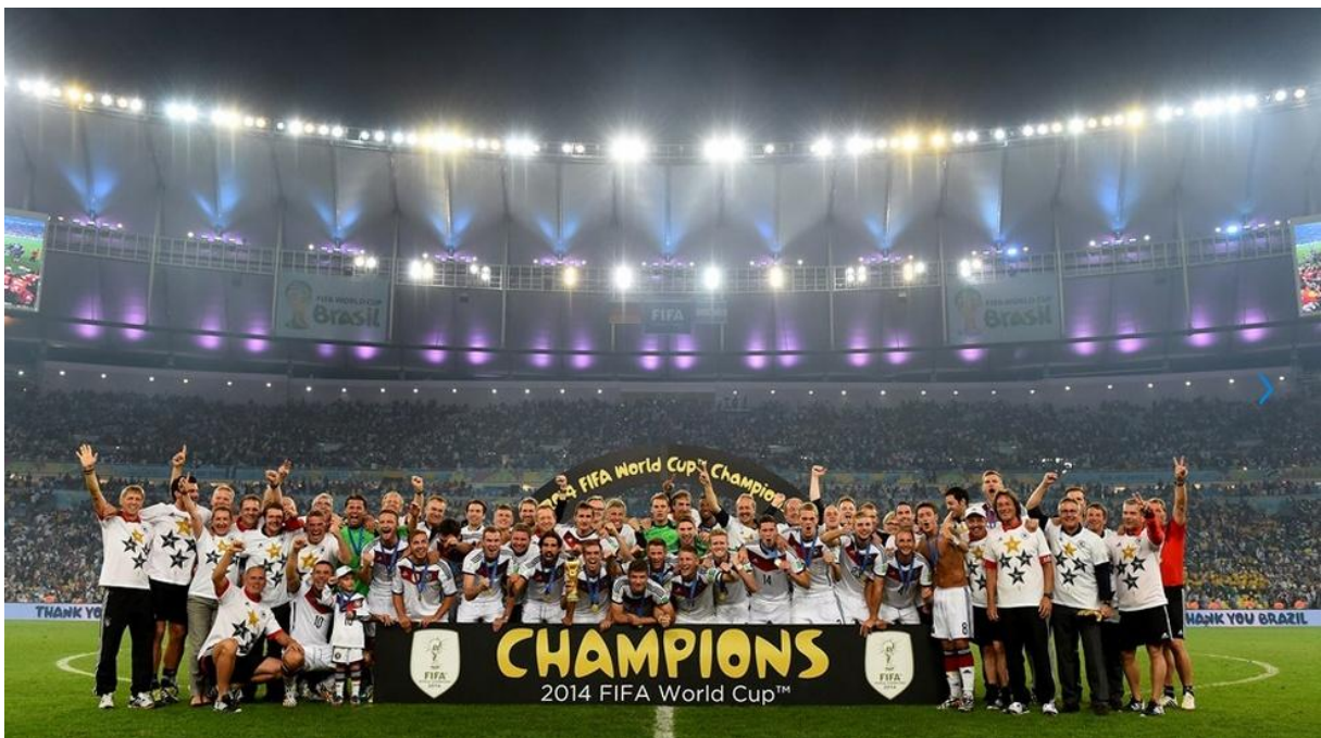
Slika 1. Svjetski nogometni prvaci 2014.

U radu je korištena analiza frekvencija napada s dolaskom u zonu završnice kao i vrijeme koje je potrebno da se dođe do zone završnice. Analiziran je i način organizacije završnice napada pri upućivanju udaraca prema vratima, u vrata i prilikom postizanja pogodaka. Tu se misli na individualne akcije igrača, jednostavne kombinacije u suradnji s dva igrača te na složene kombinacije u suradnji s više igrača. Osim toga, analizirani su i prostorni pokazatelji iz kojih se lopta upućivala u završnicu napada. Ovdje je riječ o pozicijama preko kojih je napad išao, bilo da je išao preko desnog krila, lijevog krila ili sredine terena. Uz sve navedeno, u radu su analizirani i udarci prema vratima, udarci u okvir vrata kao i postignuti zgoditci. U radu su prikazane tablice radi bolje preglednosti rezultata.