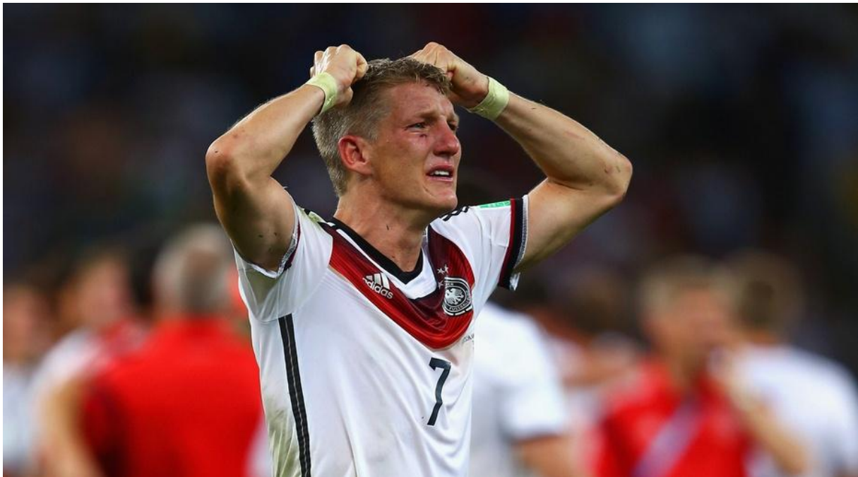
Slika 2. Bastian Schweinsteiger

Zadnjih 15' utakmice njemački napad je još 4 puta došao u zonu završnice i od 2 udarca prema vratima, 1 je išao u okvir gola iz čega je Müller u 78' postigao svoj treći, a njemački četvrti konačan gol.