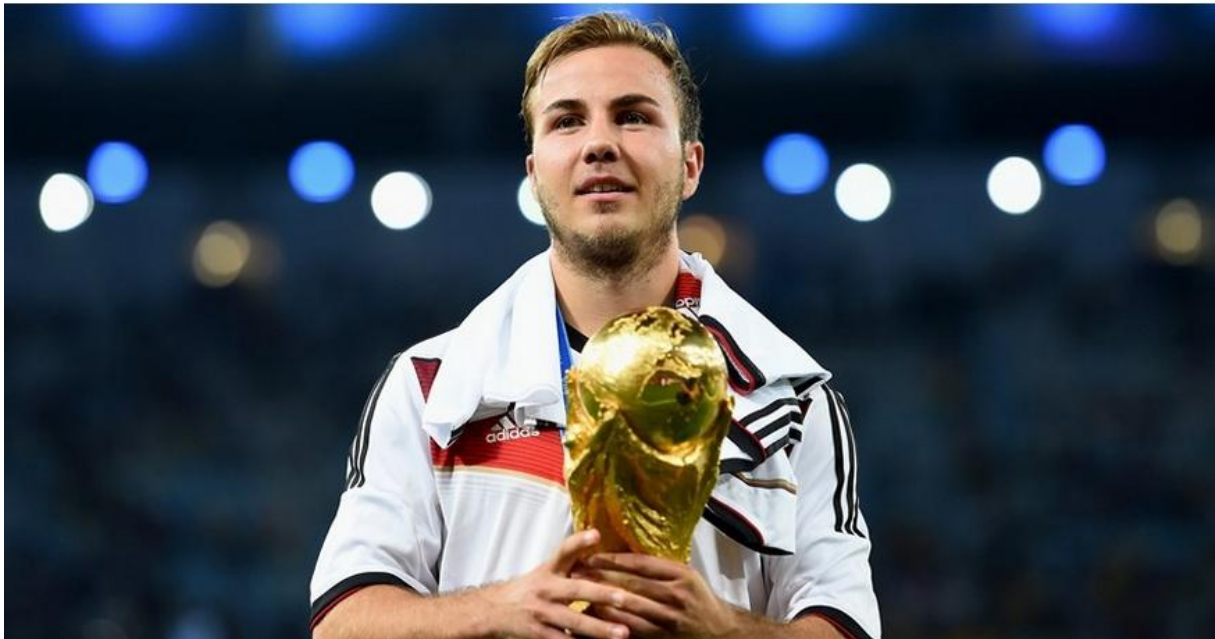
Slika 3. Mario Götze

Strijelac jedinog pogotka u finalnoj utakmici, Mario Götze, ukupno je na ovom prvenstvu odigrao pet utakmica, a na terenu je proveo 225 minuta. Nogometašu minhenskog Bayernsa taj pogodak je ujedno bio i jedini gol u Brazilu. Usporedbe radi, Thomas Müller je u 562 minute provedene na terenu ukupno postigao pet golova za Njemačku u šest odigranih susreta čime je i najbolji strijelac Njemačke nogometne reprezentacije na ovom prvenstvu.