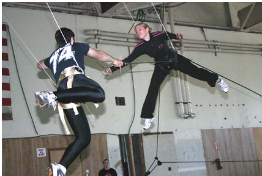
Slika 4. Ratchet and Rigging