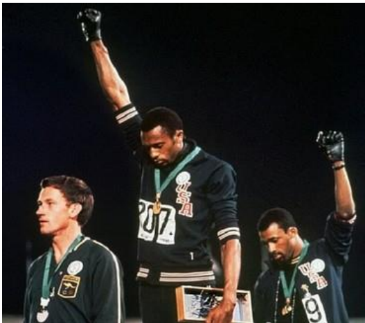
Slika 5 - Olimpijske igre u Meksiku, 1968. godine; Tommie Smith (sredina) i John Carlos (desno) čine „Black Power“ pozdrav, dok Peter Norman (lijevo) nosi značku olimpijskog projekta za ljudska prava kao znak solidarnosti

oko vrata predstavljala je crni ponos, a otkopčan gornji dio trenirke solidarnost prema osobama radničke klase. John Carlos nosio je i ogrlicu od perli koja je predstavljala pojedince koje su linčovali ili ubili i za koje se nitko nije pomolio, koji su obješeni i razapeti. Tommie Smith objasnio je njihovu gestu pozdravom za ljudska prava. Publika ih je izviždala kada su sišli s podija, a Međunarodni olimpijski odbor doživotno je zabranio nastup na Olimpijskim igrama obojici atletičara. Smith je nakon toga izjavio: „Ako pobijedim, ja sam Amerikanac, a ne crni Amerikanac. Ali ako sam napravio nešto loše, onda će reći da sam crnac. Mi smo crni i ponosni što smo crni. Crna Amerika će shvatiti što smo učinili večeras.“ Dok je John Carlos nadodao: „Znali smo da je ovo što smo napravili veće od bilo kojeg sportskog postignuća.“ 5