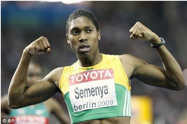
Slika 3 - Mogadi Caster Semenya, osvajačica zlata na Svjetskom prvenstvu u Berlinu 2009., nakon čega ju je Međunarodni olimpijski odbor slao na spolnu identifikaciju

dijagnosticirana joj je depresija. Srećom, njezin sustav za podršku bio je jak te se vratila sportu 2011. i sudjelovala na Olimpijskim igrama u 2012. godini.