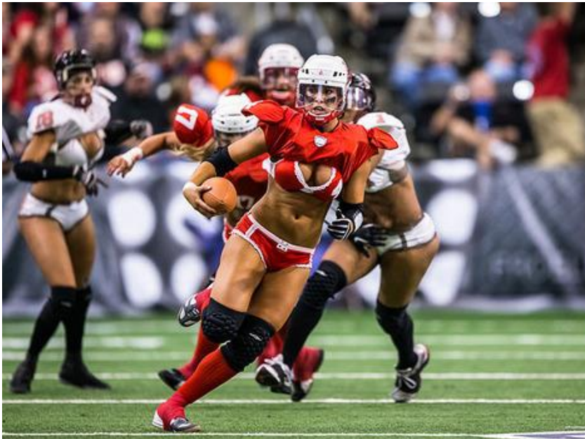
Slika 1 – Reformirana isprika

Cilj je bio istaknuti ženstvenost i ublažiti bilo kakve veze s maskulinitetom. Sportašice danas koriste reformiranu ispriku (Slika 1). Ponosno izražavaju svoju asertivnost, žilavost i zasluženost mjesto u sportu, dok u isto vrijeme izražavaju svoju ženstvenost kroz odjeću, šminku kao i poziranje sa ili bez odjeće u časopisima. Drugim riječima, „guraju“ granice tako da daju više prostora ženama da budu sve što žele biti, ali ne žele izbrisati ili transformirati prevladavajuću rodnu ideologiju.