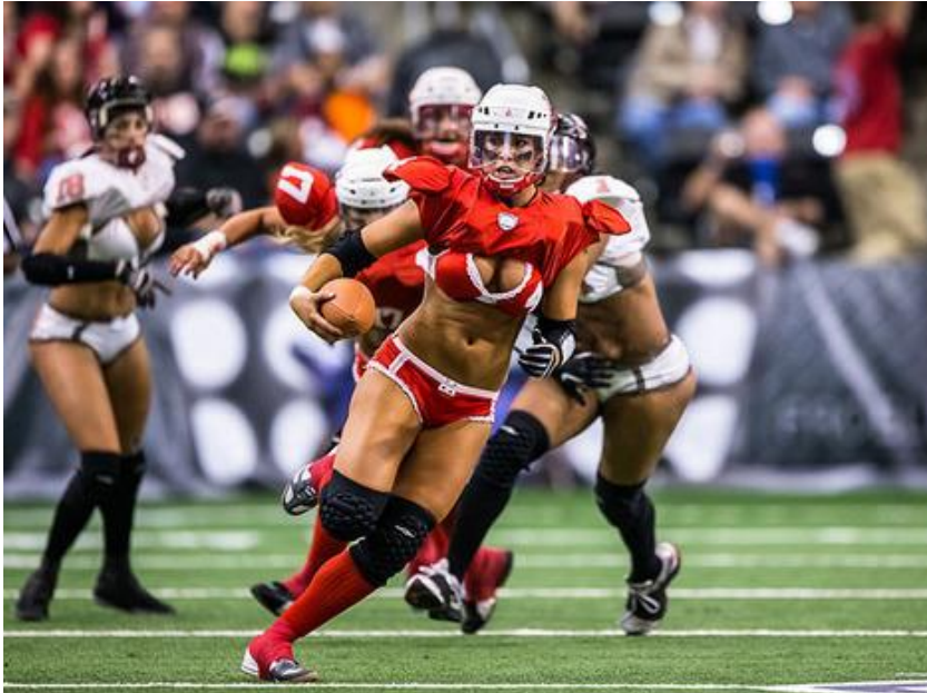
Slika 1 – Reformirana isprika

Cilj je bio istaknuti ženstvenost i ublažiti bilo kakve veze s maskulinitetom. Sportašice danas koriste reformiranu ispriku (Slika 1). Ponosno izražavaju svoju asertivnost, žilavost i zasluženost mjesto u sportu, dok u isto vrijeme izražavaju svoju ženstvenost kroz odjeću, šminku kao i poziranje sa ili bez odjeće u časopisima. Drugim riječima, „guraju“ granice tako da daju više prostora ženama da budu sve što žele biti, ali ne žele izbrisati ili transformirati prevladavajuću rodnu ideologiju.