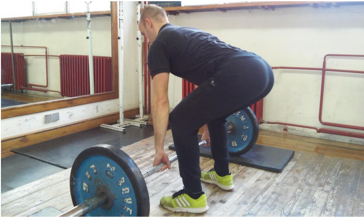
Slika 5.3. Izvedba vježbe mrtvo dizanje (početak faze podizanja ili završetak faze spuštanja)