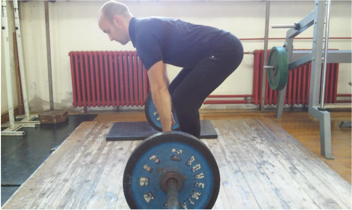
Slika 5.5. Izvedba vježbe mrtvo dizanje (početak faze podizanja ili završetak faze spuštanja)