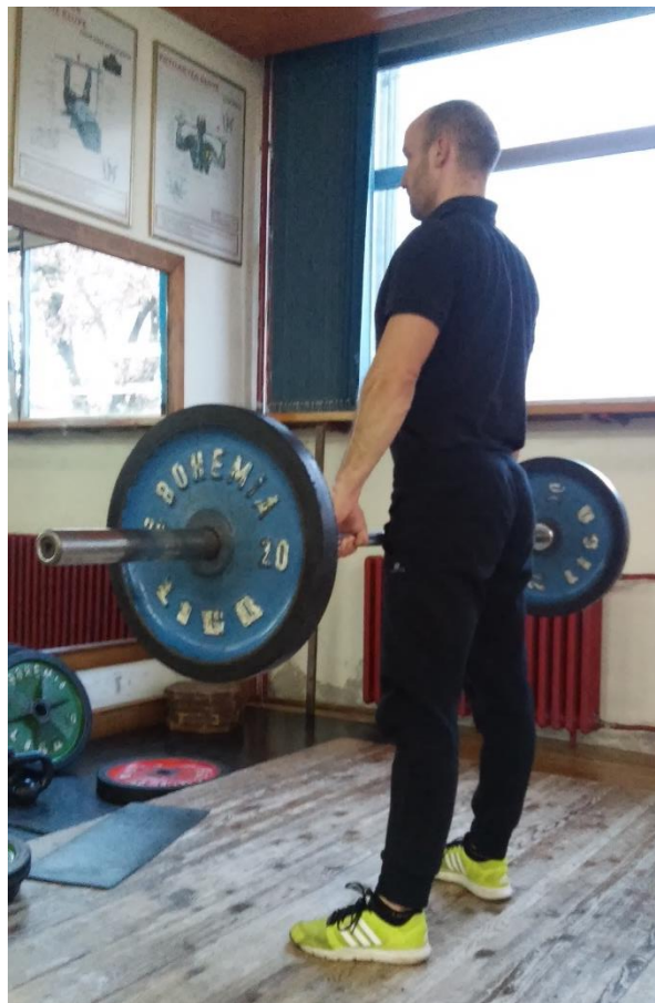
Slika 5.4. Izvedba vježbe mrtvo dizanje (početak faze spuštanja ili završetak faze podizanja)