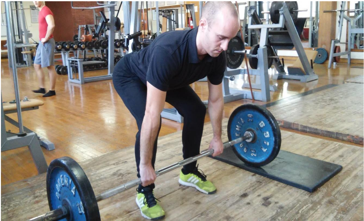
Slika 5.1. Izvedba vježbe mrtvo dizanje (početak faze podizanja ili završetak faze spuštanja)