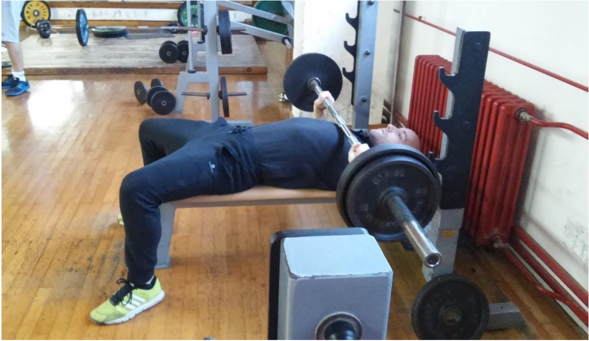
Slika 4.3. Izvedba vježbe podizanje s ravne klupe (početak faze podizanja ili završetak faze spuštanja)