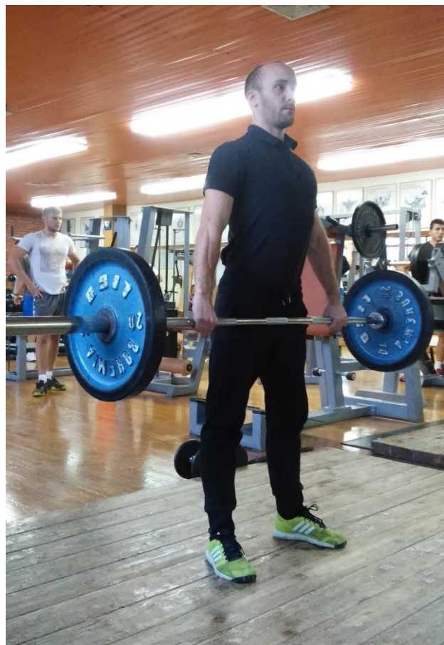
Slika 5.2. Izvedba vježbe mrtvo dizanje (početak faze spuštanja ili završetak faze podizanja)