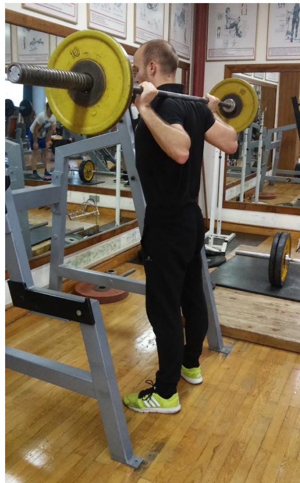
Slika 3.6. Izvedba vježbe čučanj (početak faze spuštanja ili završetak faze podizanja)