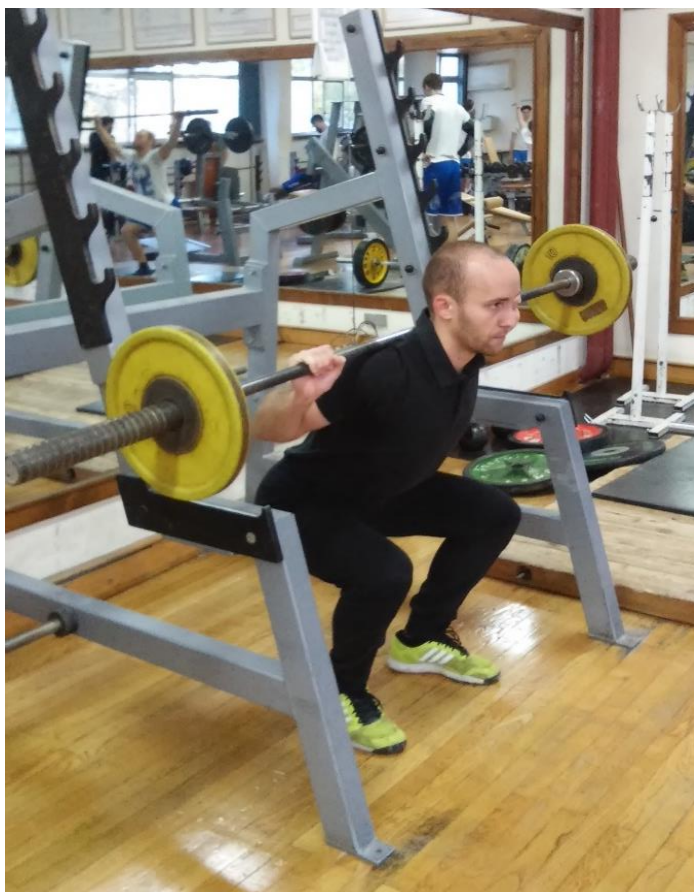
Slika 3.3. Izvedba vježbe čučanj (početak faze podizanja ili završetak faze spuštavanja)