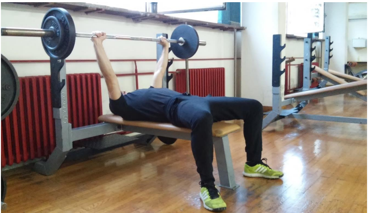
Slika 4.2. Izvedba vježbe podizanje s ravne klupe (početak faze spuštanja ili završetak faze podizanja)