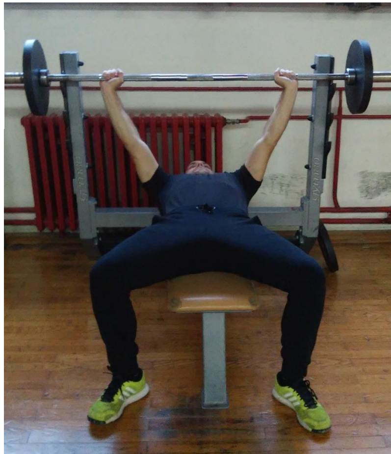
Slika 4.6. Izvedba vježbe podizanje s ravne klupe (početak faze spuštanja ili završetak faze podizanja)