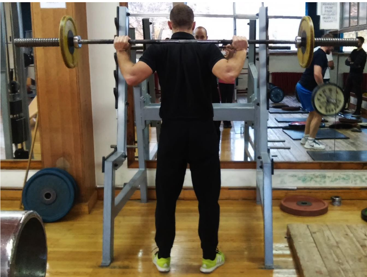
Slika 3.2. Izvedba vježbe čučanj (početak faze spuštavanja ili završetak faze podizanja)