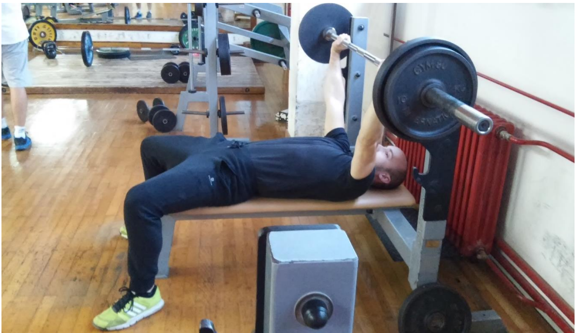
Slika 4.4. Izvedba vježbe podizanje s ravne klupe (početak faze spuštanja ili završetak faze podizanja)