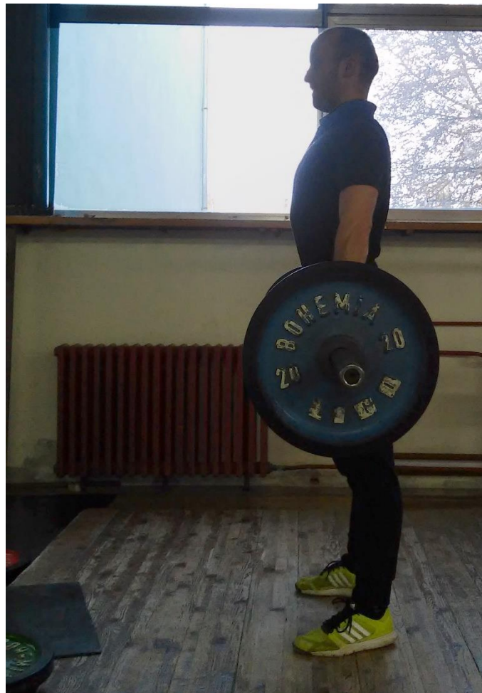
Slika 5.6. Izvedba vježbe mrtvo dizanje (početak faze spuštanja ili završetak faze podizanja)