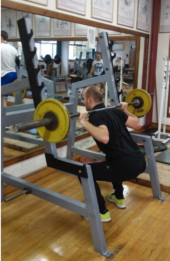
Slika 3.5. Izvedba vježbe čučanj (početak faze podizanja ili završetak faze spuštanja)