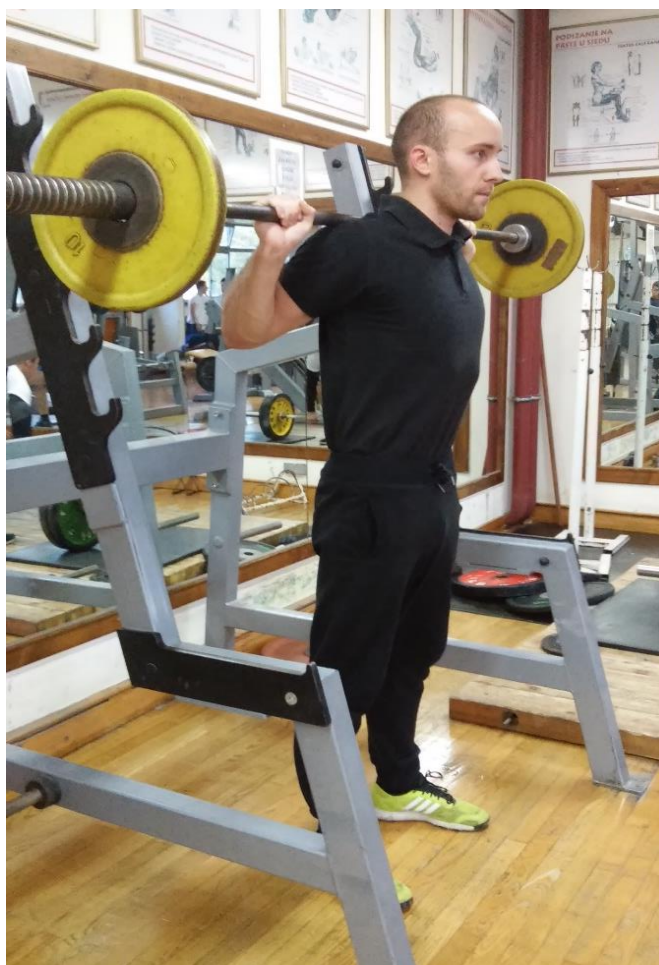
Slika 3.4. Izvedba vježbe čučanj (početak faze spuštavanja ili završetak faze podizanja)