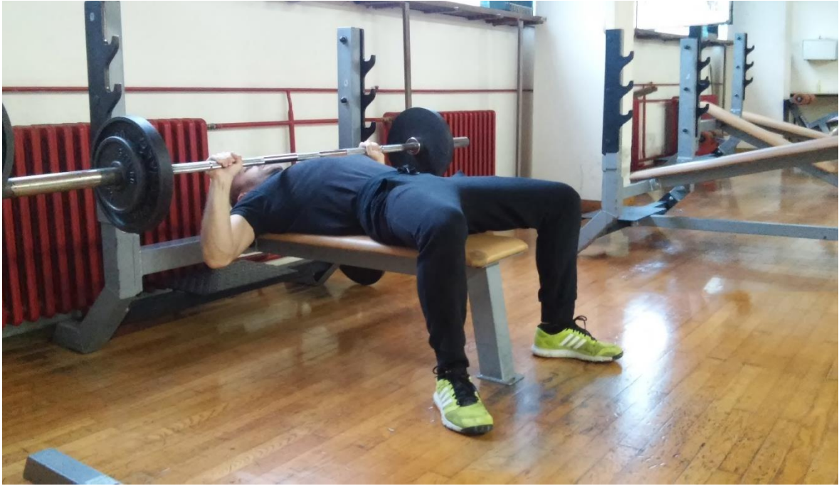
Slika 4.1. Izvedba vježbe podizanje s ravne klupe (početak faze podizanja ili završetak faze spuštanja)