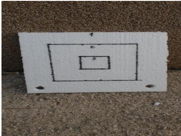
Fotografija 5. Meta izrađena od stiropora