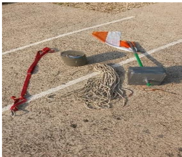
Fotografija 7. Plutača sa sidrenim konopom, utegom i gurnom