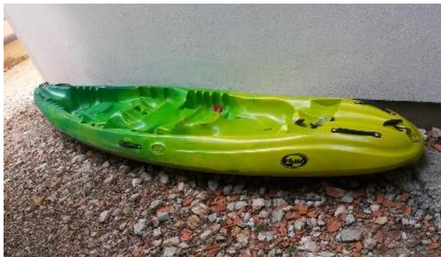
Fotografija 6. Kajak