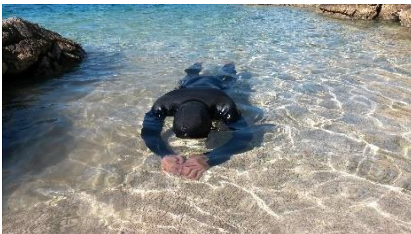
Fotografija 9. Mjerenje statike