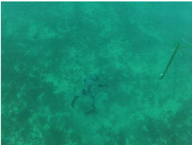
Fotografija 11. Gađanje