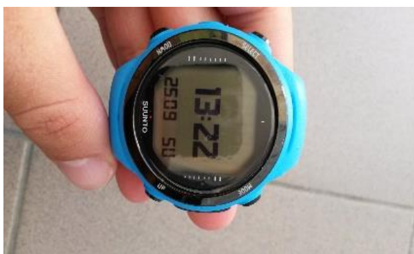
Fotografija 4. Ronilački kompjuter Suunto d4i