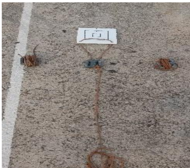
Fotografija 8. Utezi za mete s konopima odgovarajuće dužine i jedna meta