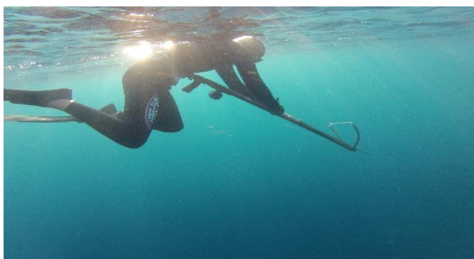
Fotografija 1. Napinjanje puške, napor za veliki broj mišića

Tokom podvodnog ribolova podvodni ribolovac može provesti i po desetak sati u moru i napraviti preko stotinu zarona. To je izuzetno dugotrajna i iscrpljujuća aktivnost pa je potrebno brinuti o izvorima energije kako bi sigurnije i djelotvornije lovio.