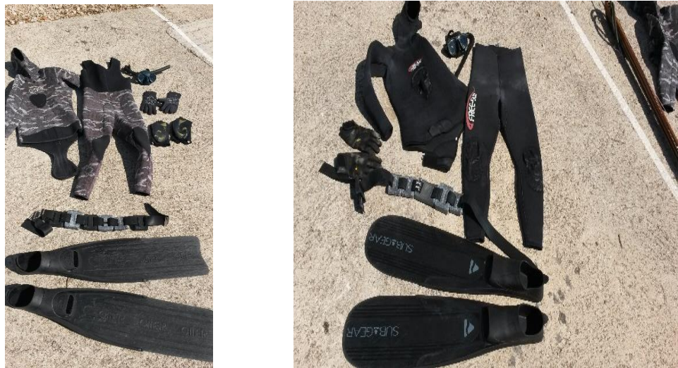
Fotografija 2. Oprema Ronioca 1 i Ronioca 2

Ronilac 2 koristio je ronilačko odijelo, maskirno, marke Omer, debljine 5 mm, materijala spacato fudra, masku Sporasub, gumenu dihalicu, peraje marke Omer plastičnih listova, rukavice debljine 3,5 mm, proizvođača Salvimar, također materijala spacato fudra, crne, čarape proizvođača Salvimar, crne i debljine 5 mm, materijala spacato fudra, gumeni pojas sa olovnim utezima individualno izbalansiranimi za potrebe različite dubine, debljine odijela i morfoloških karakteristika Ronioca 2.