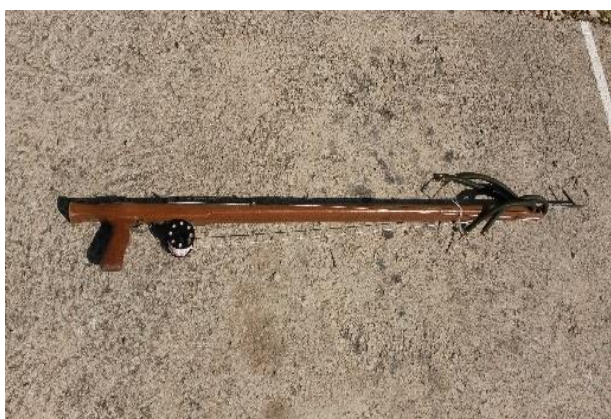
Fotografija 3. Podvodna puška

Namjerno je korištena puška kućne izrade da se tvornički utjecaji uklone, gađanje je izvođeno istom puškom i s iste udaljenosti kod oba ronioca kako bi uvjeti bili jednaki i kako bi se uklonio utjecaj različite opreme. Gađanje je izvođeno samo s jednom gumom.