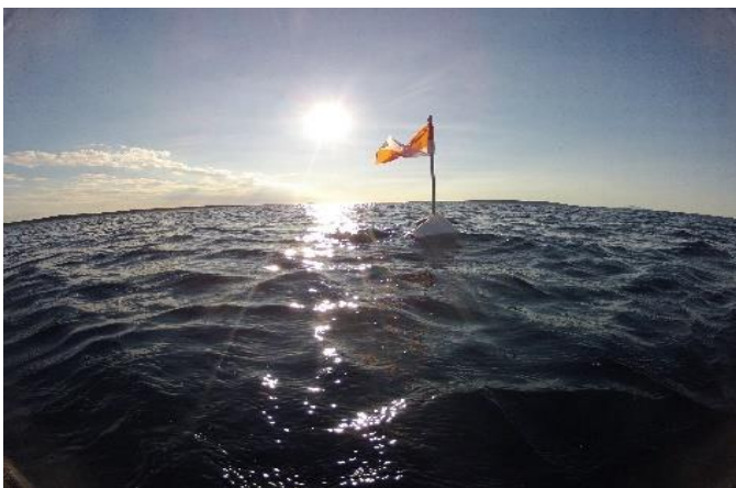
Fotografija 12. Mjesto gađanja obilježeno plutačom na površini