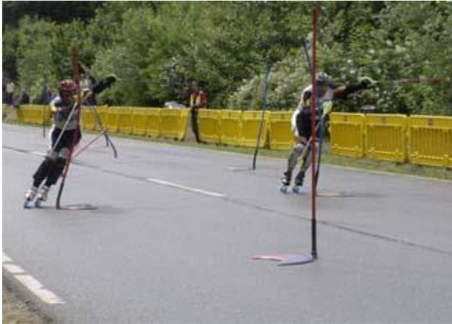
Slika 4. Paralelni slalom na rolama