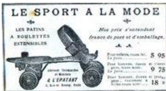
Slika1. Jedne od prvih izumljenih rola

Prve patentirane inline role s tri kotača u nizu izumio je M. Petibled iz Pariza, a bile su izrađene od drveta, slonovače ili željeza.