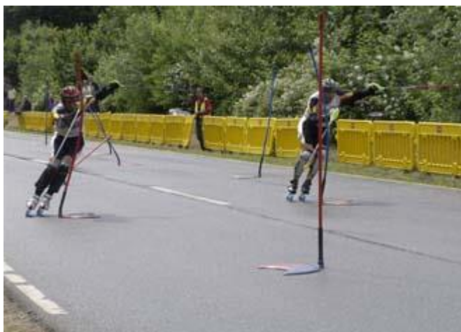
Slika 4. Paralelni slalom na rolama