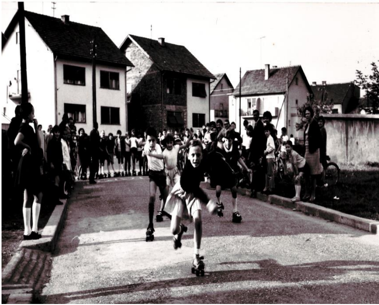
Slika 2. Školsko natjecanje u rolanju

Sredinom 90-ih godina rolanje se izgubilo u Hrvatskoj, dok je u ostatku svijeta bilo na vrhuncu popularnosti. Tek 2002. godine osniva se Zagrebački koturaljkaški savez (ZKS) i inline rolanje ulazi u nomenklaturu sportova, a 2003. osniva se Koturaljkaški savez Hrvatske (KSH) koji dvije godine kasnije postaje punopravni član Hrvatskog olimpijskog odbora.