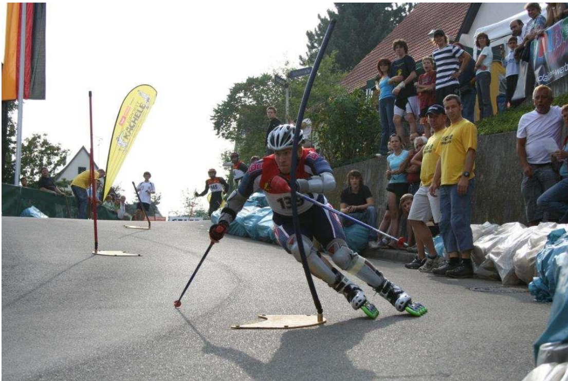
Slika 3. Inline Alpine slalom utrka

U ovom diplomskom radu stavljen je naglasak na alpske discipline, osobito Inline Alpine slalom i veleslalom. Alpske discipline su nova grana rolanja i, kao što im i sam naziv govori, one su rolerska verzija alpskih disciplina skijanja.