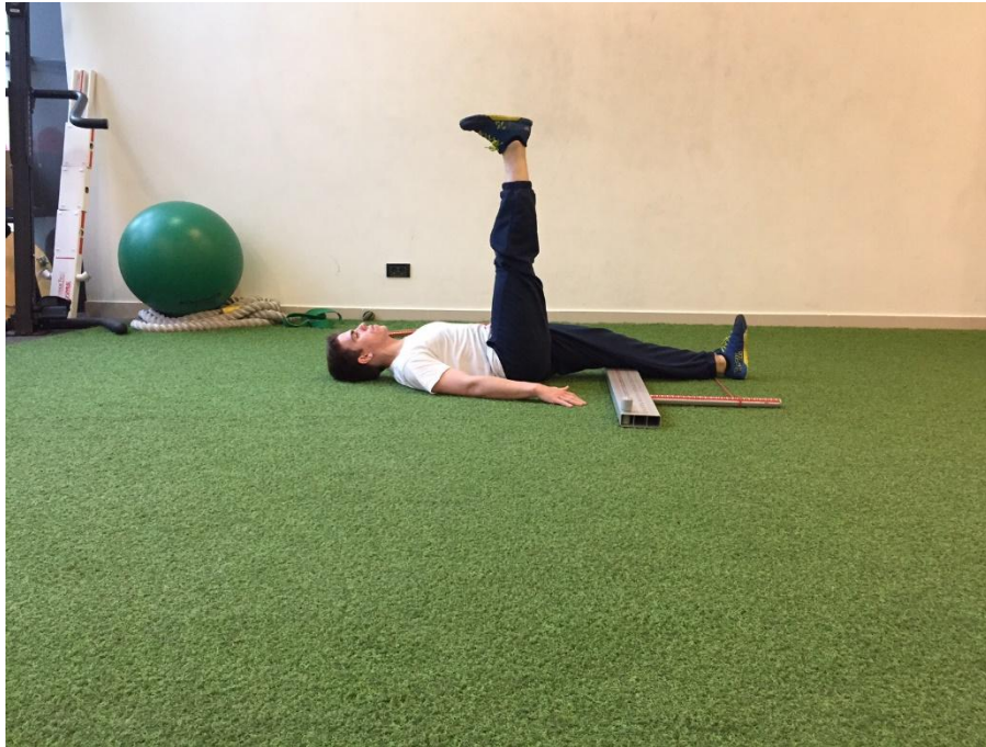
Slika 5. Krajnja pozicija izvedbe testa podizanje pružene noge.

superior (ASIS) i lateralnog kondila femura. Ispitanik test izvodi zadržavajući jednu nogu uz instrument i podižući drugi koliko je moguće gore bez da radi uvijanje u trupu ili bilo kakve suvišne pokrete rukama, trupom i glavom. Kod najviše pozicije noge ispitanika, promatra se pozicija gležnja i je li on prošao ili nije palicu koja treba ostati u okomitom položaju u odnosu na podlogu. Ocjene se dodjeljuju u skladu s kriterijima ocjenjivanja, a već je navedeno da ukoliko je prisutna bol ocjena koja se dodjeljuje je nula (10). Krajnja pozicija podizanja ispružene noge prikazana je na slici 5.