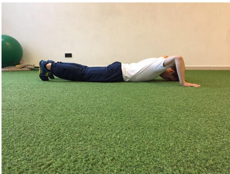
Slika 6. Početna pozicija izvođenja testa sklek.

odnosno žensku populaciju što je i razumljivo s obzirom da je moguće da upravo jakost, koja nije cilj testa, bude limitirajući faktor za žensku populaciju. Laktovi su u svim pozicijama postavljeni pod pravim kutem, a dlanovi su kod početne pozicije za muške u razni čela dok su kod žena u razini brade. Niža razina za muške je visina brade, a za žene visina ramena. Najnižu ocjenu predstavlja nemogućnost izvođenja optimalnog pokreta u olakšanim uvjetima druge razine koja je već opisana u prethodnom djelu teksta. Optimalno izvođenje pokreta podrazumijeva da se leđa podižu istovremeno s gornjim djelom tijela, da su koljena opružena i da su gležnjevi u neutralnoj poziciji sa stopalima usmjerenim prema podu. Kao i svi testovi i sklek ima tri pokušaja za postizanje najboljeg rezultata. Kriterij ocjenjivanja prije je djelomično objašnjen, a valja naglasiti da je uz prisutnu bol test ocjenjen s nulom (10). Početna pozicija izvedbe skleka prikazana je na slici 6.