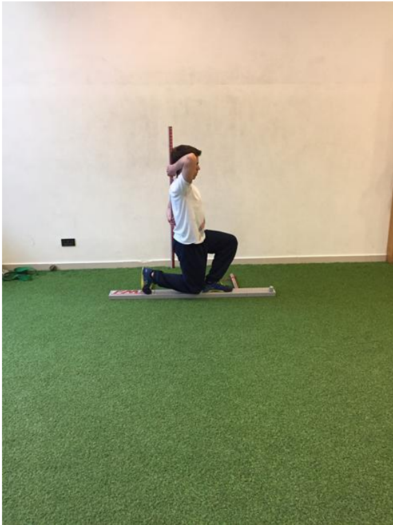
Slika 3. Krajnja pozicija iskoraka na liniju.

vraća u početnu poziciju bez narušavanja ravnoteže odnosno kontrole. Ukoliko ispitanik padne s instrumenta ili se osloni jednom nogom na podlogu test se ponavlja. Pravila dodjeljivanja ocjena vrijede kao i u prethodnim zadacima (9). Krajnja pozicija iskoraka na liniju prikazana je na slici 3.