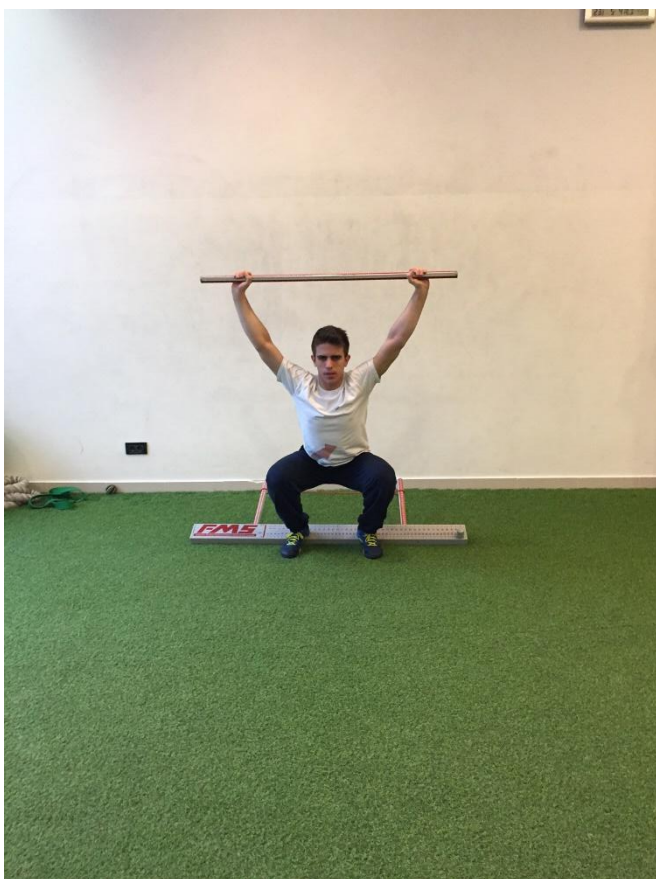
Slika 1. Krajnja pozicija dubokog čučnja.