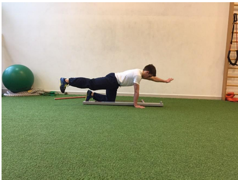
Slika 7. Krajnja pozicija izvedbe testa rotacijska stabilnost.

za napraviti taj pokret bez kompenzacija, za ocjenu 2 ispitanik radi ekstenziju u kuku jedne i fleksiju u ramenu kontralateralne strane. Nakon maksimalnog opružanja ispitanik mora spojiti lakat ruke i koljeno noge koja izvodi pokret i ponovno doći u opruženi položaj kako bi mu se test priznao kao ispravan. Kao i svi ostali, i ovaj se ponavlja najviše tri puta i ocjenjuje sukladno kriteriju ocjenjivanja (10). Krajnja pozicija izvedbe testa rotacijska stabilnost za ocjenu 2 prikazana je na slici 7.