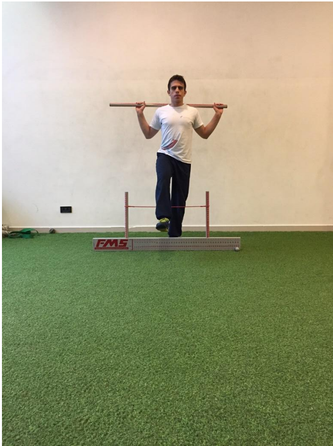
Slika2. Izvedba testa prekorak.