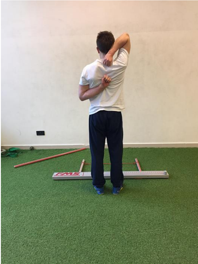
Slika4. Krajnja pozicija izvedbe testa pokretljivosti ramena.