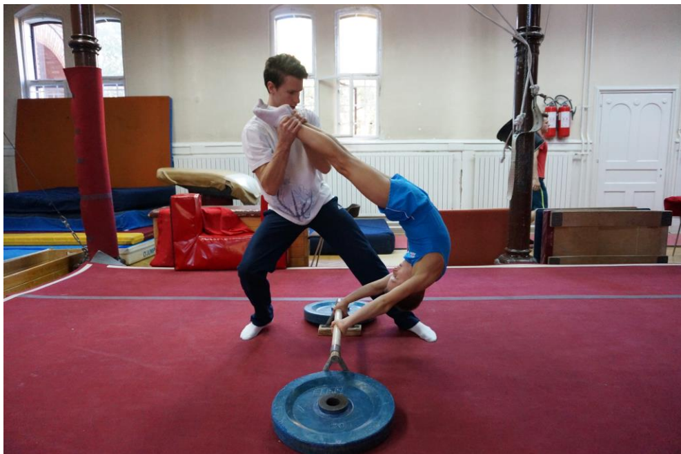
Slika 8. Predvježba za velekovrtljaj natrag na preči uz asistenciju