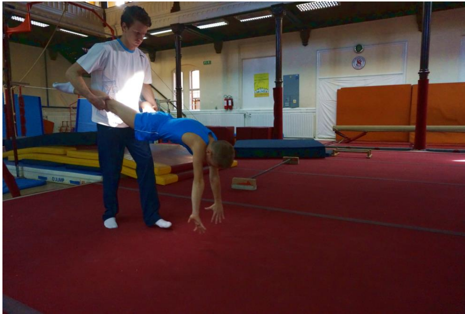
Slika 4. Odrivi iz skleka uz asistenciju