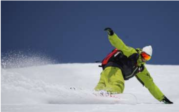
Slika 7.5.1.: Napredni zavoji