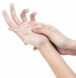
Slika 5. Trljanje palcem

Trljanje se izvodi kružnim pokretima u obliku malih krugova, korištenjem palca, vrhova prstiju ili, na većim površinama, cijelim dlanom, odnosno šakom (slika 5.). Ova tehnika masaže najpogodnija je i najčešće korištena na području zglobova, te pri razbijanju tvrdih nakupina tkiva. Također, pomaže i pri smanjenju oteklina, koje su posljedica upale živaca (Medved, 1980 i Stetoskop, 2017).