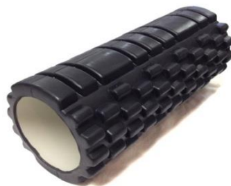
Slika 2. Grid roller

b) Grid roller (slika 2.) : Za razliku od standardnog valjka, grid roller ne gubi oblik i funkcionalnost tijekom vremena. Njegova glatka površina oponaša ručnu masažu dlanovima dok izbočeni dijelovi daju dojam masaže prstima. Takva specifična građa i oblik osigurava bolju cirkulaciju i oksigenizaciju krvi, te time krv i hranjive tvari dolaze do bolnih i oštećenih mjesta na mišiću.