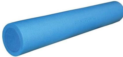
Slika 1. Standardni valjak

a) Standardni valjak (slika 1.): izrađen je od posebne spužve, služi za masažu mišića te je vrlo dobar kao nestabilna podloga za vježbe stabilnosti trupa. Može biti različitih boja (plava, bijela i crna). Plavi je najmekši i izaziva najslabiji pritisak na mišiće.