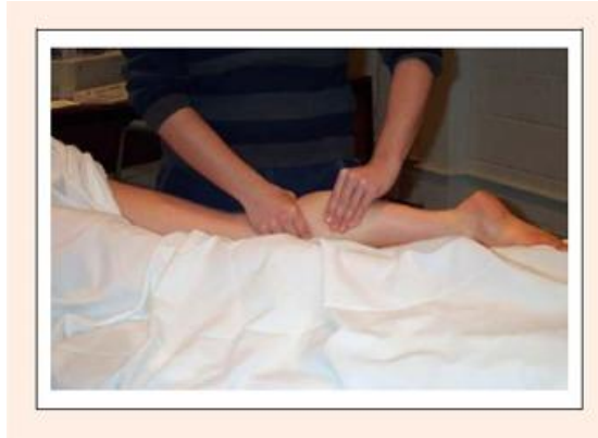
Slika 7. Gnječenje (Arabaci, 2008)