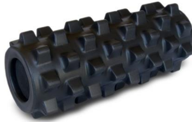
Slika 3. Rumble roller