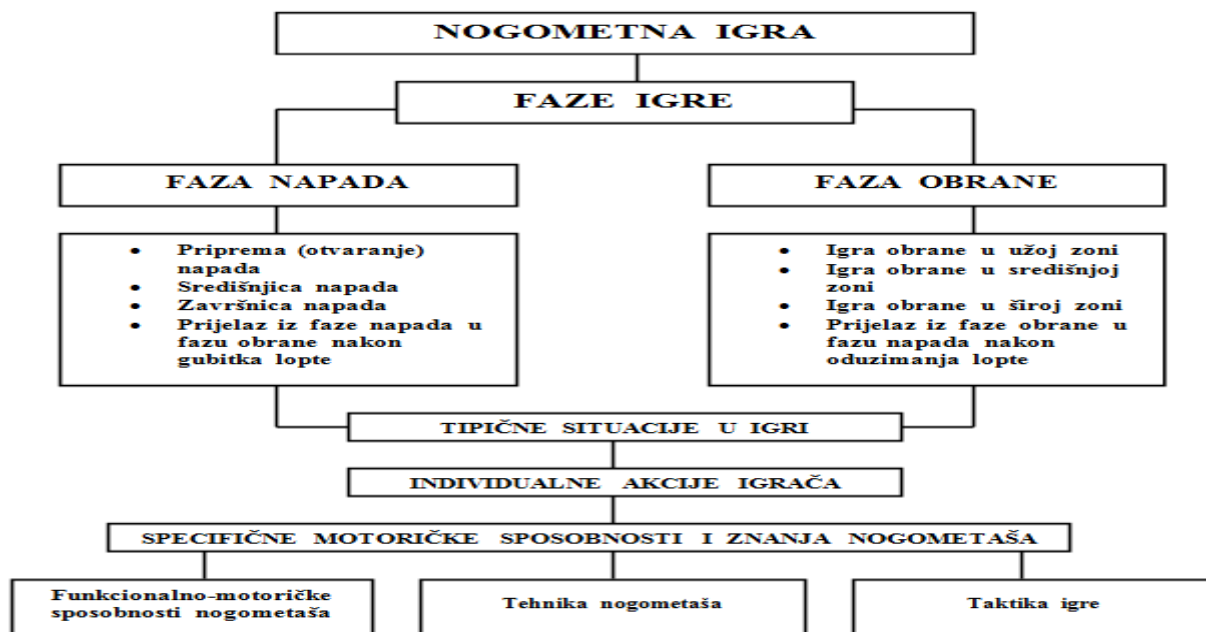
Prikaz 1. Shematski prikaz faza nogometne igre (Jerković, 1996.)

Važnost prihvaćanja i prepoznavanja ovih faza i podfaza ogleđa se u činjenici da pojedinačno ponašanje igrača mora biti podređeno kolektivnom učinku momčadi. Takav pristup potvrđuje uvid da je nogomet igra visokog stupnja taktičke složenosti. (Barišić, 2007.)