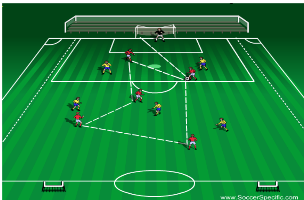
Prikaz 5. Posjed lopte 5 vs 5 + vratar