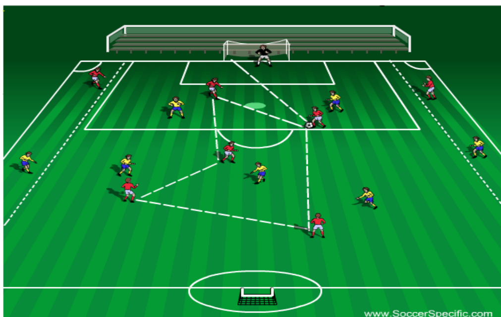
Prikaz 9. 5 vs 5 + 4 + vratar