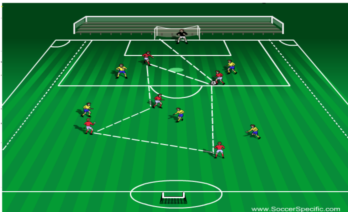
Prikaz 6. Posjed lopte 5 vs 5 + vratar